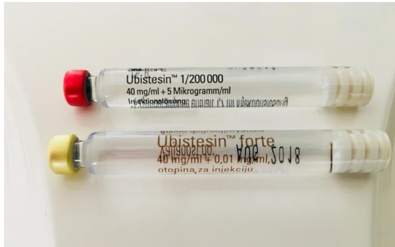
Slika 4. Ampula lokalnog anestetika koja se umeće u karpul-štrcaljku

Artikain (Ubistesin, Ubistesin forte) amidni je lokalni anestetik koji se u dentalnoj medicini rabi kao 4 %-tna otopina s vazokonstriktorom ili bez njega u razrjeđenju 1 : 100 000 i 1 : 200 000. Dolazi i u ampulama od 1,7 i 1,8 mililitara koje se umeću u karpul štrcaljku (Slika 4.) (14).