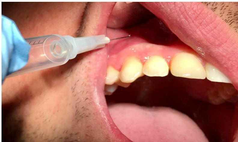
Slika 2. Infiltracijska anestezija u gornjoj čeljusti.

Infiltracijska (pleksus) anestezija anestezira terminalne živčane završetke gornjeg i donjeg dentalnog spleta. Primjenjuje se kod vađenja zuba u maksili i u mandibuli. U maksili s obzirom na njezinu koštanu građu, tanku kompaktu i oskudno razvijenu spongiozu, sva je područja moguće anestezirati samo primjenom pleksus anestezije (Slika 2.). U mandibuli, zbog debele kompakte i dobro razvijene spongioze, infiltracijska anestezija koristi se samo u frontalnom području (14).