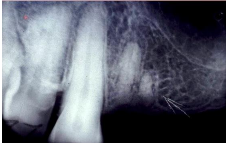
Slika 5. Fraktura krune zuba