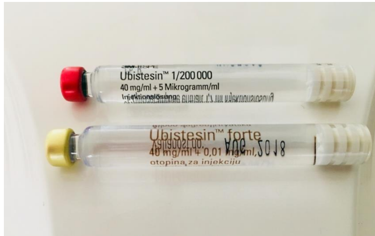
Slika 4. Ampula lokalnog anestetika koja se umeće u karpul-štrcaljku

Artikain (Ubistesin, Ubistesin forte) amidni je lokalni anestetik koji se u dentalnoj medicini rabi kao 4 %-tna otopina s vazokonstriktorom ili bez njega u razrjeđenju 1 : 100 000 i 1 : 200 000. Dolazi i u ampulama od 1,7 i 1,8 mililitara koje se umeću u karpul štrcaljku (Slika 4.) (14).