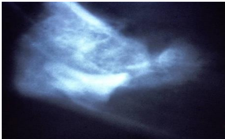
Slika 6. Utisnuće zuba sublingvalno

U okolnu gingivu ili sluznicu u pravilu se može utisnuti korijen zuba (Slika 6.). Pritom kod donjih korijena najčešće dolazi do utisnuća u lingvalnu, a kod vestibularnih gornjih korijena u vestibularnu sluznicu. To se najčešće događa kada se polugama bez preglednosti radnog polja želi izvaditi prelomljeni korijen.