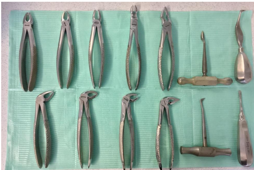
Slika 1. Kliješta i poluge za vađenje zuba u gornjoj i donjoj čeljusti

Osnovni instrumentarij za ambulantno vađenje zuba čine kliješta i poluge (Slika 1.). Oni su konstruirani prema morfologiji zuba, njihovoj veličini i položaju u zubnome nizu te tehnici ekstrakcije.