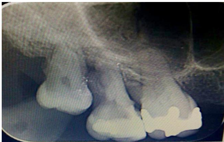
Slika 9. Blizak odnos korijena gornjeg prvog i drugog molara i maksilarnog sinusa

Blizak odnos s dnom maksilarnog sinusa najčešće imaju gornji prvi molar, drugi premolar i drugi molar (Slika 6.) (1).