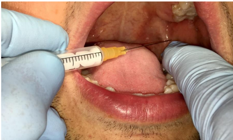
Slika 3. Mandibularna anestezija u donjoj čeljusti.

Područje analgezije obuhvaća pulpu svih donjih zuba te strane, korpus i donji dio ramusa mandibule, vestibularnu sluznicu i periost do prvog donjeg kutnjaka, prednje 2/3 jezika i dno usne šupljine te lingvalnu sluznicu i periost. Za područje bukalne sluznice kutnjaka potrebna je dodatna infiltracijska anestezija odnosno blok bukalnog živca (14).