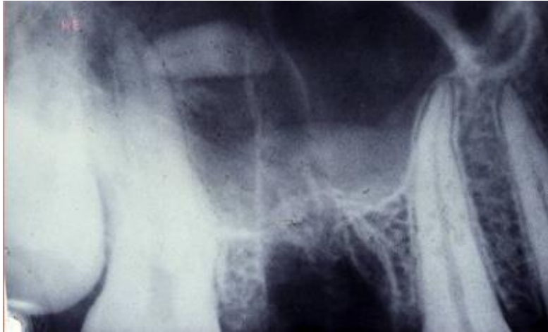
Slika 7. Utisnuće korijena zuba u maksilarni sinus