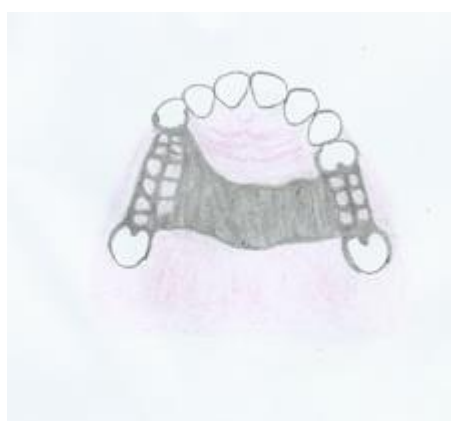
Slika 3. Racionirana nepčana ploča