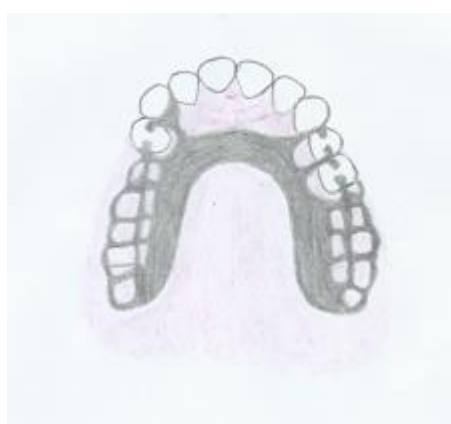
Slika 2. Reducirana nepčana ploča