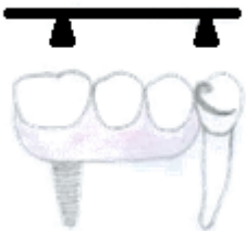
Slika 10. Rješavanje nepovoljnog sustava poluge na produženom sedlu djelomične proteze upotrebom implantata

Ohkubo i suradnici (22) su u in vitro eksperimentu na modelu koji predstavlja mandibulu s bilateralno skraćenim zubnim lukom mjerili i analizirali razliku u distribuciji sile i pomicanju proteze kod konvencionalnih i implantatima poduprtih djelomičnih proteza. Rezultati su