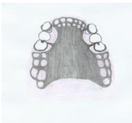
Slika 1. Totalna nepčana ploča