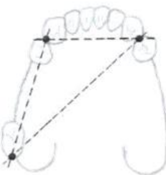
Slika 6. Trokutasto podupiranje djelomične proteze