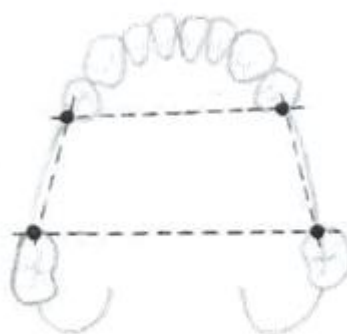
Slika 5. Poligonalno podupiranje djelomične proteze