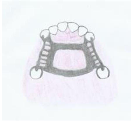
Slika 4. Skeletirana nepčana ploča

Retencija je snaga kojom se djelomična proteza odupire silama koje je nastoje odvojiti od njezinog ležišta, a ona se postiže dizajnom proteze odnosno dijelovima proteze koji služe retenciji.