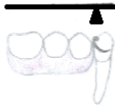
Slika 9. Nepovoljni sustav poluge na produženom sedlu djelomične proteze

Situacije u kojima je najteže postići dobru stabilizaciju i distribuciju sila konvencionalnim djelomičnim protezama jesu Kennedy Klasa I i II, odnosno proteze s obostrano i jednostrano produženim sedlom. Tako su u literaturi kao glavna indikacija za implantatima poduprte djelomične proteze navedene situacije Kennedy Klase I i II koje se upotrebom implantata pretvaraju u povoljniju situaciju Kennedy Klase III (21). To znači da se manjim brojem dodatnih implantata na strateški važnim mjestima smanjuje opasnost od loma uporišnih zubi kod mobilnih nadomjestaka, čime se znatno poboljšava dugoročna prognoza preostalih zubi (Slika 9., Slika 10.) (17).