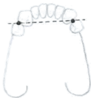
Slika 7. Linearno podupiranje djelomične proteze