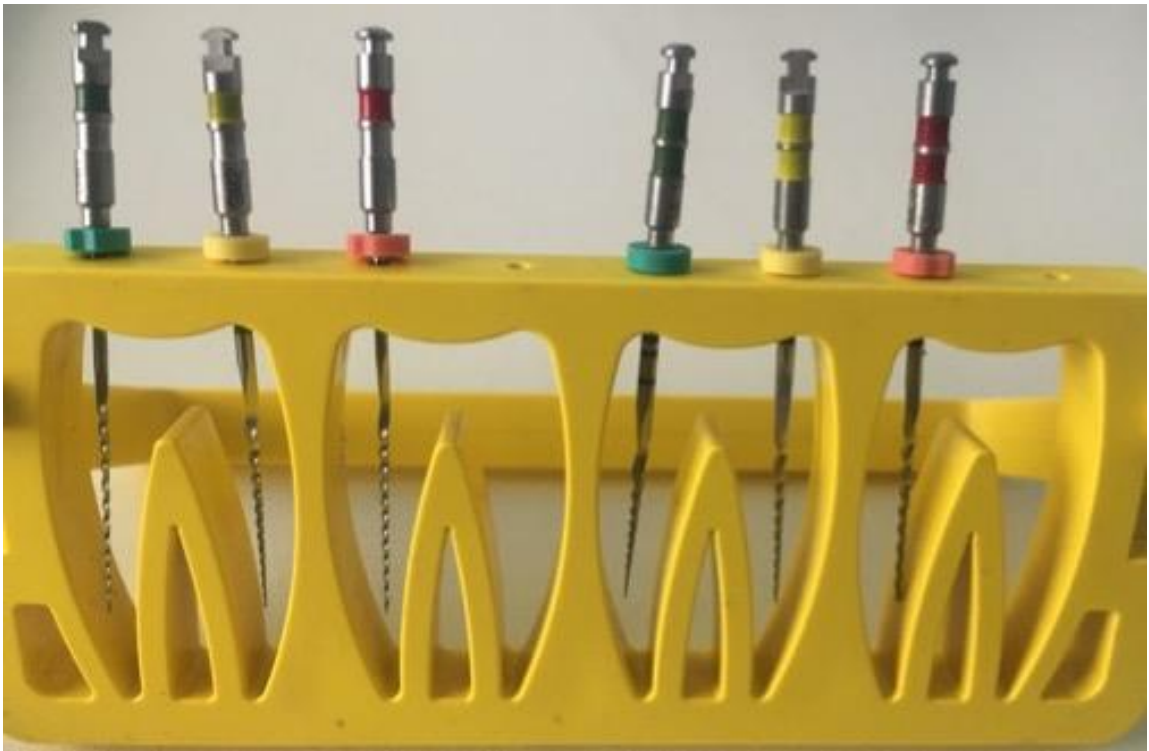
Slika 6. TF Adaptive instrumenti.

TF Adaptive instrumenti su jedinstveni Ni-Ti instrumenti trokutastog presjeka i neaktivnog vrha dobiveni tehnikom uvijanja (Slika 6.) što je postignuto toplinskom obradom instrumenta u R-fazi i završnim kondicioniranjem površine čime se postiže poliranost instrumenta (48). Tijekom procesa proizvodnje sirova žica se zagrijava pri čemu kristalična struktura iz austenične prelazi u R-fazu, koja ima izvrsna svojstva superelastičnosti te sposobnost memorije. Također, ima manji Youngov modul elastičnosti nego austenit (49). Žica u R-fazi može se savijati te se nakon oblikovanja instrument ponovno zagrijava i hladi kako bi zadržao svoj željeni oblik. Konačno, instrument se vraća u austeničnu fazu. Prednost ovakvog načina proizvodnje očituje se u manjoj incidenciji mikrofraktura na površini instrumenta i zadržavanju visoke rezne učinkovitosti (50).