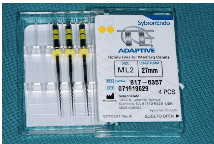
Slika 8. ML2 TF Adaptive instrumenti.

Kod normalnih i većih kanala (kad se radna duljina lagano postiže ručnim instrumentom #15, prema ISO standardu) koristi se ML (medium/large) set s instrumentima: ML1 (dva zelena prstena, veličina 25, konicitet 0,08), ML2 (dva žuta prstena, veličina 35, konicitet 0,06), ML3 (dva crvena prstena, veličina 50, konicitet 0,04). (Slika 8.). Instrumenti u oba seta označeni su od manjega prema većemu, bojama po uzoru na semafor: zelena, žuta i crvena. Svi instrumenti se koriste do pune radne duljine.