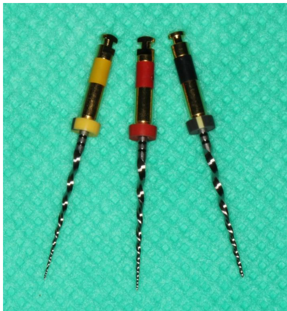
Slika 1. WaveOne instrumenti.

WaveOne (Dentsply Sirona, Ballaigues, Švicarska) je Ni-Ti sustav s recipročnim motorom koji koristi recipročni pokret od 170° CCW i 50° CW (9). Puni krug postiže se nakon tri ciklusa recipročnog pokreta, što omogućuje brže postizanje radne duljine, bolju reznu učinkovitost i uklanjanje debrisa (10). WaveOne je tehnika instrumentacije korijenskog kanala koja koristi jedan instrument (3). Instrumenti se izrađuju od Ni-Ti legure koja je podvrgnuta termomehaničkoj obradi sirove žice (pod određenim temperaturama i napetosti) te tako u svom sastavu sadrži austenit, martenizit i R-fazu, čiji omjeri ovise o uvjetima obrade. Upravo zbog toga odlikuje se većom temperaturom transformacije, nižim modulom elastičnosti, manjim transformacijskim stresom (11). M-žica na taj način povećava ukupnu otpornost i fleksibilnost instrumenta. U setu postoje tri instrumenta: žuti (veličina 21, konicitet 0,06), crveni (veličina 25, konicitet 0,08) i crni (veličina 40, konicitet 0,08) u tri duljine 21, 25 i 31 mm (Slika 1.). Instrumenti imaju izgled obrnute spirale i različit poprečni presjek duž radnoga dijela. U koronarnoj i srednjoj trećini poprečni presjek je konveksni trokutasti, dok je u apikalnoj trećini modificirani trokutasti. Upravo ovakav dizajn instrumenta omogućuje napredovanje kroz kanal uz maksimalnu sigurnost (3). Preporuka je da se kanal najprije instrumentira s ručnim instrumentom, a zatim se rabe WaveOne instrumenti (12).