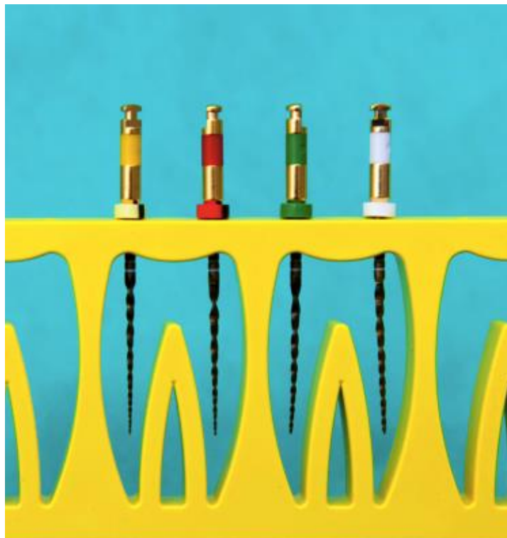
Slika 2. WaveOne Gold instrumenti.

WaveOne Gold (Dentsply Sirona, Ballaigues, Švicarska) je recipročni sustav koji, u usporedbi s WaveOne instrumentima, ima promijenjenu geometriju i dimenzije instrumenta, dok je recipročni pokret jednak kao kod WaveOne instrumenta (13). Posebnost ovog sustava je u obradi instrumenata koji se tijekom proizvodnje zagrijavaju te potom toplinski obrađuju zlatom što rezultira njihovom fleksibilnošću (14). Poprečni presjek instrumenta je oblika paralelograma s dvije oštice od 85^\circ koje su u kontaktu s dentinskim zidom. Na taj se način smanjuje dodirna površina tijekom instrumentacije, što smanjuje mogućnost urezivanja instrumenta u dentin. Instrumenti su dostupni u četiri veličine: maloj (veličina 20, konicitet 0,07, žuta), osnovnoj (veličina 25, konicitet 0,07, crvena), srednjoj (veličina 35, konicitet 0,06, zelena) i velikoj (veličina 45, konicitet 0,05, bijela) te tri duljine 21, 25 i 31 mm (13) (Slika 2.).