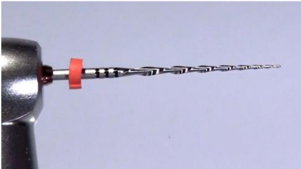
Slika 3. Reciproc R25 instrument.

Godine 2011. Ghassan Yared je predstavio Ni-Ti recipročni sustav namijenjen obradi kanala jednim instrumentom pod nazivom Reciproc (VDW, München, Njemačka). Sustav sadrži tri instrumenta: R25 (veličina 25, konicitet 0,08) za uske kanale (Slika 3.), R40 (veličina 40, konicitet 0,06) za normalnu veličinu kanala i R50 (veličina 40, konicitet 0,05) za široke kanale. Konicitet je konstantan u apikalna 3 mm instrumenta, a potom se smanjuje (15). Proizvodnja od M-žice daje mu povećanu fleksibilnost i otpornost na ciklički zamor materijala (16, 17). Poprečni presjek je oblika slova S, s dvije režuće oštice, što mu omogućuje veću fleksibilnost i rezu učinkovitost (18, 19). Proizvođač navodi da prethodno nije potrebno proširiti kanal ručnim instrumentom bez obzira na zavijenost kanala (15). Koristi pokrete 150° CCW i 30° CW (20).