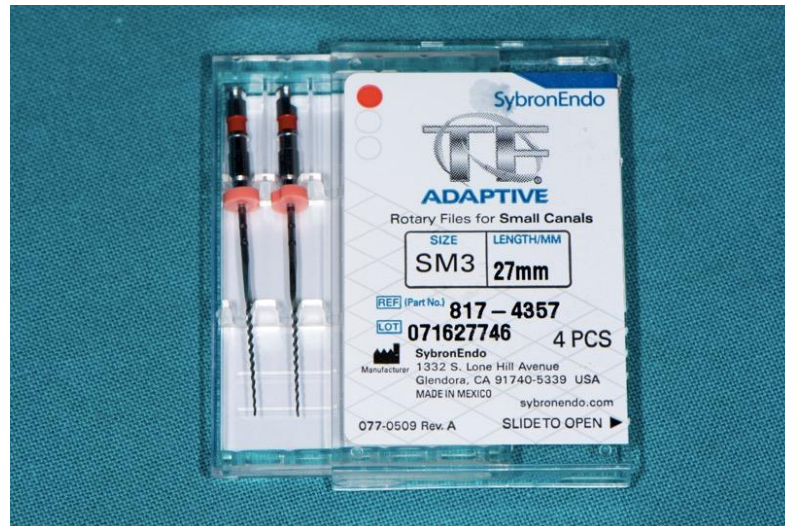
Slika 9. SM3 TF Adaptive instrumenti.

Za instrumentaciju kanala TF Adaptive tehnikom rabe se minimalno dva instrumenta jer najveći instrumenti u setovima (crveni SM3 i ML3) (Slika 9.) nisu obavezni i koriste se samo kod potrebe za dodatnim proširenjem apikalnog dijela kod širokih kanala. Instrumenti se mogu sterilizirati.