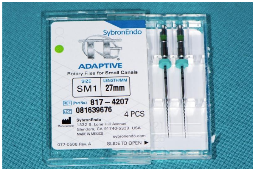
Slika 7. SM1 TF Adaptive instrumenti.