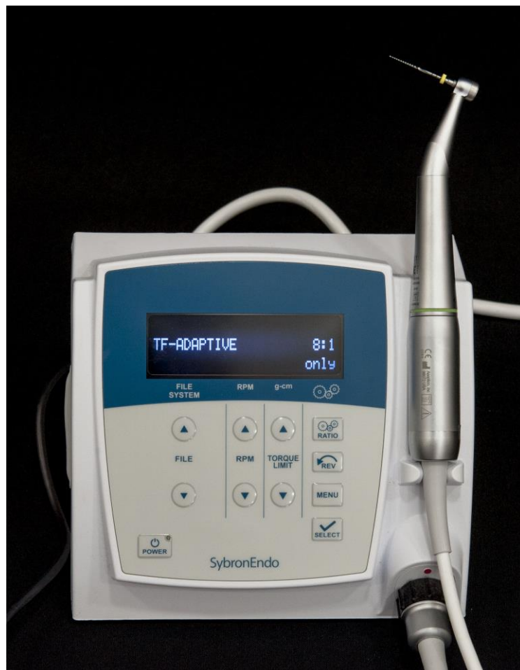
Slika 5. Elements Motor, Axis/SybronEndo, SAD.

Twisted File Adaptive (TF Adaptive) (Axis/SybronEndo, Orange, SAD) je Ni-Ti sustav s jedinstvenim motorom (Elements Motor, Axis/SybronEndo, SAD) (Slika 5.) koji, ovisno o stresu tijekom instrumentacije korijenskih kanala, kombinira rotacijske i recipročne kretnje. Kada instrument u kanalu nije pod stresom ili je pod minimalnim stresom, koristi CW kretnju do 600° omogućujući na taj način bolje čišćenje i oblikovanje kanala te više uklanjanja debrisa. S druge strane, kada je instrument u kanalu izložen stresu, motor to prepoznaje pomoću složenog algoritma te se automatski prilagođava, ovisno o jačini stresa, koristeći pokrete od 370° CW i do 50° CCW pri brzini od 400 rpm. Korištenje recipročnog pokreta smanjuje mogućnost nastanka pogreški pri radu, a da pritom ne utječe na samu izvedbu pokreta. Uočena je i manja incidencija pojave postoperativne boli zbog manjeg potiskivanja debrisa apikalno i lateralno što je omogućeno rotacijskim pokretima, te korištenjem fleksibilnih instrumenata (47).