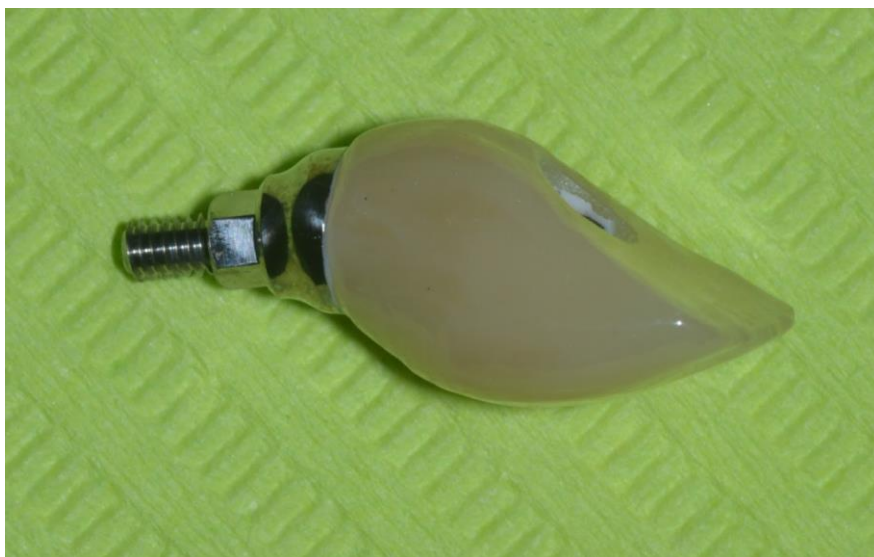
Slika 3. Krunica učvršćena vijkom.