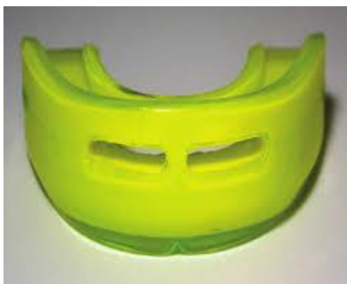
Slika 2. Djelomično prilagodljivi štitnik.

Djelomično prilagodljivi štitnici modifikacija su konfekcijskih štitnika koja se individualno prilagođuje u ustima, najčešće kod kuće (Slika2.). Cijeli štitnici ili pojedini njihovi dijelovi izrađeni su od termoplastične mase koja u vrućoj vodi omekša i prilagođuje se strukturama u ustima. Takvi štitnici svakako su bolje prilagođeni strukturama u ustima te je i njihovo prijanjanje uz gornju čeljust obično bolje. No, s obzirom na kratko vrijeme u kojem su u plastičnoj fazi, često ta prilagodba nije dovoljno dobra da bi omogućila njihovu retenciju bez pridržavanja jezikom ili suprotnom čeljusti. Osim toga, plastičnost tih štitnika postiže se uranjanjem na nekoliko minuta u kipuću vodu. Pri tome je moguća njihova deformacija prije unošenja u usta, a i njihova prilagodba u ustima otežana je zbog neugode koju izaziva visoka temperatura u dodiru sa zubima. Nedostatak takvih štitnika jest i proizvoljan položaj koji donja čeljust zauzima tijekom udarca, a definiran je “zagrizom” u fazi prilagodbe štitnika. Tako uzet “zagriz” može biti ekscentričan ili znatno odudarati od položaja centrične relacije. Distribucija sila pri udarcu može tada biti takva da zbog nepravilnog položaja čeljusti sile budu usmjerene na neku od s čeljustima povezanih struktura. Tada nastaju ozljede ne samo zubi i mekih česti nego i temporomandibularnih zglobova te pripadajućih im tetiva i mišića (10).