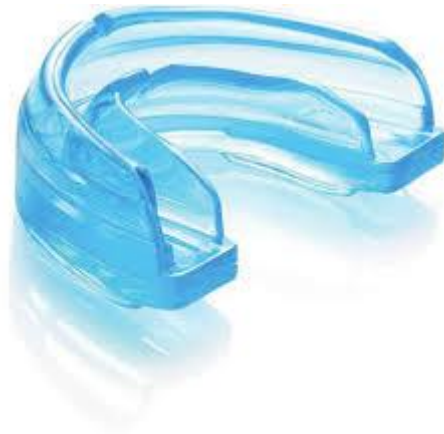
Slika 1. Konfekcijski dentalni štitnik.

Ovi se štitnici mogu kupiti u bilo kojem dućanu sportske opreme, jednostavni su za uporabu i jeftini (Slika1.). U ustima se aktivno pridržavaju stiskanjem zubi pa time onemogućuju slobodno strujanje zraka, odnosno otežavaju disanje. Taj se nedostatak pokušao otkloniti uvođenjem šarnirskog mehanizma. Njihova neprilagođenost individualnim obilježjima žvačnog sustava čini ih neugodnima za nošenje. Spomenuta opstrukcija disanja, baš kada su potrebe za kisikom sportaša velike, često dovodi do toga da se ne rabe koliko i kada bi trebali (10).