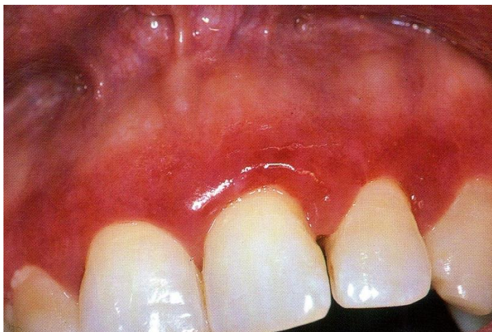
Slika 1. Deskvamativni gingivitis kao očitovanje oralnog lihena planusa. Preuzeto iz: Laskaris G. Atlas oralnih bolesti. Prvo hrvatsko izdanje. Jastrebarsko: Naklada Slap; 2005 (1).

Atrofični ili erozivni lihen planus koji zahvaća gingivu dovodi do DG-a, stanja koje je obilježeno svijetlocrvenim mrljama i edemom, a zahvaća čitavu širinu pričvrzne gingive (30)