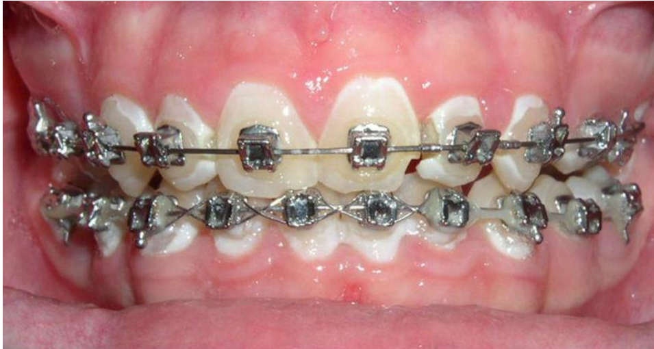
Slika 6: Bije mrlje i karijesne lezije uzrokovane neprimjerenom oralnom higijenom tijekom ortodontske terapije