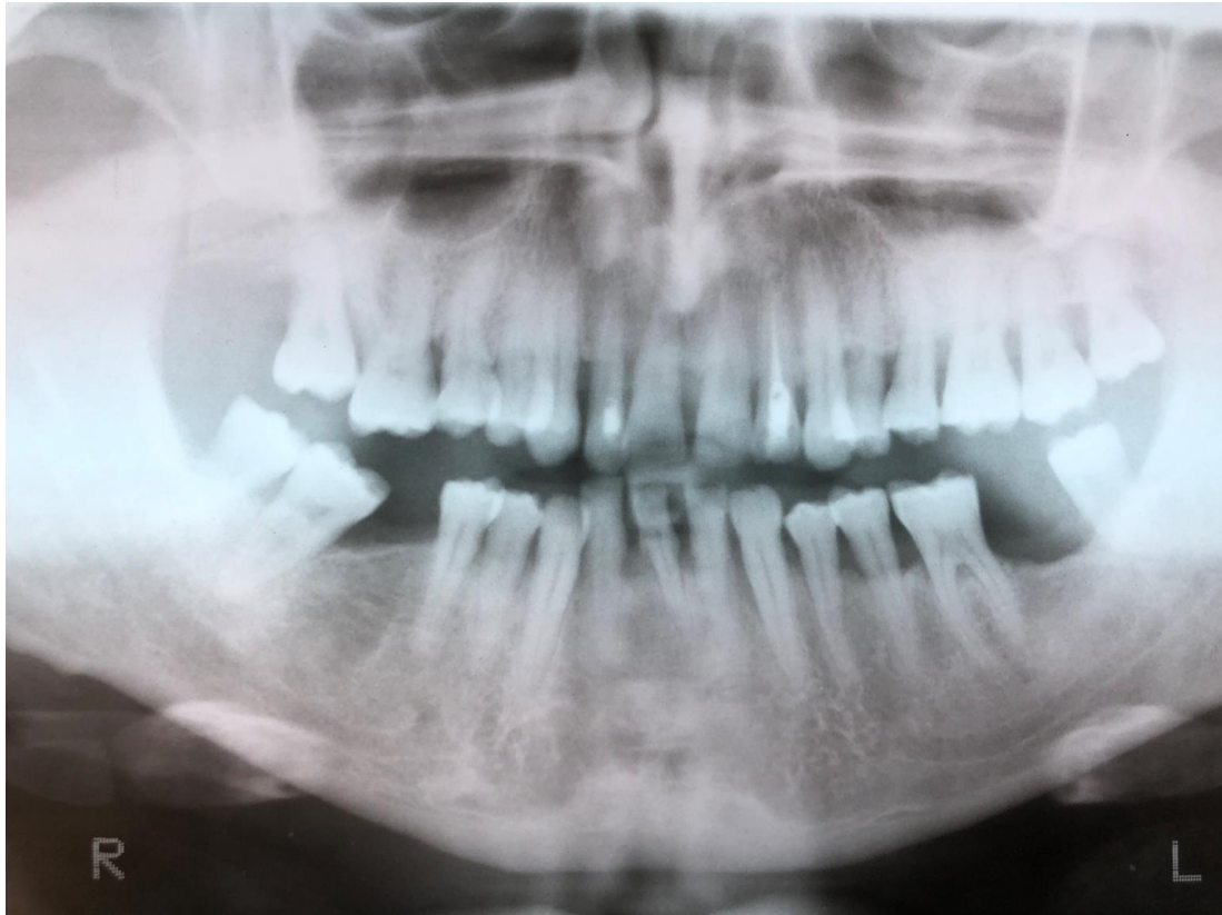
Slika 4- ortopantomogramska snimka čeljusti i zubi pacijenta G.D. 2 godine poslije terapije laserom .(Pismena dozvola pacijenta da se snimka u radu prikaže)