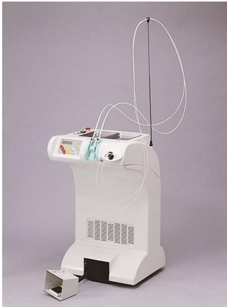
Slika LOKKI Dt Laser