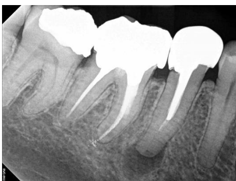
Slika 3. Prekratko punjenje na zubu opskrbljenim lijevanom nadogradnjom i krunicom. Pokušaj uklanjanja nadogradnje povezan je s velikim rizikom od loma korijena