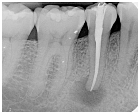
Slika 1. Rendgenska snimka pokazuje periapikalni proces uz naizgled adekvatno punjenje. Kod takvog nalaza važno je utvrditi kada je provedeno liječenje i nalaz usporediti sa starijim snimkama

Treba naglasiti da rendgenska snimka napunjenog kanala ne odražava njegovo biološko stanje. Stoga zadovoljavajuća rendgenska snimka s biološkog stajališta ne mora nužno značiti uspjeh endodontske terapije. Isto tako, u slučaju cijeljenja periapeksne lezije (kada se lezija smanjuje nakon endodontskog liječenja), rendgensko prosvjetljenje oko apeksa može se protumačiti kao periapeksni parodontitis, dok se histološki zapravo može raditi o novostvorenom vezivnom tkivu (9). To je razlog zašto u takvim slučajevima aktualnu RTG snimku treba usporediti sa starijima i pažljivo procijeniti simptome (Slika 1.).