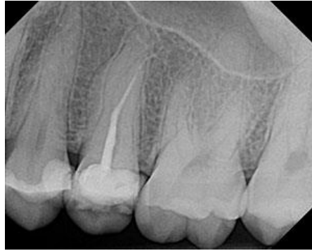
Slika 2. Iako je zub prekratko napunjen i nisu ispunjeni svi kanali, nema kliničkih ni rendgenskih znakova patološkog procesa

Kada se zubi endodontski liječe, treba poštovati pravilo osiguravanja efekta obruča: potrebno je sačuvati najmanje 1,5 do 2 mm koronarnoga tvrdog zubnog tkiva (10). Nadalje, potrebna je odgovarajuća debljina stijenki, osobito palatinalno i bukalno. Ako navedene dimenzije nisu osigurane, mogu se razmotriti dodatni zahvati kao što je ortodontska ekstruzija ili kirurško produljivanje kliničke krune. Međutim, time se povećava složenost terapije kako bi se očuvao zub.