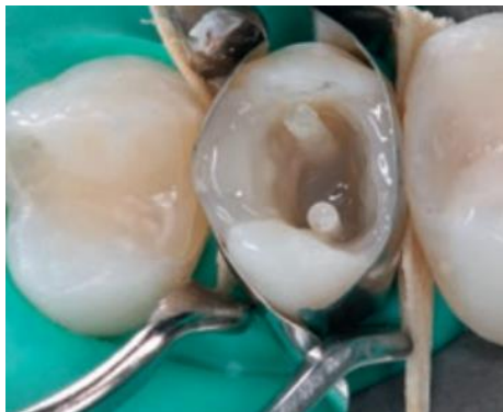
Slika 4. Vlaknima ojačane kompozitne nadogradnje na pretkutnjaku s izgubljenim aproksimalnim stijenkama (preuzeto iz: 8, uz dopuštenje izdavača)

Za prednje zube situacija je potpuno drugačija. Stražnji zubi moraju izdržati tlačna opterećenja, tako da je elastičnost njihovo najvažnije svojstvo. Prednji gornji zubi naglašeno su izloženi savijanju, tako da je rigidnost njihovo najznačajnije obilježje. Na prednjim zubima kompozitne nadogradnje ojačane vlaknima koriste se češće zbog funkcijskih nego adhezivnih razloga kako bi se povećala rigidnost zuba (8).