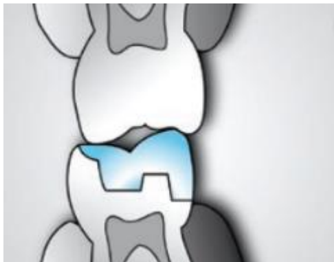
Slika 6. Rubove nadomjeska treba smjestiti izvan područja okluzalnih kontakata (preuzeto iz: 8, uz dopuštenje izdavača)

Što se tiče debljine materijala za pokrivanje kvržica, ona iznosi minimalno 1,5 mm za kompozit i 2 mm za keramiku. Prije nekoliko godina na tržištu se pojavila litij-disilikatna staklokeramika (IPS e.max) koja se odlikuje savojnom čvrstoćom od 360 do 400 MPa i omogućuje debljinu od samo 1 mm (39).