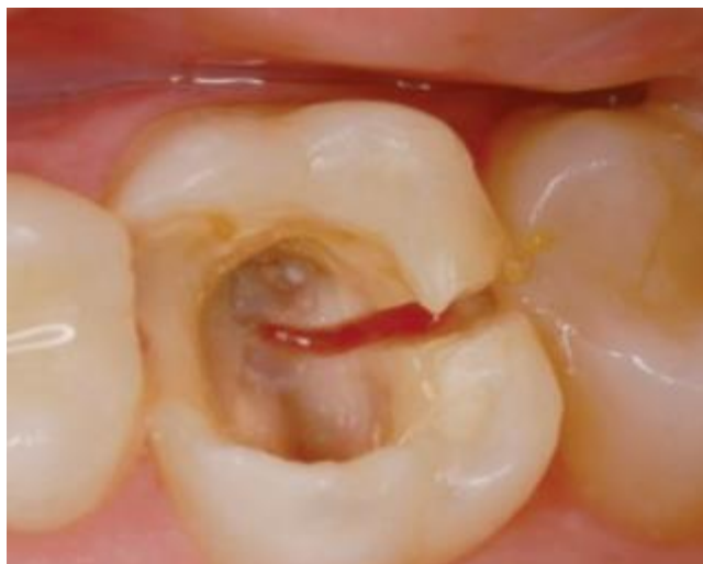
Slika 7. Vertikalna fraktura gornjeg prvog kutnjaka. Jedina terapija je vađenje zuba (preuzeto iz: 8, uz dopuštenje izdavača)