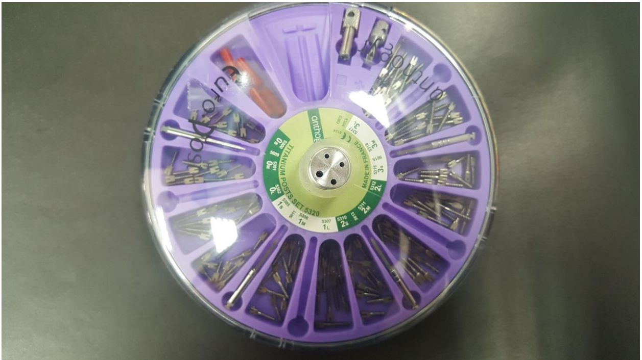
Slika 3. Konfekcijski intrakanalni kolčići