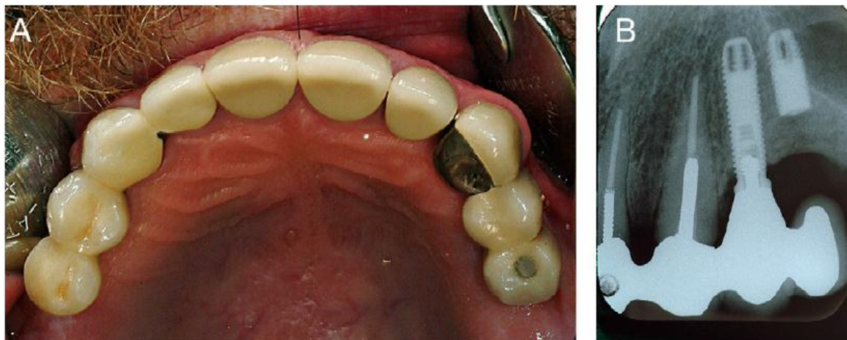
Slika 2. 57-ogodišnji pacijent s frakturom implantata na poziciji 25 uzrokovanoj preopterećenjem. Preuzeto s dopuštenjem (27).

otpuštanje protetskog vijka, odcementiranje, frakture protetskog dijela tzv. „chipping“ keramike, frakture baze proteze i proteznih zuba (39).