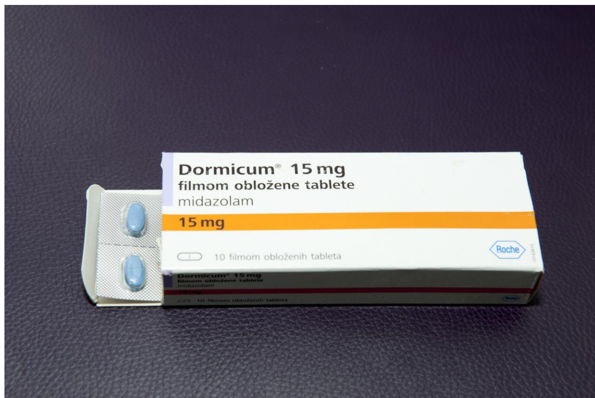
Slika 3. Farmakološka sedacija (midazolam)