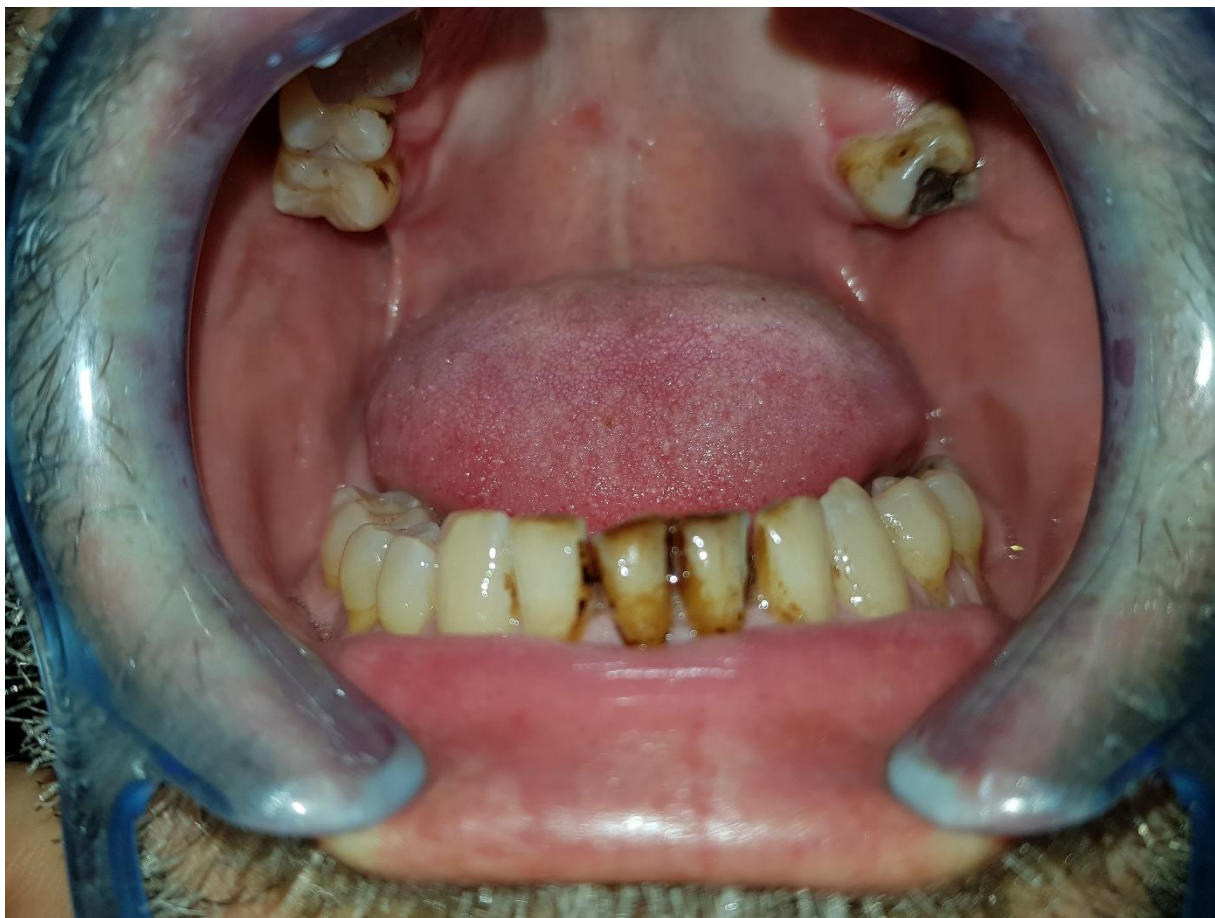
Slika 5. Nikotinski zubi. Ovisnik o pušenju.