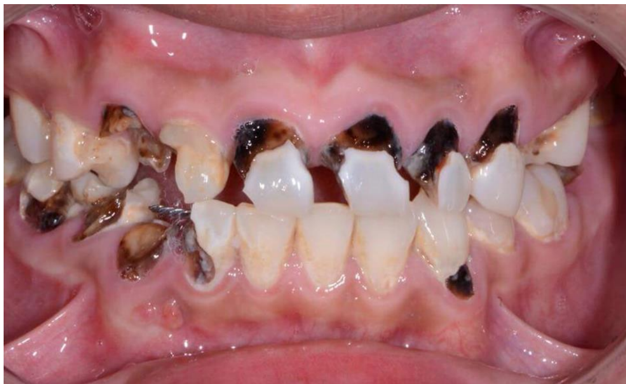
Slika 4. Karijesna oštećenja u ovisnika.

Nalaz u ustima koji bi kod stomatologa trebao pobuditi sumnju na ovisnost o drogama uključuje brzo i neobjašnjivo propadanje zuba zahvaćenih karijesom u mlađih osoba te netipičnu lokalizaciju karijesa (slika 4.) – lokalizacija na mjestima podložnima samočišćenju kao što su bukalne plohe i opsežne destrukcije aproksimalnih ploha prednjih zubi (11).