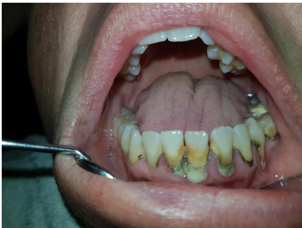
Slika 6. Uznapredovala parodontna bolest. Ovisnik o pušenju i alkoholu.

Kod parodontitisa dolazi do uništenja pričvrstnog aparata zuba. Zubno meso se odvaja od zuba, nastaju tzv. parodontni džepovi koji bivaju inficirani bakterijama i toksinima. Oni razaraju vezivnotkivni pričvrstak, te dolazi do resorpcije kosi, rasklimavanja i ispadanja zubi. Parodontitis je karakteriziran povlačenjem gingive, stvaranjem dubokih džepova između gingive i zuba, promjenom položaja te klimanjem i pomicanjem zuba (slika 6.).