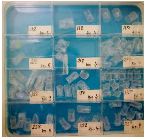
Slika 2. Različite veličine celuloidnih kapica