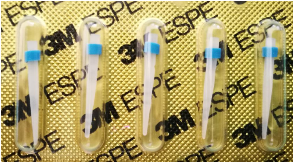
Slika 6. Konfekcijske nadogradnje iz kompozita

Materijali za izradu bataljka jesu amalgam, kompozit i staklenoionomerni cement. Dok amalgam najbolje podnosi opterećenje, on se napušta zbog estetskih razloga. Staklenoionomerni cementi odlikuju se karijesprotektivnim učinkom i niskim koeficijentom termičke ekspanzije, ali su slabije čvrstoće od kompozita (3). Optimalan odabir je nadoknada koronarnog dijela kompozitom u kombinaciji s adhezivno cementiranim vlaknasto ojačanim kompozitnim kolčićem. Ovakva nadogradnja osigurava primjerene mehaničke karakteristike homogenog monobloka zub-kolčić-bataljak, te estetske prednosti zbog svoje boje.