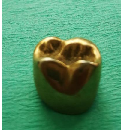
Slika 4. Potpuna kovinska krunica

indicirana zbog estetske neprihvatljivosti u vidljivom području, što ima veliki psihosocijalni utjecaj na mlađe pacijente, postojanja mogućnosti kontaktne alergije na neplemenite legure te nemogućnosti ispitivanja vitaliteta električnim testom (3). Osnova je za fasetirane i metalnokeramičke krunice (15).