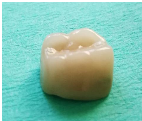
Slika 5. Izgled gotove metal-keramičke krunice

Osnovna konstrukcija može se izraditi lijevanjem, elektrodepozicijom zlata ili drugog metala na dubliranom modelu, primjenom metalne folije i glodanjem metalnog bloka. Dok se osnovna konstrukcija isproba u pacijentovim ustima, gleda se njezin dosjed, odnos prema mekim tkivima te raspoloživ prostor između susjednih zuba te antagonista, koji treba biti dostatan za debljinu estetskoga materijala (3). Sljedeća je faza napečenje keramike u laboratoriju. Odabrana keramika mora imati čvrstu vezu te usklađen toplinski koeficijent rastezanja sa slitinom, malu kontrakciju tijekom pečenja, dobru otpornost na opetovane cikluse pečenja, dovoljnu vlačnu i tlačnu čvrstoću, postojanost u ustima uz dobru reprodukciju boje te optičkih svojstva prirodnog zuba (24). Slijedi analiza vanjske površine, proba gotove krunice te eventualno potrebne korekcije (Slika 5.). Zatim se nadomjestak glazira radi zatvaranja napuklina i pora, uz dobivanje glatkoće i sjaja krunice. Za cementiranje se primjenjuje cink-fosfatni ili stakloionomerni cement (3).