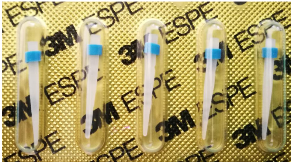
Slika 6. Konfekcijske nadogradnje iz kompozita

Materijali za izradu bataljka jesu amalgam, kompozit i staklenoionomerni cement. Dok amalgam najbolje podnosi opterećenje, on se napušta zbog estetskih razloga. Staklenoionomerni cementi odlikuju se karijesprotektivnim učinkom i niskim koeficijentom termičke ekspanzije, ali su slabije čvrstoće od kompozita (3). Optimalan odabir je nadoknada koronarnog dijela kompozitom u kombinaciji s adhezivno cementiranim vlaknasto ojačanim kompozitnim kolčićem. Ovakva nadogradnja osigurava primjerene mehaničke karakteristike homogenog monobloka zub-kolčić-bataljak, te estetske prednosti zbog svoje boje.