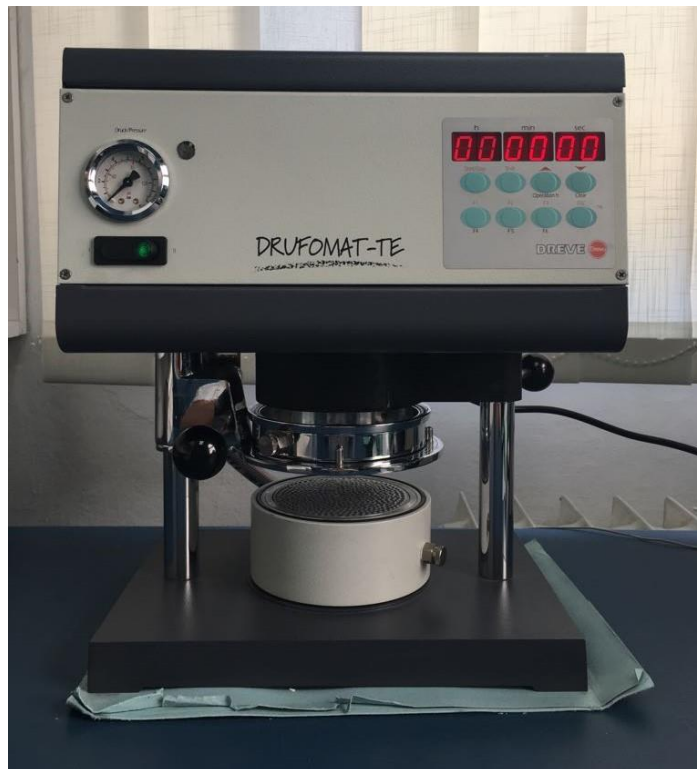
Slika 1. Dreve Druformat termoformirajući uređaj.

Udlaga se napravi od folije, kojih ima raznih debljina. Što je folija tanja, udlaga je udobnija za nošenje. Međutim, tanja folija je manje otporna na jake žvačne sile, pa se brzo troši. Stomatolog po svojoj procjeni odabere foliju koja bi bila adekvatna za bruksističke aktivnosti pacijenta.