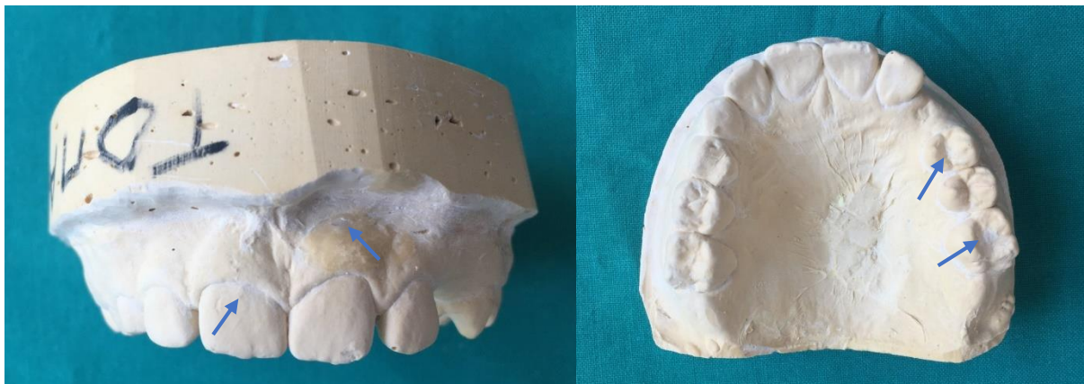
Slika 3. Obrabđeni model gornje čeljusti. Udubljenja su popunjena staklenoionomernim cementom, a izbočenja su uklonjena skalpelom.

U primjeru navedenom na slikama vidi se da pacijent ima mješovitu denticiju i da je lijeva gornja trojka počela nicati. Kada bi otisnuli foliju preko takvog modela, udlaga bi ubrzo počela pacijenta žuljati zbog trojke u erupciji za koju nema mjesta. U takvim situacijama na modelu se može oblikovati prostor za trajni zub koji je u fazi nicanja. Iz kompozitnog materijala ili staklenoionomernog cementa oblikuje se prostor koji može biti nalik sedla (Slika 4.). Bitno je da je u visini zubnog luka, a ne duži ili kraći, te da aproksimalno ostavlja dovoljno mjesta trajnom nasljedniku. Ovom metodom pacijent može ipak malo duže nositi istu udlagu.