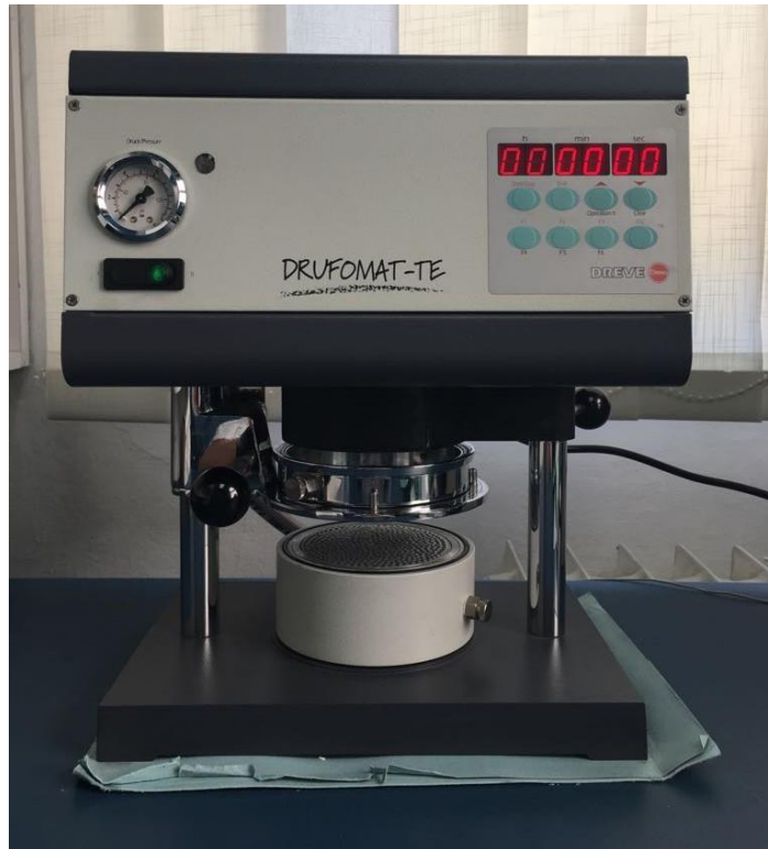
Slika 1. Dreve Druformat termoformirajući uređaj.

Udlaga se napravi od folije, kojih ima raznih debljina. Što je folija tanja, udlaga je udobnija za nošenje. Međutim, tanja folija je manje otporna na jake žvačne sile, pa se brzo troši. Stomatolog po svojoj procjeni odabere foliju koja bi bila adekvatna za bruksističke aktivnosti pacijenta.