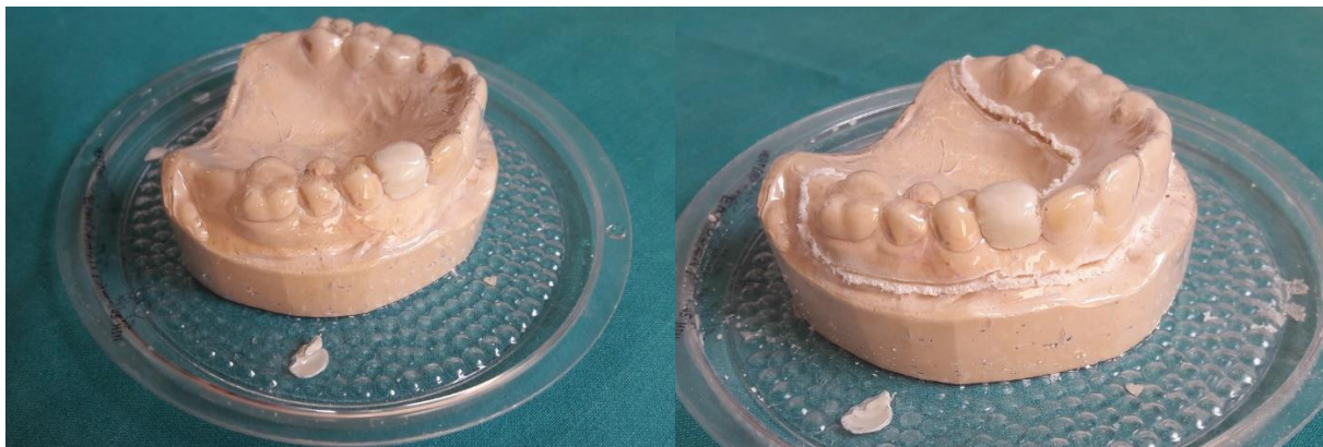
Slika 5. Lijevo: Sadreni model s otisnutom folijom. Desno: uklanjanje viška folije frezom i oblikovanje udlage.

Nakon što se model obradi, stavlja se na postolje u termoformirajući uređaj. Iznad postolja postoji pretinac za foliju. Aparat zagrijava foliju kako bi se ona razmekšala. Vakuumski se folija pripoji uz model. Nakon što se ohladi, model s folijom spreman je za oblikovanje (Slika 5.).