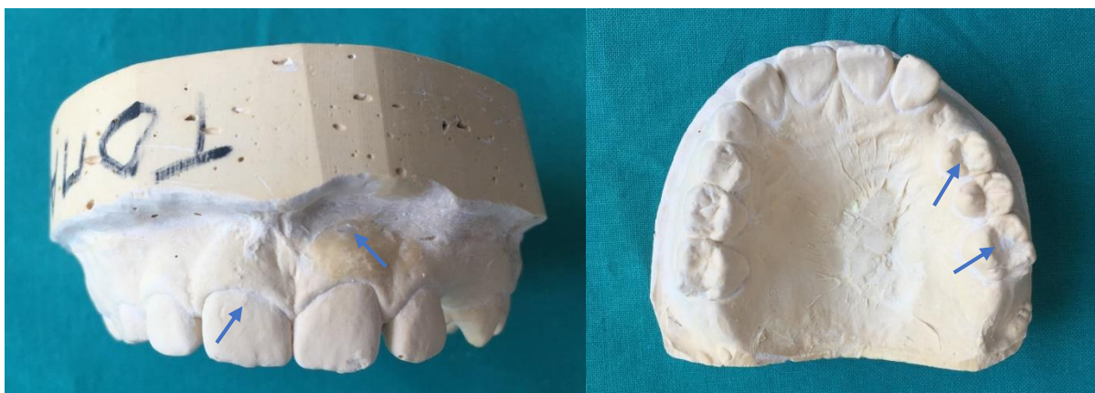
Slika 3. Obrabđeni model gornje čeljusti. Udubljenja su popunjena staklenoionomernim cementom, a izbočenja su uklonjena skalpelom.

U primjeru navedenom na slikama vidi se da pacijent ima mješovitu denticiju i da je lijeva gornja trojka počela nicati. Kada bi otisnuli foliju preko takvog modela, udlaga bi ubrzo počela pacijenta žuljati zbog trojke u erupciji za koju nema mjesta. U takvim situacijama na modelu se može oblikovati prostor za trajni zub koji je u fazi nicanja. Iz kompozitnog materijala ili staklenoionomernog cementa oblikuje se prostor koji može biti nalik sedla (Slika 4.). Bitno je da je u visini zubnog luka, a ne duži ili kraći, te da aproksimalno ostavlja dovoljno mjesta trajnom nasljedniku. Ovom metodom pacijent može ipak malo duže nositi istu udlagu.