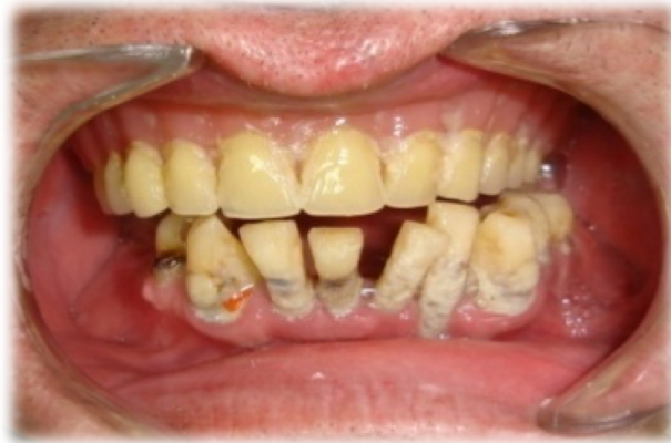
Slika 2. Klinički pregled.

Uz navedeno, prije početka protetske terapije često je potrebno provesti i niz drugih preprotetskih pripremnih postupaka. Svaka neuobičajena osjetljivost, oteklina ili vidljiva promjena na mekim ili tvrdim tkivima stomatognatoga sustava zahtjeva specifičnu terapiju kojom će se uspostaviti potrebni uvjeti za izradu protetskoga rada. Kompleksne čimbenike, koji će imati direktnog uticaja na uspjeh provedene terapije, nemoguće je složiti određenim redom važnosti jer se njihov relativan odnos mijenja kod svakoga novog kliničkog slučaja.