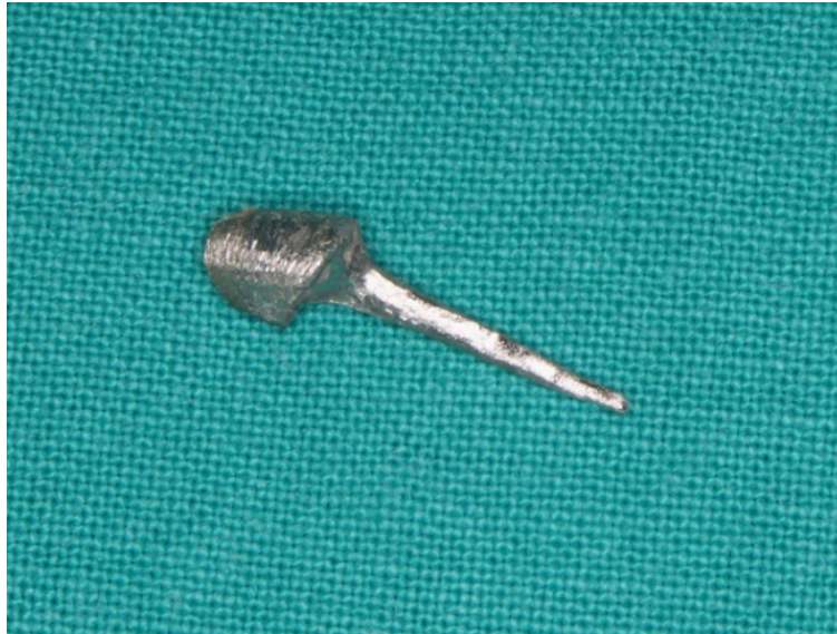
Slika 7. Individualna lijevana nadogradnja. Preuzeto s dopuštenjem autora: Dragutin Komar