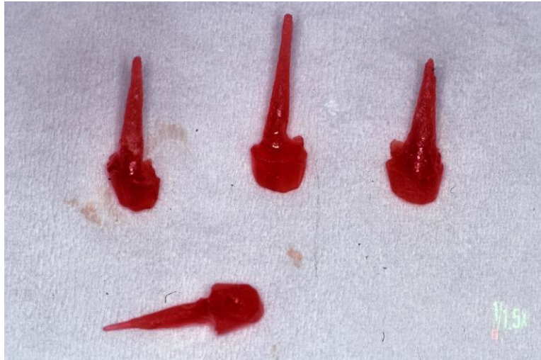
Slika 4. Individualna nadogradnja. Preuzeto s dopuštenjem autora: Dragutin Komar

Indirektna tehnika izrade individualne lijevane nadogradnje izrađuje se na način da se uzima otisak unutarkorijenskog isprepariranog prostora zajedno s preparacijom ostatnog dijela krune, te se ovisno o vrsti nadogradnja modelira u vosku ili samopolimerizirajućem akrilatu u zubotehničkom laboratoriju (Slika 5.).