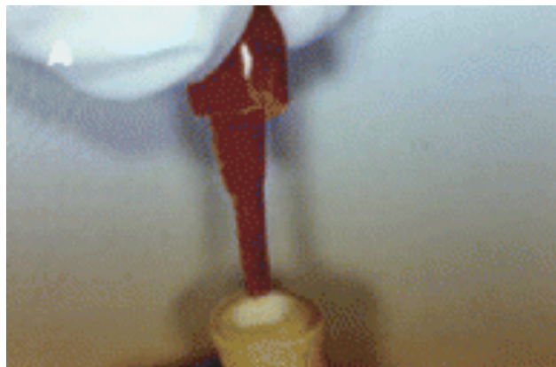
Slika 5. Način izrade.

Indirektna tehnika izrade individualne lijevane nadogradnje izrađuje se na način da se uzima otisak unutarkorijenskog isprepariranog prostora zajedno s preparacijom ostatnog dijela krune, te se ovisno o vrsti nadogradnja modelira u vosku ili samopolimerizirajućem akrilatu u zubotehničkom laboratoriju (Slika 5.).