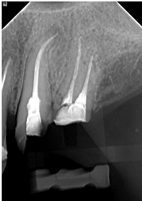
Slika 1. Rtg slika zuba nakon provedenog endodontskog liječenja.

Svako veće oštećenje kliničke krune zuba, koje smanjuje njenu veličinu više od 25%, zahtijeva nadoknadu izgubljenoga dijela kako bi se osigurala dovoljna retencijska površina za budući fiksno-protetski rad (1). Gubitkom caklinskog i dentinskog tkiva u većoj ili manjoj mjeri kao i gubitak jednog ili više zuba u lateralnim segmentima čeljusti, do kojih dolazi uslijed patoloških procesa, karijesa, traume itd. posredno će smanjiti mastikatornu efikasnost, a neposredno će imati uticaja na funkcijske promjene cijeloga stomatognatog sustava. Veće oštećenje ili gubitak zuba u prednjem segmentu vezano je uz navedeno i s promjenama u estetici i fonaciji, što je kod tog segmenta svakako primarni problem.