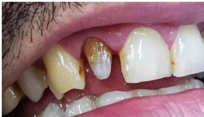
Slika 16. Kolčić s karbonskim vlaknima ugrađen u zub 12

Kolčići s karbonskim vlaknima (C-Post) imaju modul elastičnosti sličan dentinskom. Modulelastičnosti dentina iznosi 18,6 – 19,2 GPa, kompozitnog cementa 6,8 – 10,8 GPa, kompozitnog kolčića 16 – 40 GPa, a kompozitnog materijala 5,7 – 25 GPa. Oko 50 % volumnog udjela FRC Postec Plus kolčića su vlakna. Otporni su na koroziju i imaju svojstva slična dentinu. Snaga savitljivosti im je 1050 MPa. Cirkonijev oksidne nadogradnje zbog odličnih estetskih svojstava cirkonijev oksidnih kolčića, mnogi ih smatraju idealnima za estetske rekonstrukcije ispunom ili potpuno keramičkom krunicom. Nedostatak cirkonijev oksidnih nadogradnja je što ne amortiziraju sile naprezanja u korijenu, nego ih prenose na zub i sklone su lomovima ( 23).