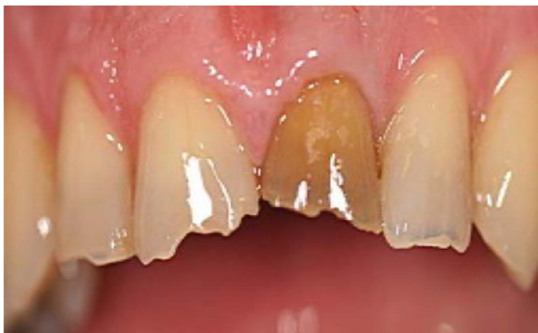
Slika 1. Avitalni gornji središnji sjekutić s promjenom boje i oblika

Avitalni zub posjeduje smanjenu čvrstoću i translucenciju preostale strukture tvrdih zubnih tkiva. Zubi sa ekstrahiranom pulpom podnose manja opterećenja od vitalnih zuba zbog gubitka organskog dijela mekih i tvrdih tkiva zuba uzrokovanih različitim patološkim i ijtrogenim procesima. Na taj način povećava se vjerojatnost za frakturu preostalih tvrdih zubnih tkiva. Liječeni zubi tijekom vremena mijenjaju oblik i boju kliničke krune od sive do smeđe, pa to i estetski vrlo loše izgleda (Slika 1.). Zbog endodontske terapije i formiranja ulaznog kaviteta u komoru pulpe smanjuje se dodatno jačina preostale kliničke krune zuba. Često je potrebno pojačanje kliničke krune i korijena postavljanjem različitih oblika nadogradnji, koje se sidre na ostatcima kliničke krune i u korijenu zuba. (1-3). Pri tome se potencijalno područje moguće frakture zuba udaljava od gingivnog ruba zuba prema vrhu korijena, što pak smanjuje mogućnost frakture krunskog dijela zuba. U zadnjih desetak godina sve češće se javljaju estetske konfekcijske nadogradnje kao suvremeni sustavi nadogradnje avitalnih zuba. One mogu biti kompozitni kolčići ojačani karbonskim ili staklenim vlaknima, te cirkonijevi i keramički kolčići (4,5).