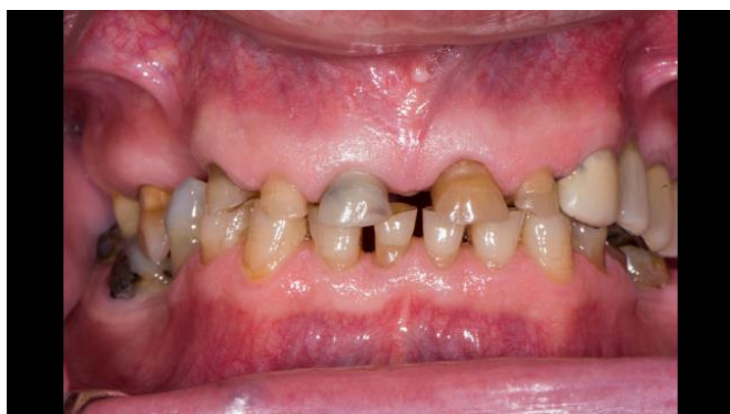
Slika 2. Pacijent s generaliziranom abrazijom i diskoloriranim zubima

prema vrsti materijala na metalne i nemetalne. Najčešće upotrebljavan sustav je metalna lijevana individualna nadogradnja, koja se koristi već niz godina. Nedostatak joj je u prvome redu estetika jer često prosijava uz rub krunice te isključuje upotrebu potpuno keramičkih sustava. Za izradu lijevane nadogradnje je potrebna i suradnja s tehničarom, za što je potrebno dodatno vrijeme. Lijevanu nadogradnju je jako teško izvaditi, ukoliko je dovoljno duboko retinirana u korijenskom kanalu. Izrada metalnih nadogradnji posebno je indicirana u slučajevima sniženja kliničke krune zuba uslijed abrazijskih i atricijski procesa tvrdih zubnih tkiva. U praksi su ti zubi vitalni, ali imaju premalu retencijsku površinu za izradu krunice (Slika 2.). Kod ovakvih slučajeva indicirana je devitalizacija pa zatim izrada nadogradnje i krunice. Abrazija je poseban protetski problem i u pravilu ne dolazi na jednom ili dva zuba nego obuhvaća jednu ili obje čeljusti, pa njezino rješavanje sa nadogradnjama i krunicama spada najčešće u područje oralne rehabilitacije, zbog složenosti terapije i podizanja visine zagriža.