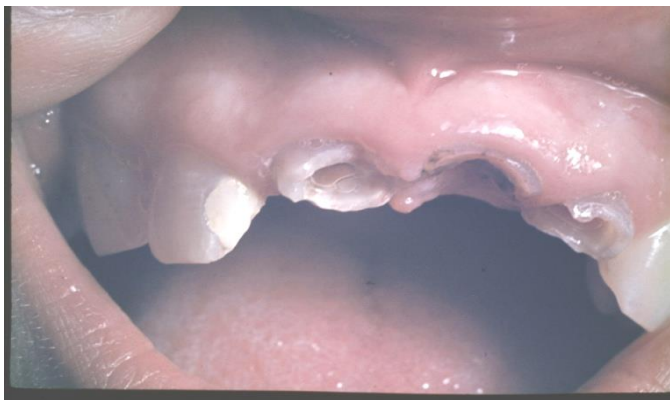
Slika 3. Neliječeni i zapašteni prednji zubi sa otvorenom komorom i cirkularnim karijesom bez kliničke krune