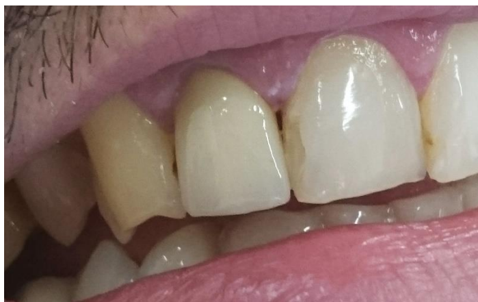
Slika 17. Isti pacijent sa cementiranom metalkeramičkom krunicom na zubu 12

Kolčići s karbonskim vlaknima (C-Post) imaju modul elastičnosti sličan dentinskom. Modulelastičnosti dentina iznosi 18,6 – 19,2 GPa, kompozitnog cementa 6,8 – 10,8 GPa, kompozitnog kolčića 16 – 40 GPa, a kompozitnog materijala 5,7 – 25 GPa. Oko 50 % volumnog udjela FRC Postec Plus kolčića su vlakna. Otporni su na koroziju i imaju svojstva slična dentinu. Snaga savitljivosti im je 1050 MPa. Cirkonijev oksidne nadogradnje zbog odličnih estetskih svojstava cirkonijev oksidnih kolčića, mnogi ih smatraju idealnima za estetske rekonstrukcije ispunom ili potpuno keramičkom krunicom. Nedostatak cirkonijev oksidnih nadogradnja je što ne amortiziraju sile naprezanja u korijenu, nego ih prenose na zub i sklone su lomovima ( 23).