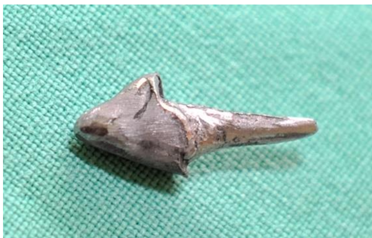
Slika 7. Neobrađena nadogradnja iz kobalt krome slitine