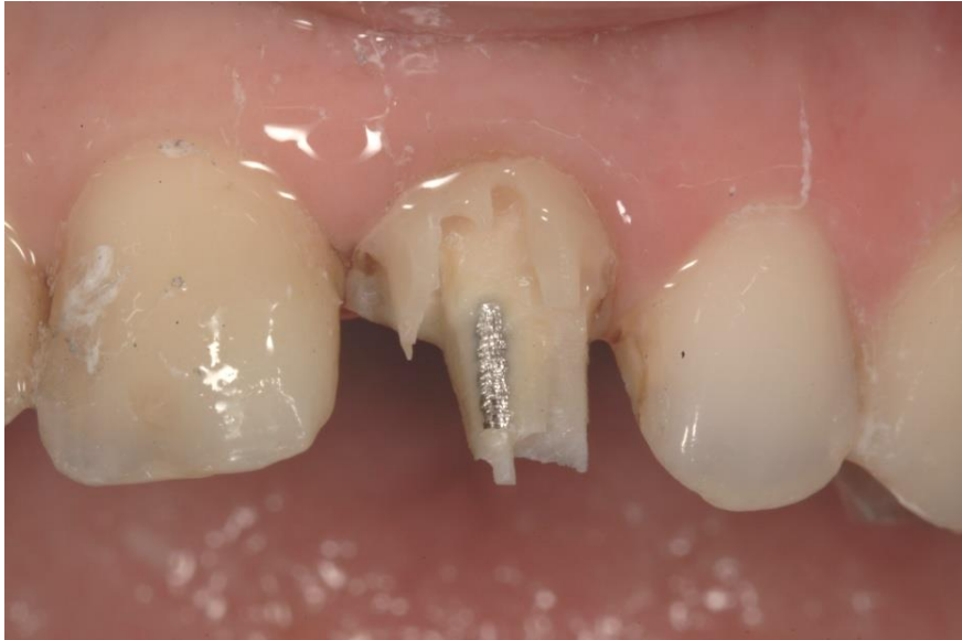
Slika 13. Skidanje starog ispuna i odstranjivanje nadogradnje