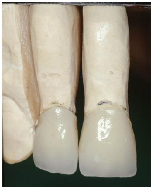
Slika 10. Potpuno keramičke krunice na estetskim nadogradnjama