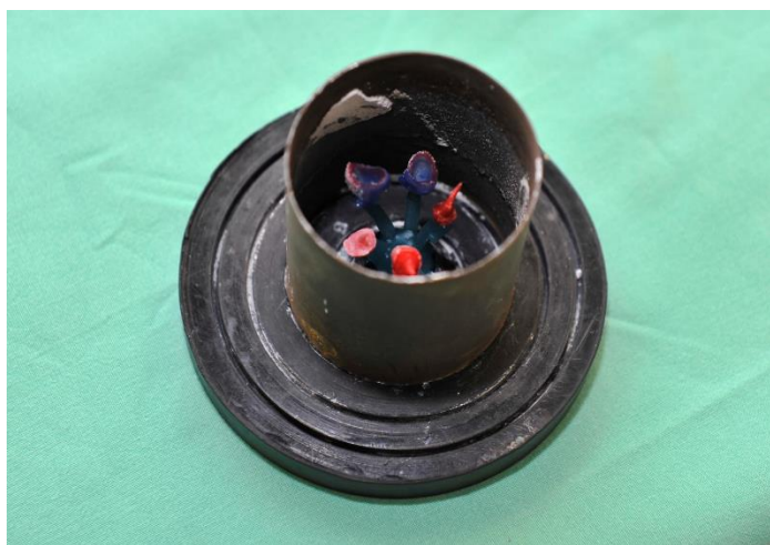
Slika 6. Akrilatni modelat nadogradnji pripremljen u kivetu za uložnu masu

Nakon što su nadogradnje izmodeliraju šalju se u laboratorij, gdje se ulažu u uložnu masu (Slika 6.) i odlijevaju u planiranoj slitini. Nakon odlijevanja se nadogradnje odvoje od livnih kolčića, dobro ispjeskare i pošalju u ordinaciju na cementiranje. (Slika 7.)