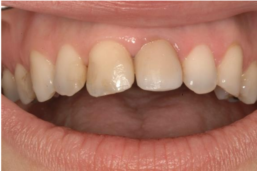
Slika 11. Pacijent sa zubom 21 čiji se ispun lomi palatinalno