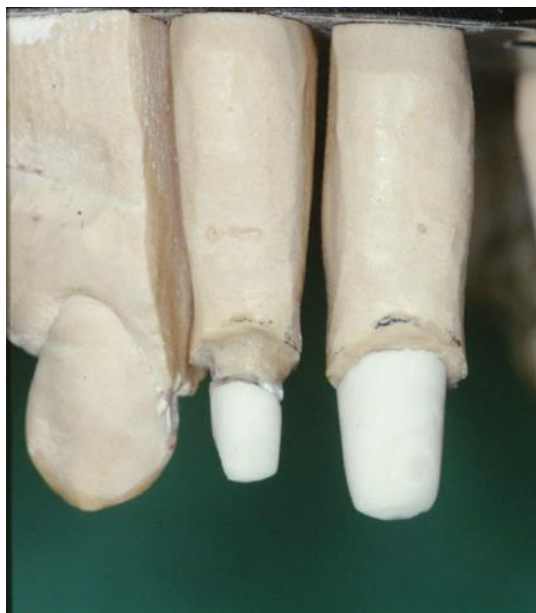
Slika 9. Cirkonijev kolčić sa uprešanim bataljkom iz keramike

Dužina kolčića iz cirkonijevog oksida prikazanih na slici 8. je 20 mm, a promjer svrdala 1,4 i 1,7 mm. Nakon preparacije zuba i umetanja kolčića u njega uzima se otisak koji tehničar odlije i na kolčiću izmodelira u bijelom vosku bataljak zuba, na čiji se oblik nakon ulaganja i topljenja voska upreša keramički materijal (Slika 9.).