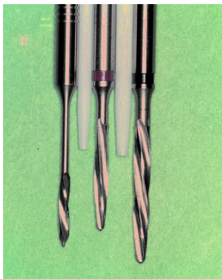
Slika 8. Kolčići iz cirkonijevog oksida sa pripadajućim svrdlima za kanal

Dužina kolčića iz cirkonijevog oksida prikazanih na slici 8. je 20 mm, a promjer svrdala 1,4 i 1,7 mm. Nakon preparacije zuba i umetanja kolčića u njega uzima se otisak koji tehničar odlije i na kolčiću izmodelira u bijelom vosku bataljak zuba, na čiji se oblik nakon ulaganja i topljenja voska upreša keramički materijal (Slika 9.).