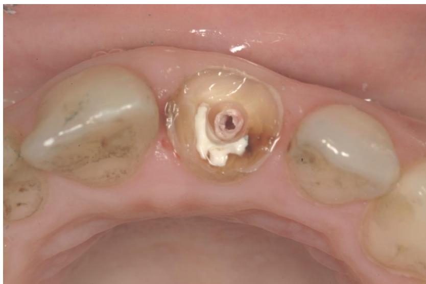
Slika 15. Izgleda zuba bez kliničke krune sa odstranjenom konfekcijskom nadogradnjom

Konfekcijske nadogradnje s obzirom na gradivni materijal se dijele na: