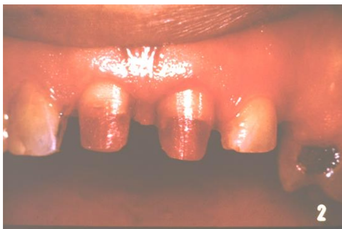
Slika 5. Akrilatne nadogradnje na gornjim prednjim sjekutićima