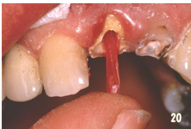
Slika 4. Početak modelacije sa akrilatnim štapićem

vosak kod pogreške lako izvadi. Modelacija akrilatom počinje izolacijom korijenskog kanala, i izradom akrilatnog kolčića kojim mjerio dubinu preparacije. U narednom aktu na kolčić nanese se srednje rijetko zamiješan akrilat i otisnemo korijenski kanal ( Slika 4.). Vješt terapeut može odmah dalje nadodavati materijal na krunski dio zuba i formirati bataljak. Završni oblik postiže se brušenjem bataljka u željeni oblik kad se akrilat stvrdnuo u potpunosti ( Slika 5.). Kod pogreške u modelaciji sa akrilatom, prilikom vađenja stvrdnutog akrilata može se svrdlom probiti stijenka korijena zuba, što je izuzetno opasna radnja, gdje dolazi u pitanje i opstanak zuba.