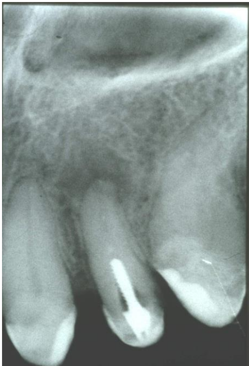
Slika 12. Na retroalveolarnoj rtg. snimci vidljiva konfekcijska nadogradnja postavljena je u endodontski neispravno liječeni zub s vidljivim periapeksnim procesom