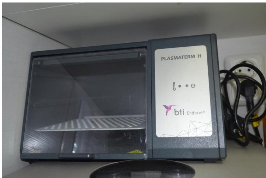
Slika 4. Stroj za dobivanje PRGF-a “ Plasmatherm H ”