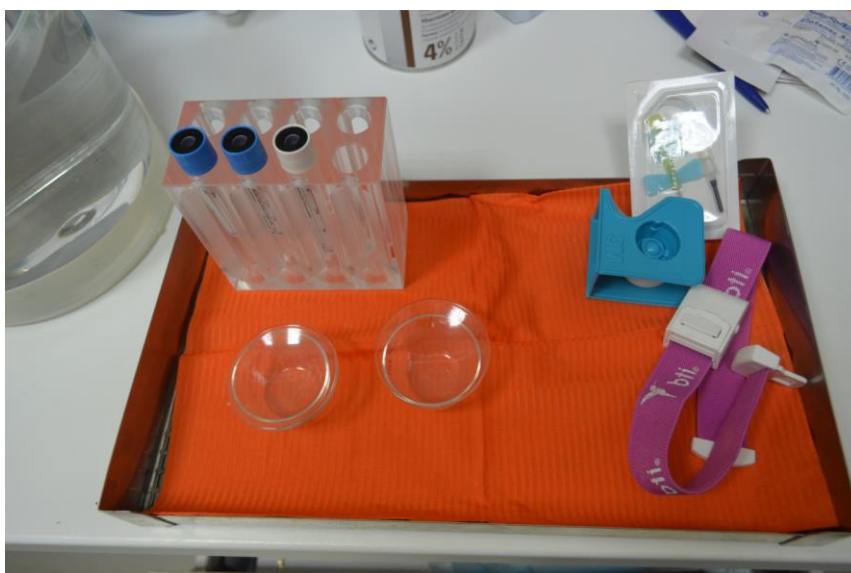
Slika 2. Set za uzimanje krvi prilikom proizvodnje PRF-a

U kliničkom postupku koristimo se tehnikom kakva je navedena u prikazu slučaja koji je obradio Mishra 2013. godine (30). Pristupni kavitet je oblikovan i učinjena je minimalna instrumentacija radi uklanjanja nekrotičnih ostataka uz obilno ispiranje otopinom 2,5% natrijeva hipoklorita. Trostruka antibiotska pasta uložena je u kanal tijekom četiri tjedna. Tijekom drugog posjeta iz srednje kubitalne vene pacijenta uzeto je 5 ml cijele krvi, a krv je podvrgnuta centrifugiranju tijekom 24 sata na 2400 rpm tijekom 12 minuta pri pripremi fibrina bogata trombocitima (PRF) pomoću Choukrounove metode.