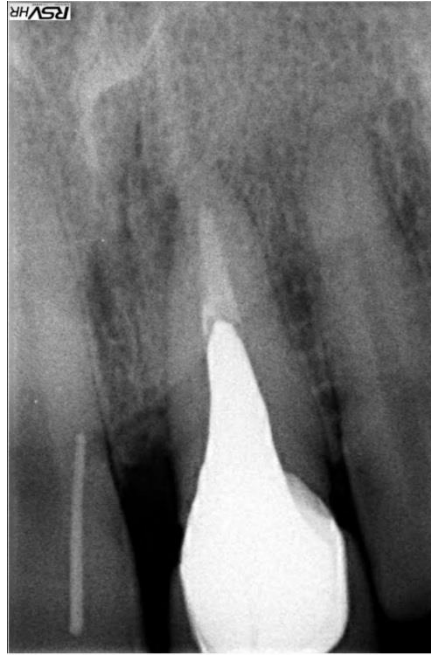
Slika 2. Ciljana snimka zuba sa štapićem gutaperke.