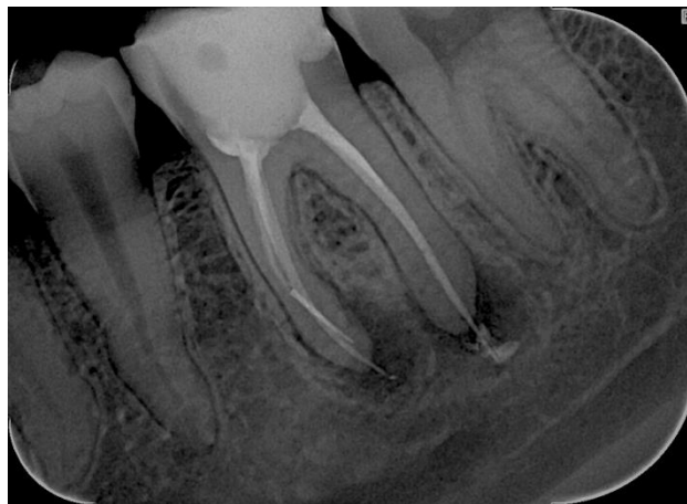
Slika 3. Neadekvatan endodontski tretman.

Radiološke snimke su od velikog značaja u dijagnostici odontogene infekcije. Koja vrsta snimke će se napraviti, ovisi o kliničkoj slici. Ortopantomogram čeljusti jest pregledna i najčešće snimana snimka. On nam može otkriti prisustvo neadekvatno endodontski tretiranih zubi, periapikalnog procesa, (u slučaju perikoronitisa) impaktirani treći molar itd. (slika 3 i slika 4). Kompjutorizirana tomografija i magnetska rezonancija rezervirane su za teže slučajeve infekcija dubokih prostora glave i vrata (5).