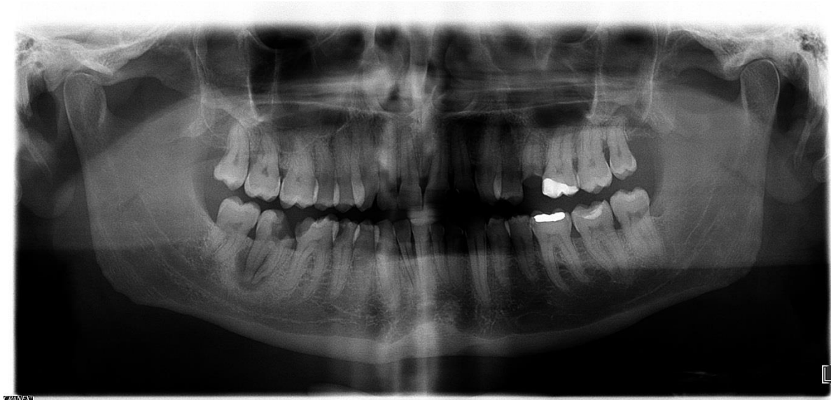
Slika 4. Periapikalni proces na donjem desnom drugom kutnjaku.

Preuzeto s dopuštenjem: dr. dent.med. Ivan Katalinić.