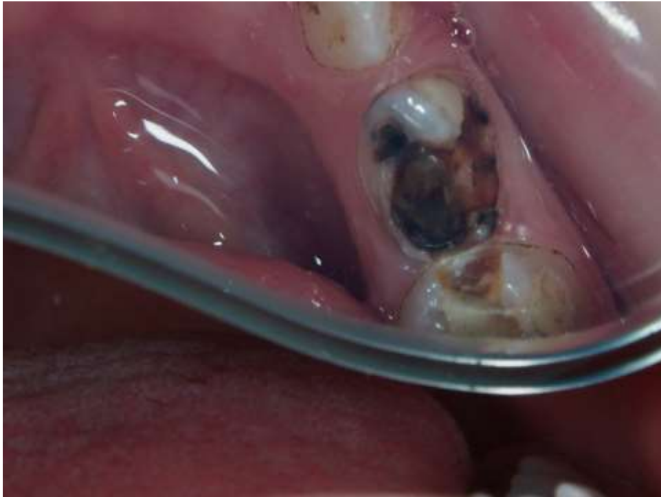
Slika 4. Kavitet mliječnog zuba prije izrade ART ispuna.