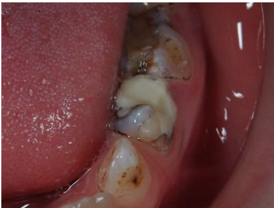
Slika 8. Konačni izgled ART ispuna.