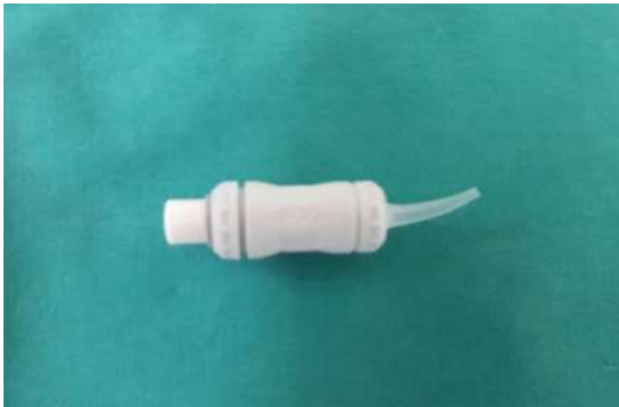
Slika 2. Kapsulirani oblik SIC-a omogućava stalan i točan omjer praha i tekućine te jednostavno i brzo unošenje u kavitet.