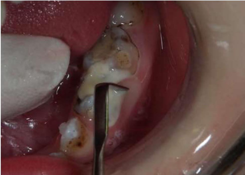
Slika 6. Modeliranje ART ispuna i uklanjanje viška materijala.