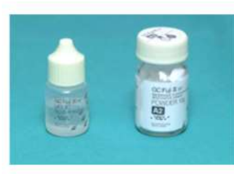
Slika 3. Konvencionalni SIC u obliku tekućine i praha.

Indikacije za uporabu konvencionalnih SIC-a su: podlaganje kaviteta, ispuni I., III. i V. razreda, pečačenje fisura i preventivni ispuni. Kao predstavnike ove skupine mogu se navesti Ketac Fil (3M ESPE), Fuji II (GC) i drugi (26,27).