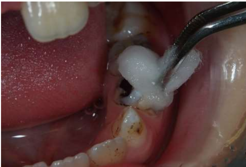
Slika 5. Nanošenje viskoviskoznog SIC-a u kavitet mliječnog zuba.