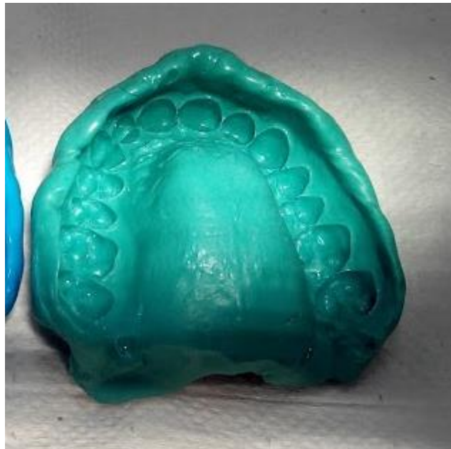
Slika 5. Otisak polieterom.

Polieter posjeduje i neke nedostatke. Vrlo je čvrst nakon stvrdnjavanja pa se teško vadi iz podminirajućih područja, stoga nije indiciran za otiskivanje paradontopatičnih zubi ili u slučajevima gdje preostaje veći broj nebrušenih zubi. Još je jedno negativno svojstvo polietera neugodan okus što često pri pacijentima potiče nagon za povraćanjem. Za izlijevanje otisaka potrebno je koristiti tvrdu sadru tipa IV zato što zbog velike čvrstoće otisnog materijala može doći do oštećenja sadrenog modela prilikom odvajanja otiska (1, 14, 17).