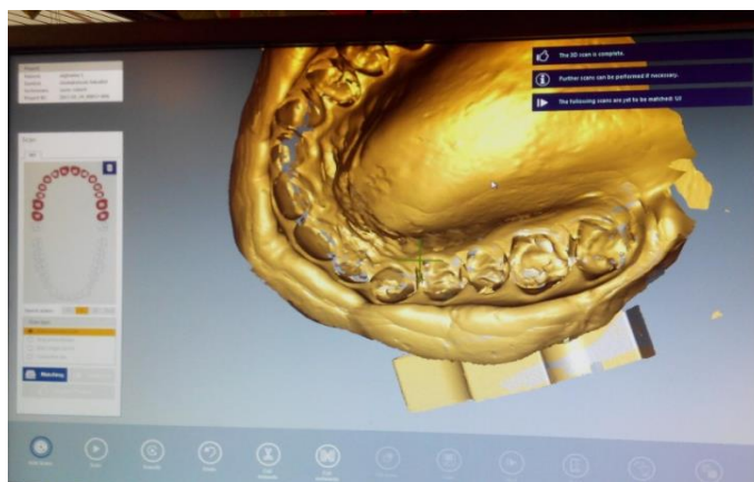
Slika 7. Snimka ekrana računala tijekom postupka skeniranja otiska.