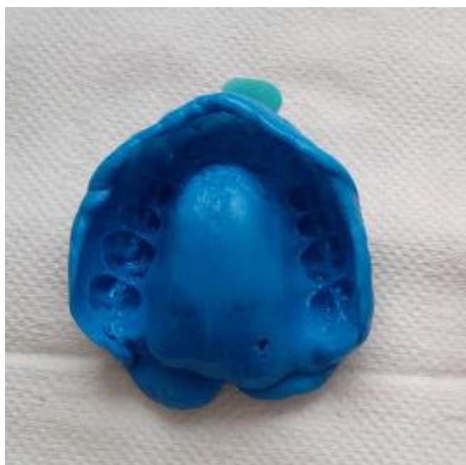
Slika 4. Otisak silikonom kondenzacijskog tipa.

Kondenzacijski silikoni najčešće se upotrebljavaju pri uzimanju funkcijskog otiska za izradu protetskih nadomjestaka (1).