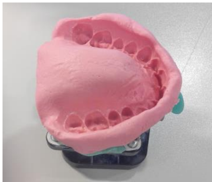
Slika 2. Alginatni otisak.

Iako su suvremeni alginati dovoljno niskoviskozni i omogućuju otiskivanje finih detalja u usnoj šupljini, ne rabe se za otiskivanje pri izradi visokopreciznih protetskih radova kao što su krunice, mostovi, inlayi, implantoprotetika... Ipak, u širokoj su uporabi za otiskivanje antagonističkih struktura (kontra), za izradu studijskih modela, ortodontskih naprava i mobilnih nadomjestaka (14, 17).