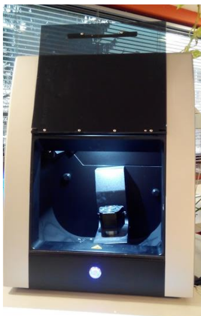
Slika 6. Laboratorijski skener Ceramill Map 400+ .

Tvrtka Amann Girrbach GmbH (Koblach, Austrija) trenutno na tržištu ima dva skenera: Ceramill Map 200+ i Ceramill Map 400+ (15). Na Slici 6. prikazan je skener Ceramill Map 400+. Visoko-senzitivnim 3D senzorima i novo razvijenom “DNA brzinom skeniranja”, koja reducira brzinu skeniranja za gotovo 50%, ozbiljno konkuriraju tvrtki 3Shape. Preciznost skeniranja im je konzistentna, a cijeli je zubni luk moguće skenirati za 24 sekunde s preciznošću od 6 \mu m (42).