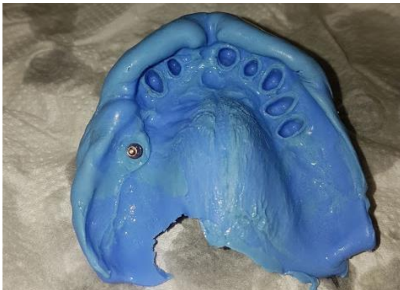
Slika 3. Otisak polivinilsiloksanom.

Adicijski su silikoni hidrofobni, no dodatkom surfaktanata dobivaju hidrofilna svojstva s poboljšanom mogućnošću ovlaživanja površine. Otisci su osjetljivi na vlagu nakon otiskivanja pa moraju biti pohranjeni na suhom kako bi zadržali dobru dimenzijsku stabilnost. Nije ih poželjno izlijevati do 30 minuta nakon otiskivanja, a taj period može iznositi i do 2 sata. To je vrijeme potrebno za završetak polimerizacije, tj. njegovo definitivno svezivanje. Nakon tog vremena, ako su pohranjeni u suhoj sredini, otisci mogu biti odloženi bez utjecaja na preciznost i do nekoliko dana. Čvrstoća im je veća od kondenzacijskih silikona, ali manja nego kod polietera. Pogodniji su od polietera za primjenu kod parodontoloških pacijenata jer imaju viši modul elastičnosti koji im omogućuje lakše izvlačenje iz usta (1, 17).