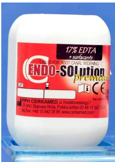
Slika 3. Etilendiamintetraoctena kiselina (EDTA). Preuzeto s dopuštenjem autora: prof.dr.sc.