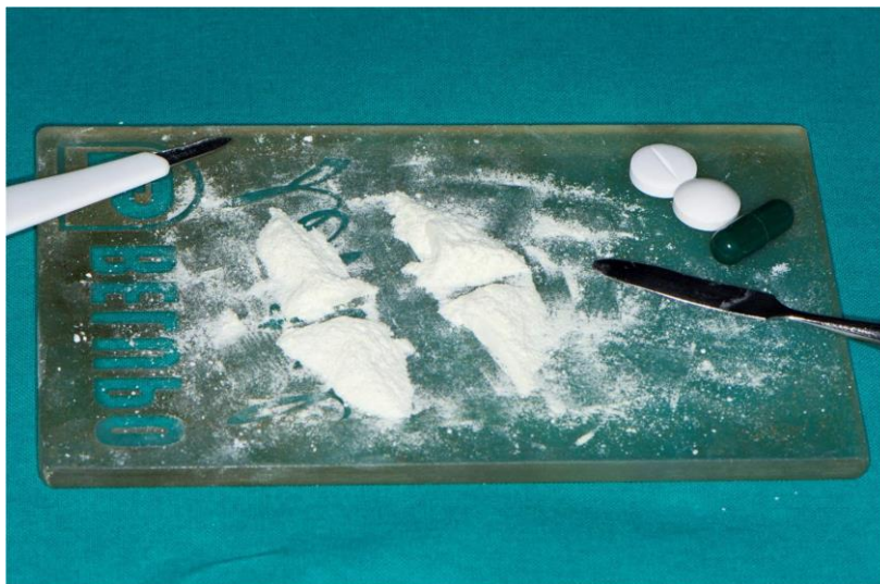
Slika 6. Usitnjavanje antibiotika za pripremu TAP.