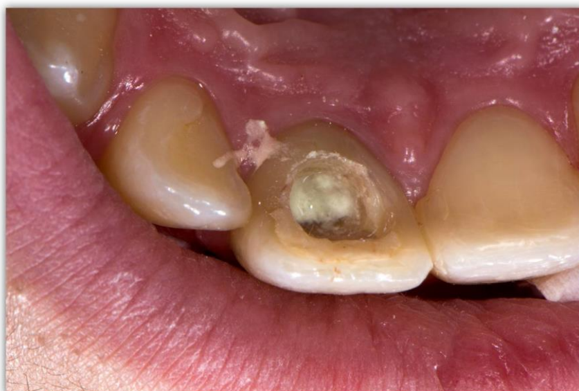
Slika 10. Aplikacija mineral trioksid agregata (MTA) u korijenski kanal. Preuzeto s dopuštenjem autora: prof.dr.sc. Hrvoje Jurić.

Neki kliničari predlažu preskakanje posjeta kada se stabilizira ugrušak i prekriva pastom kalcijevog hidroksida, stoga odmah pri drugom posjetu nakon ispiranja i uklanjanja antibiotske paste prekrivaju pulpno tkivo MTA cementom (Slika 10). Izradom "koronarnog čepa" od bioaktivnog materijala kao što je MTA potiče se diferencijacija matičnih stanica. Uz to MTA predstavlja i sigurnu zonu zaštite od koronarnog propuštanja. Nakon završenog terapijskog postupka kontrolni pregledi provode se svaka tri mjeseca tijekom godine dana u svrhu praćenja razvoja korijena. Kontrola rendgenskim snimkama provodi se nakon šest, odnosno nakon dvanaest mjeseci.