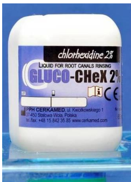
Slika 2. Klorheksidin (CHX).

Osim NaOCl koristi se još i bisgvanid, klorheksidin (CHX) koji je pokazao dobro i prolongirano djelovanje na gram + bakterije i Candida albicans (Slika 2). 17% EDTA koristi se za uklanjanje zaostatnog sloja (Slika 3). Njezinom se uporabom otvaraju ulazi u dentinske tubuluse što omogućuje bolju penetraciju irigansa i intrakanalnih lijekova. Ispiranje fiziološkom otopinom između svakog ispiranja različitim irigansima sprečava stvaranje precipitata te uklanja zaostatni sloj i ostatke irigansa (2).