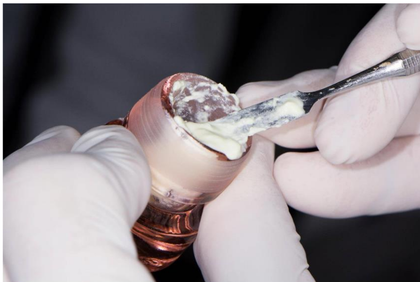
Slika 8. Miješanje TAP.

Pri drugom posjetu nakon ponovnog ispiranja korijenskih kanala i uklanjanja antibiotske paste endodontskim instrumentom izaziva se krvarenje iz periapikalnog tkiva u svrhu stvaranja koaguluma. Koagulum stvoren unutar korijenskog kanala čini osnovu za daljnji razvoj korijena, odnosno fibrinska mrežica koja se pritom stvara služi kao nosač za razvoj matičnih stanica. Nakon stabilizacije koaguluma slijedi njegovo prekrivanje pastom \text{Ca}(\text{OH})_2 u trajanju od 7-14 dana i u sljedećem se posjetu prekriva pomoću bioaktivnog MTA (Slika 9) cementa i izrađuje se definitivni ispun.