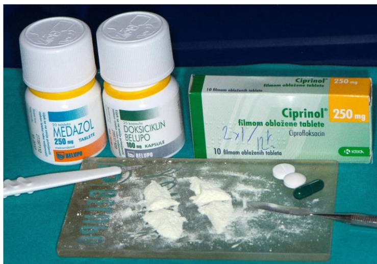
Slika 5. Sastojci triantibiotske paste.

Nakon dezinfekcije korijenskog kanala slijedi unošenje triantibiotske paste koja u sebi sadrži tri antibiotika: ciprofloksacin, metronidazol i minociklin (Slika 5). Neželjene nuspojave poput obojenja zuba zbog prisutnog tetraciklinskog antibiotika-minociklina mogu se izbjeći zamjenom lijeka nekim drugim antibiotikom sličnog djelovanja (cefalosporin ili klindamicin) ili korištenjem paste sa samo dva antibiotika (DAP). Pasta se može dobiti kao gotov proizvod ili se može izraditi u ordinaciji neposredno prije primjene. Ako se pripravlja u ordinaciji, uzme se po jedna tableta (kapsula) od svakog antibiotika te se usitni jednaka količina praha (Slika 6). Toj se praškastoj kombinaciji dodaje sterilna fiziološka otopina te se ista zamiješa u gustu pastu (Slika 7). Pripremljena pasta se pomoću lentulo spirale na malom broju okretaja unosi u korijenski kanal (Slika 8) (48). Svrha je intrakanalne aplikacije antibiotika tijekom 7-14 dana uklanjanje preostalih mikroorganizama unutar korijenskog kanala te sprečavanje sekundarne infekcije koaguluma.