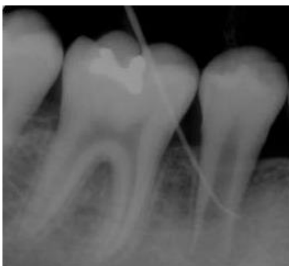
Slika 4. Rendgenski prikaz mladog trajnog zuba s nezavršenim rastom korijena.

Revaskularizacija je nakon navedenih eksperimentalnih metoda regenerativni postupak koji se već koristi u kliničkoj praksi i postiže dobre rezultate. Kao što je već ranije spomenuto, prvi pokušaj revaskularizacije datira još iz davne 1961. godine kada je Nygaard-Ostby pokušao primijeniti tu tehniku na nekrotičnom i inficiranom zubu s periapikalnim procesom. Rezultati su bili ograničeni zbog nepostojanja odgovarajućih materijala potrebnih za postupak. Već se tada istraživala uloga krvnog ugruška u liječenu apikalnog tkiva. Tek je 2011. godine kliničkom studijom utvrđeno da provociranjem krvarenja u apikalnom tkivu možemo dobiti bogat izvor matičnih stanica koje naseljavaju korijenski kanal (40).