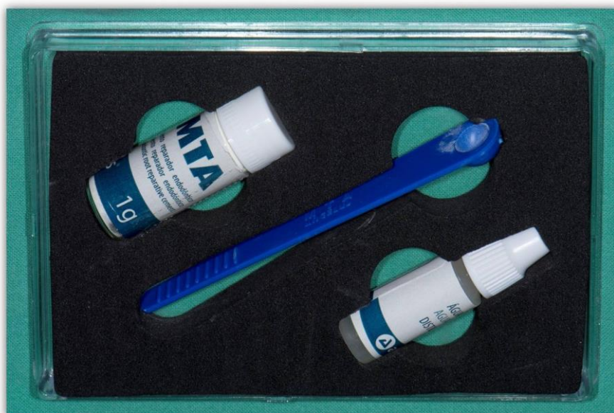
Slika 9. Mineral trioksid agregat (MTA).

Pri drugom posjetu nakon ponovnog ispiranja korijenskih kanala i uklanjanja antibiotske paste endodontskim instrumentom izaziva se krvarenje iz periapikalnog tkiva u svrhu stvaranja koaguluma. Koagulum stvoren unutar korijenskog kanala čini osnovu za daljnji razvoj korijena, odnosno fibrinska mrežica koja se pritom stvara služi kao nosač za razvoj matičnih stanica. Nakon stabilizacije koaguluma slijedi njegovo prekrivanje pastom \text{Ca}(\text{OH})_2 u trajanju od 7-14 dana i u sljedećem se posjetu prekriva pomoću bioaktivnog MTA (Slika 9) cementa i izrađuje se definitivni ispun.