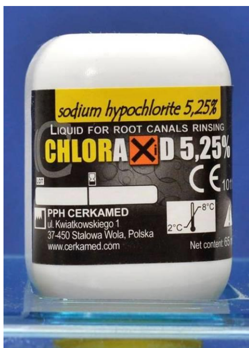
Slika 1. Natrijev hipoklorit (NaOCl).

S obzirom na to da ne postoji idealna tehnika instrumentacije niti materijal koji bi zamijenio pulpno tkivo, cilj je endodontskog liječenja ukloniti sve iritanse, nekrotično tkivo, patogene mikroorganizme i ostatke zubne pulpe kako bi liječenje bilo uspješno. Eliminacija upaljenog ili nekrotičnog pulpnog tkiva i mikroorganizama najvažniji je čimbenik za uspjeh endodontskog liječenja. Zbog brojnih morfoloških varijacija kao što su lateralni i akcesorni kanali, isthmusi te zavijenost kanala uz mehaničku instrumentaciju potrebno je i kemijski dezinficirati korijenski kanal. Irigansi koji se rabe tijekom liječenja trebali bi imati maksimalan baktericidni i bakteriostatski učinak s minimalnim citotoksičnim učinkom na matične stanice i fibroblaste te omogućiti njihovo preživljavanje i očuvati sposobnost proliferacije. Cilj je irigacije ukloniti mikroorganizme u područjima koja su nedostupna instrumentaciji. Danas se kao zlatni standard u endodonciji koristi natrijev hipoklorit (NaOCl) (Slika 1). Preporučene koncentracije su između 0,5% i 5,25%. Međutim, najbolji uspjeh se postiže s koncentracijom NaOCl od 2,5%.