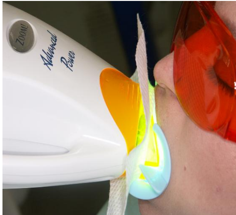
Slika 8. Aktivacija preparata za izbjeljivanje svjetlošću.