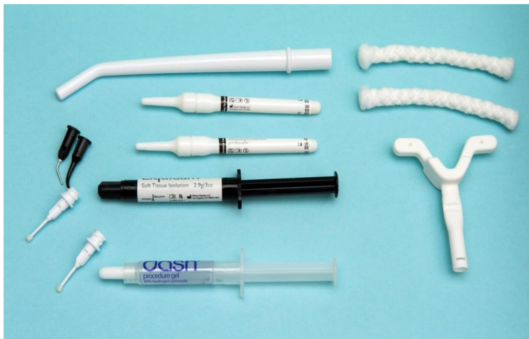
Slika 1. Preparat 30 %-tnog vodikovog peroksida Dash .

Vodikov peroksid snažan je oksidans, dostupan u različitim koncentracijama, ali najčešće u stabiliziranim 30 – 35 %-tnim otopinama (Slika 1). Te visoko koncentrirane otopine moraju se pažljivo primjenjivati jer su nestabilne, otpuštaju kisik brzo i mogu eksplodirati ako nisu pothlađene i pohranjene u tamnom spremniku. U primjeni, vodikov peroksid razgrađuje se na vodu i kisik. Tijekom aplikacije gel stvara interakciju s vlažnom strukturom zuba, a oslobođene molekule kisika odgovorne su za bijeljenje zuba. Za razliku od karbamid peroksida, vodikov peroksid temelji se na bazi vode. Zato se prilikom upotrebe vodikova peroksida smanjuje mogućnost dehidracije (1).