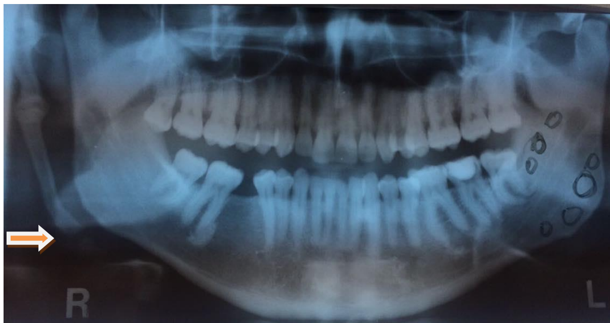
Slika 1. Prikaz produljenog stiloidnog nastavaka na ortopantomogramu (strelica).