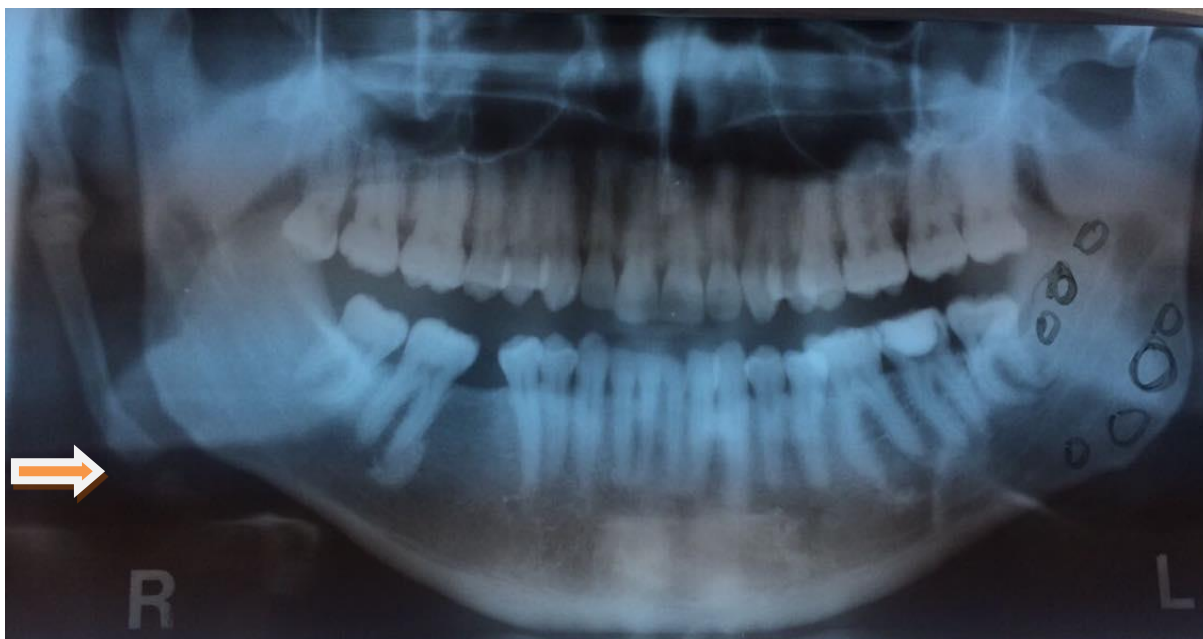
Slika 1. Prikaz produljenog stiloidnog nastavaka na ortopantomogramu (strelica).