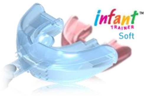
Slika 6. Infant Trainer (18).