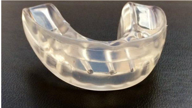
Slika 8. 3 tube na LM aktivatoru (21).

Kontraindicirani su kod jako uskog gornjeg luka, klase III, središnje dijasteme veće od 3 mm, palatinalno impaktiranog zuba te rotiranih stražnjih zuba (22). Nosi se navečer tijekom spavanja.