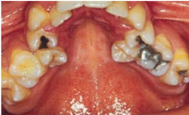
Slika 2. V-oblik maksilarnog luka. Preuzeto s dopuštenjem autora (7).

Gingiva je crvena i upaljena zbog stalne izloženosti zraku. Često je prisutan i „gummy smile“, a u stražnjoj regiji križni zagriz.