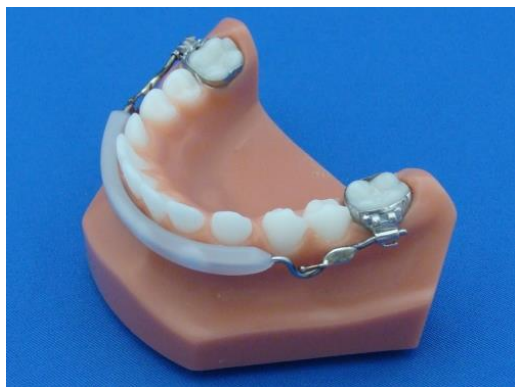
Slika 7. Usni odbojnik (19).

Usni odbojnik je pasivna ortodonska naprava koja se aktivira djelovanjem mišića orbikularisa orisa (slika 7). Smješten je u prednjem dijelu vestibuluma, zaobilazi frenulum, a od alveolarnog grebena je odmaknut 2-3 mm. Koristi se u mješovitoj i trajnoj denticiji za uklanjanje nepogodnih navika grizenja i uvlačenja usnice, kao držač mjesta kod preranog gubitka zuba i sidrište pri vođenoj erupciji zubi, za uspravljanje mezijalno nagnutih i atipično rotiranih prvih trajnih kutnjaka, ispravljanje oralno nagnutih sjekutića te razvoj apikalne baze anteriorno i lateralno. Sastoji se od žičanog luka, debljine 1,15 mm, koji se umeće u bukalne cjevčice pričvršćene na prstene na prvim trajnim kutnjacima. Frontalni dio luka je obložen akrilatom ili gumom da spriječi ozljede sluznice i usne (20). Razlikujemo usni odbojnik za gornju i donju čeljust. Može se kupiti gotov ili individualno izraditi. Trajanje terapije je oko godinu dana (12).