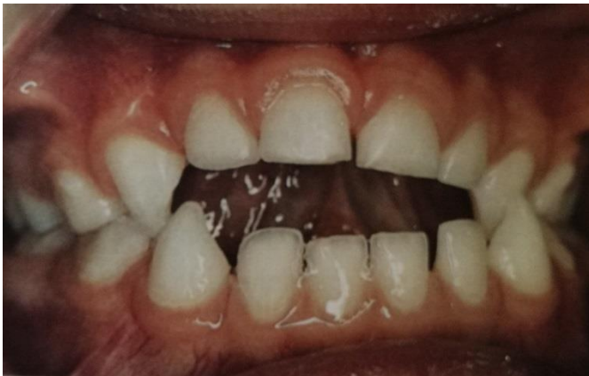
Slika 4. Rezultat sisanja dude varalice. Stražnji križni zagriz, devijacija središnje linije i mandibularni lateralni pomak, te frontalni otvoreni zagriz. Preuzeto s dopuštenjem izdavača (2).

Osim što nepogodne navike dovode do ortodontskih anomalija, povezane su i s problemima s izgovorom nekih glasova (s, n, t, d, l, z i v), nazalnim glasom, a disanje na usta se povezuje i s upalom srednjeg uha, i gubitkom okusa.