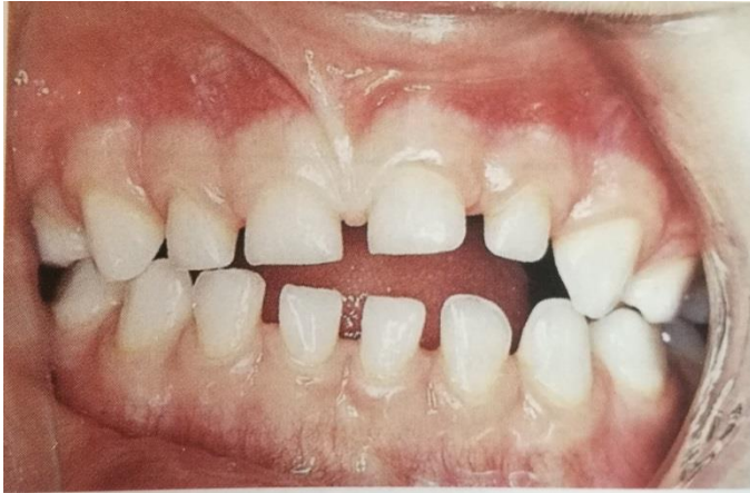
Slika 3. Rezultat sisanja prsta. Asimetrični ljevostrani otvoreni zagriz i preklop.