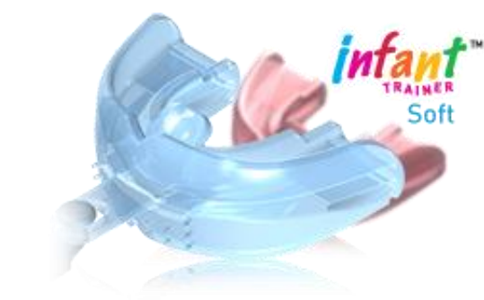
Slika 6. Infant Trainer (18).