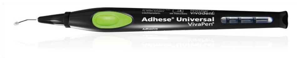
Slika 2. Primjer adhezijskog sustava koji uklanja zaostatni sloj

Zadovoljavajuće svezivanje za površinu cakline i dentina te dostatna debljina hibridnog sloja prednosti su ovoga adhezijskog sustava, dok su rizik od predugog jetkanja, nepotpunog ispiranja, presušivanje ili nedostatno sušenje dentina te preosjetljivost postupka njegovi nedostaci.