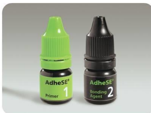
Slika 3. Primjer samojetkajućeg dvokomponentnog adhezijskog sustava

c) "umjereno" jaki adhezijski sustavi imaju pH oko 1.5 i dovode do potpuno demineraliziranog vrha hibridnog sloja i djelomice demineralizirane baze (3). Prijelaz demineraliziranog do intaktnog dentina je postupan i uključuje nazočnost hidroksilapatita u dubini od 1 \mu\text{m} , što omogućuje kemijsku međumolekulsku interakciju, dok im pojačana kiselost u odnosu na "blage" SAS omogućuje bolje uklještenje u caklini i dentinu (3).