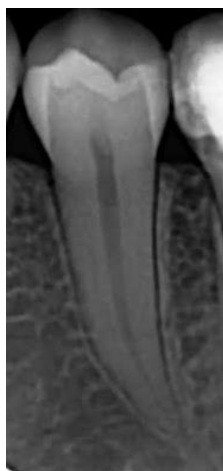
Slika 1. Endodontski prostor.