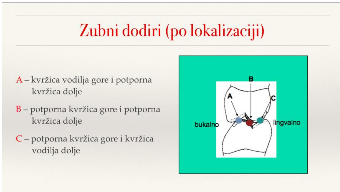
Slika 2. Zubni dodiri.

Oba načina eliminiraju sile koje ne prolaze kroz os i na taj način dopuštaju PDL-u da efektivno preuzima sile potencijalno štetne za kost i da ih znatno ublaži.