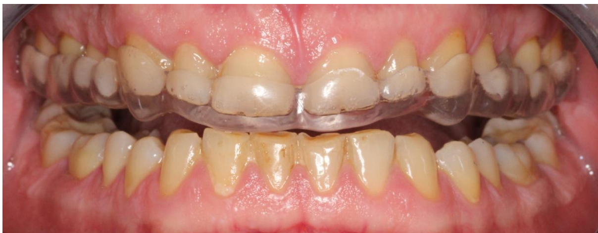
Slika 5. Protruzijska kretnja s okluzijskom udlagom.