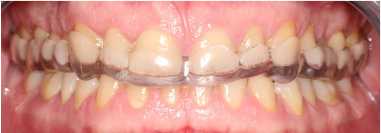
Slika 3. Okluzijska udlaga u ustima pacijenta.