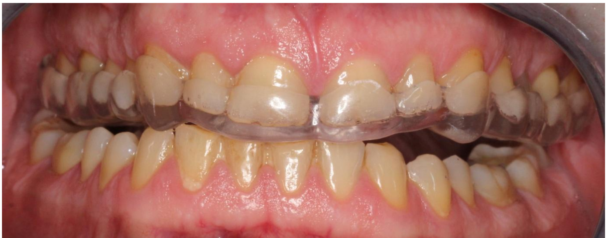
Slika 4. Desna laterotruzijska kretnja s okluzijskom udlagom.