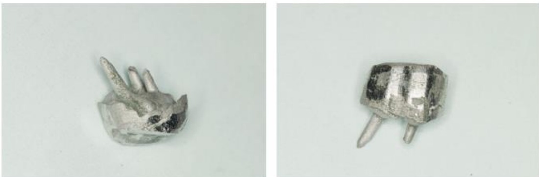
Slika 3. Metalna individualna nadogradnja. Preuzeto s dopuštenjem autora: prof. dr. sc. Ketij Mehulić (24)

Individualne metalne nadogradnje su oblikovane i izrađene na način da svojim oblikom i dimenzijama odgovaraju obliku preparacije korijenskog kanala (Slika 3.). Za izradu individualnih nadogradnja nužno je surađivati sa zubotehničkim laboratorijem, što produžuje terapiju, za razliku od terapije konfekcijskim nadogradnjama.