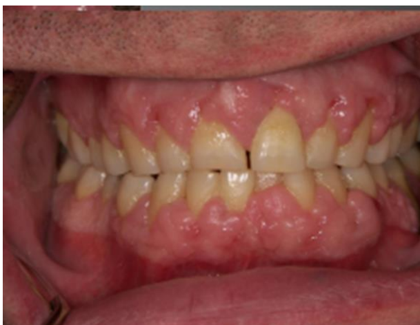
Slika 6. Hiperplazija gingive uzrokovana primjenom ciklosporina.