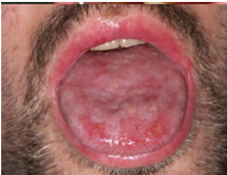
Slika 3. Kronični GvHD eritem i ulceracije dorzuma jezika.

Rizik za nastanak hiperplazije gingive značajno se smanjuje provođenjem dobre oralne higijene i redovitim stomatološkim kontrolama. Od lokalnih preparata za liječenje kroničnog GvHD koriste se kortikosteroidi sami ili u kombinaciji s imunosupresivima (21). Pacijenti s kroničnim GvHD imaju 6 puta veći rizik za nastanak oralnog planocelularnog karcinoma u odnosu na zdravu populaciju. Do razvoja oralnog karcinoma obično dolazi 6-8 godina nakon TKMS (22). Zbog toga je potrebno redovito kontrolirati pacijente kako bi se eventualni karcinom otkrio u što ranijem stadiju. Pacijente treba informirati i upozoriti na povećani rizik te motivirati na prestanak pušenja.