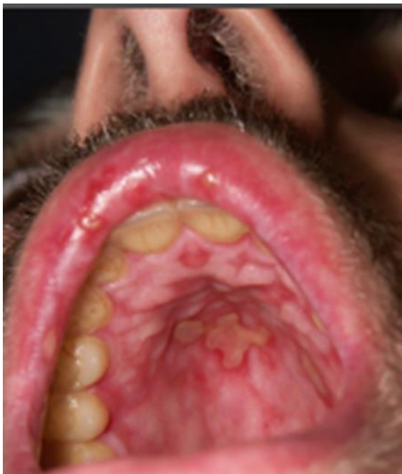
Slika 5. Kronični GvHD ulceracije na tvrdom nepcu.