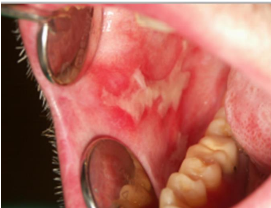
Slika 4. Kronični GvHD erozije i eritem bukalne sluznice.