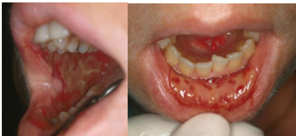
Slika 1. Mukozitis. Preuzeto iz (3).

Predstavlja nadasve iscrpljujuću akutnu komplikaciju uzrokujući bol i disfagiju koja utječe na konzumaciju hrane i lijekova. Zbog oštećenja sluznice, mukozitis dovodi do povećane opasnosti od lokalne i sustavne infekcije, narušava funkciju usne šupljine i ždrijela, značajno smanjujući kvalitetu života (6).