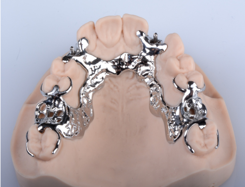
Slika 6. Isprintana i obrađena metalna baza djelomične proteze na modelu gornje čeljusti; slike su vlasništvo autora (autorica: Lucija Božić s dopuštanjem centra Dental Solutions)

Nakon što je stomatolog provjerio dosjed metalne baze i dosjed velike spojke te retencijskih i stabilizacijskih elemenata, slijedi postavljanje voštanih nagriznih bedema i određivanje međučeljusnih odnosa (34).