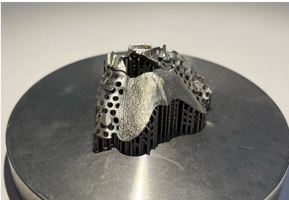
Slika 3. Metalna konstrukcija s potpornjima dobivena 3D printanjem; slike su vlasništvo autora (autorica: Lucija Božić s dopuštenjem centra Dental Solutions)