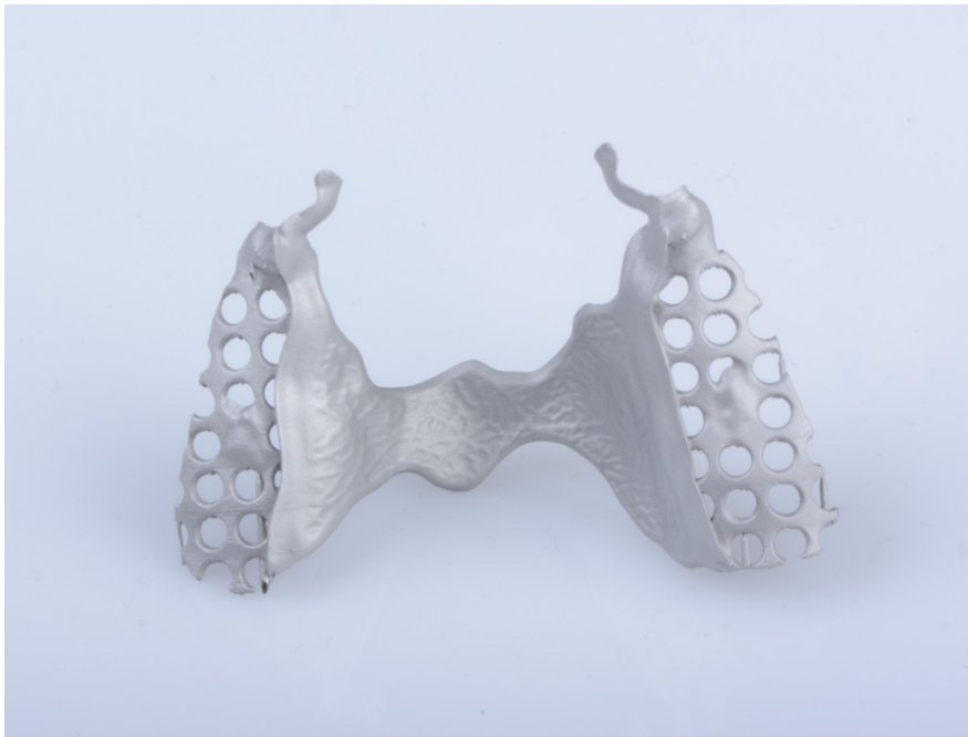
Slika 4. Isprintana metalna baza djelomične proteze prije obrade

Dentalni tehničar obrađuje isprintanu bazu djelomične proteze te ju šalje u ordinaciju na probu (47).