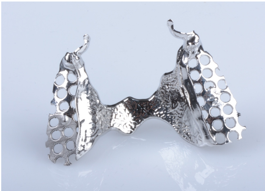
Slika 5. Isprintana metalna baza djelomične proteze nakon obrade, poliranja i čišćenja