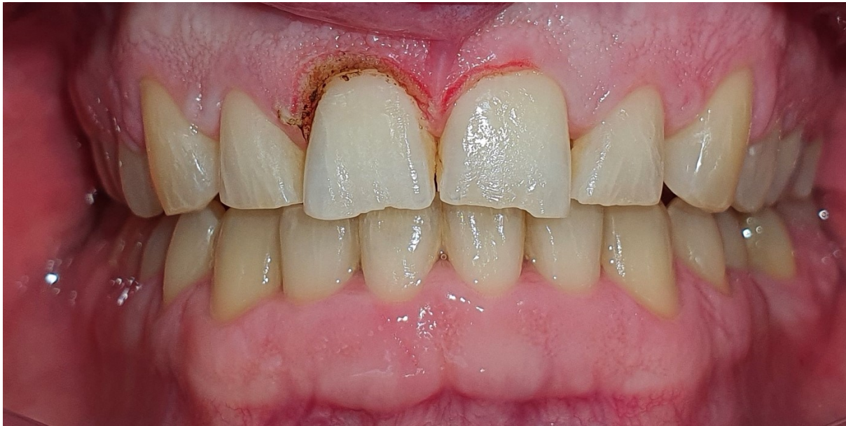
Slika 3. Estetsko ujednačavanje ruba girlande gingive na zubi 11 i 12 i produljenje kliničke krune zuba korištenjem dentalnih lasera, prije izrade estetskih vestibularnih ljuskica.

Produljenje kliničke krune zuba jedan je od najčešćih kirurških zahvata koji se rade u preprotetskoj estetskoj rehabilitaciji pacijenta kada je klinička kruna zuba nosača kratka. Može se raditi mekotkivno produženje kliničke krune, produženje kliničke krune s resekcijom i modeliranjem alveolarne kosti i forsirana erupcija s fiberotomijom ili bez nje u interdisciplinarnoj suradnji sa specijalistom ortodoncije. Katkad je dovoljno napraviti samo mekotkivno produljenje krune gingivektomijom, bilo skalpelom, elektrotomom ili laserom (Slika 3.).