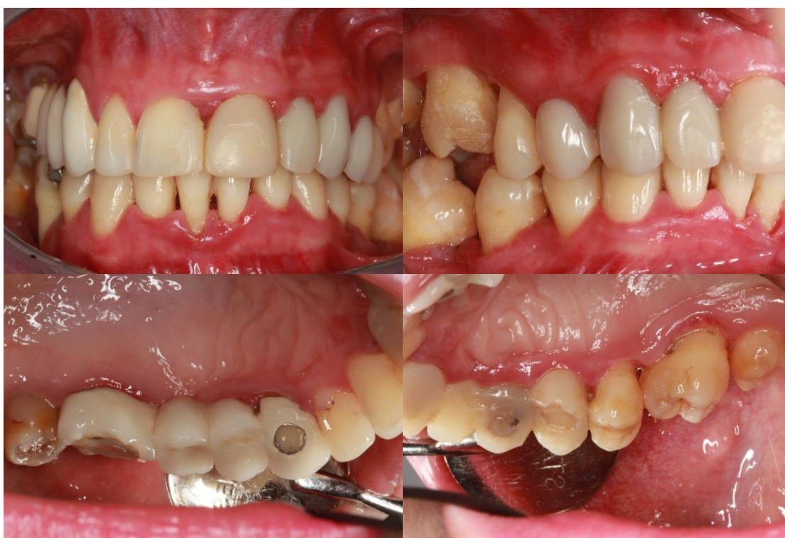
Slika 3. Intraoralni prikaz stanja pacijentice s GDM-om.

Pacijentica s GDM-om, 35 godina, multipara u 3. tromjesečju. Generalizirani parodontitis stadij III, razred C.