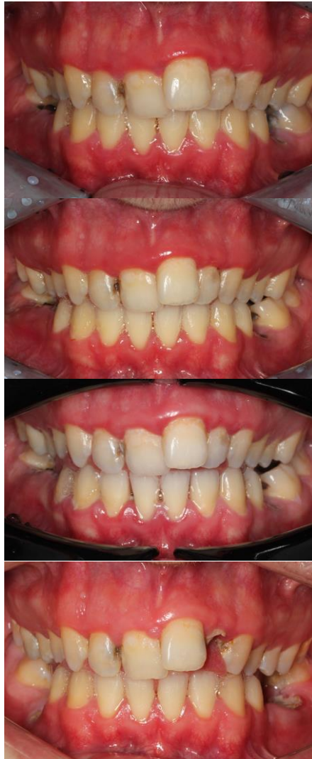
Slika 4. Kontinuirano propadanje denticije uzrokovano visokom koncentracijom šećera koja pogoduje razvoju kariogenih bakterija.