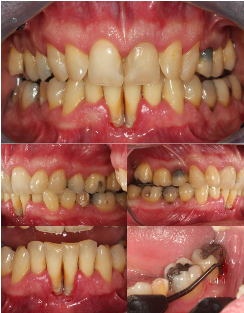
Slika 5. Intraoralni prikaz stanja s nekontroliranim T2DM.