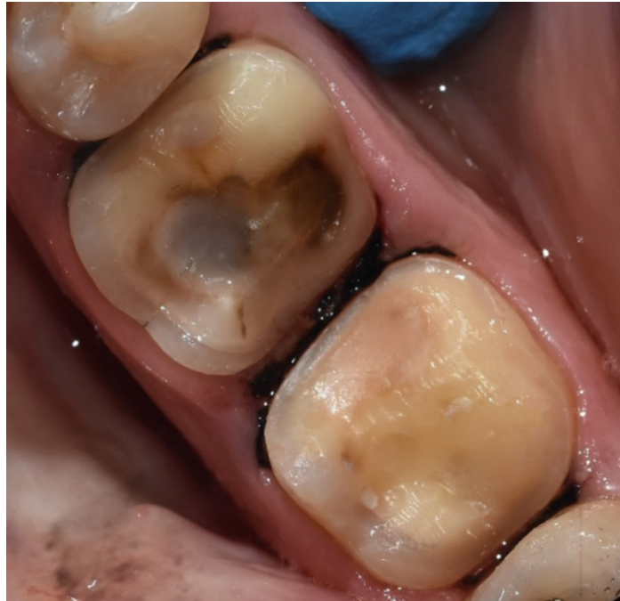
Slika 8. Butt joint -preparacija na zubu 46. Bevel preparacija te aproksimalna slot preparacija na zubu 47.

Ridge up -preparacija izvodi se kada imamo intaktni marginalni greben i želimo sačuvati kontaktnu točku (5).