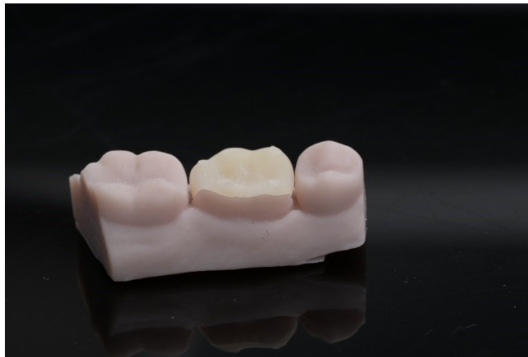
Slika 4. 3D printani kompozitni overlay na modelu

Overlay osim uloge krutog ispuna za nadoknadu izgubljenog tkiva i protektivne uloge ima i dvije kliničke podvrste, to su tabletop i veneerlay . Tabletop je okluzalna ljeska koja se često koristi u terapiji podizanja vertikalne dimenzije okluzije. Na minimalno invazivan način intaktnim zubima mijenja se visina grizne plohe kutnjaka i pretkutnjaka. Veneerlay je kombinacija okluzalne i vestibularne ljeske, najčešće se koristi u kompletnim oralnim rehabilitacijama i estetskim korekcijama osmijeha, a indicirana je u slučaju minimalno invazivnog liječenja nekarijesnih lezija zuba; erozije, atricije, abfrakcije i abrazije (9).