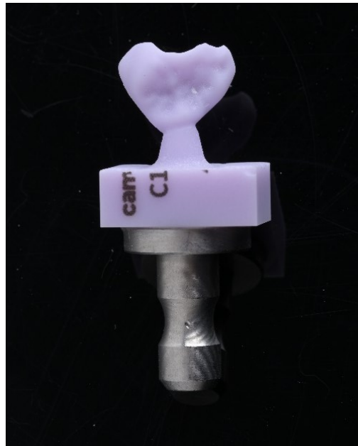
Slika 11. Staklokeramički litij-disilikatni onlay izravno nakon glodanja, prije obrade i kristalizacije