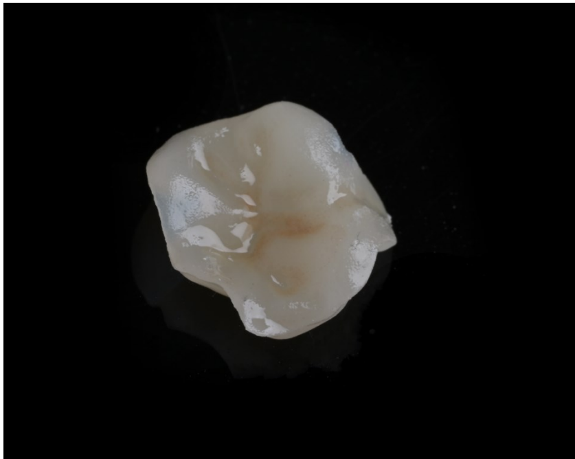
Slika 3. Staklokeramički litij-disilikatni onlay

Onlay je neizravna restauracija koja obuhvaća tradicionalni kavitet I. i II. razreda te jednu ili dvije kvržice (slika 3.). Onlay i overlay prijelaz nalaze se između inlaya i krunice a razvoj tehnologije olakšava njihovu izradu. Time je učestalija upotreba u svakodnevnoj stomatološkoj praksi. Zbog većeg gubitka zubne strukture izravno izrađen kompozitni ispun ne pruža u potpunosti sigurno dugoročno rješenje. Polimerizacijskim skupljanjem kompozitnog materijala tijekom izravne tehnike izrade između slojeva materijala i zuba nastaju mikropukotine te naprezanje na stijenkama zuba. Kako bismo sačuvali preostalu zubnu strukturu, spriječili frakturu oslabljenih stijenki i sekundarni karijes uzrokovan mikropropuštanjem, indicirana je neizravna restauracija (8).