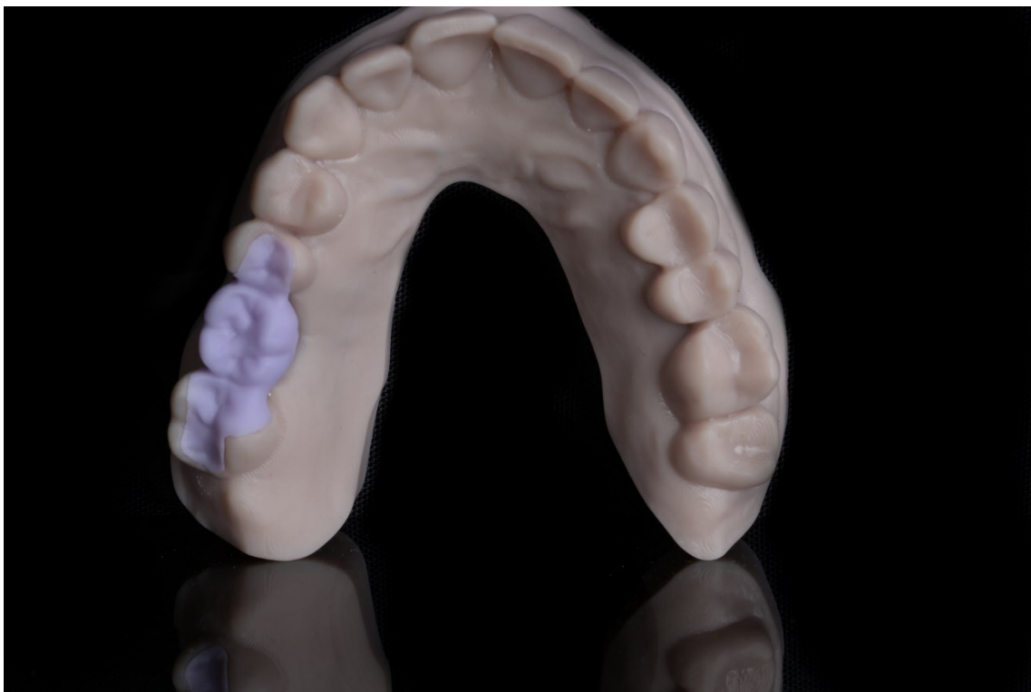
Slika 2. Staklokeramički litij-disilikatni inlay most prije kristalizacije na 3D printanom modelu

Inlay -most je fiksno protetski nadomjestak kojim se nadoknađuje nedostatak jednog zuba u slučaju kada na susjednim zubima postoji indikacija za izraditi inlay (slika 2.). Kako bi bilo moguće izraditi inlay -most, zubi nosači ne smiju biti rotirani, s velikim cervikalnim defektima, bez opsežnog gubitka zdravih tvrdih tkiva ili malih kliničkih kruna. Prednost inlay -mosta je što na zubima nosačima nadoknađuje dio strukture koji nedostaje te pritom pruža uporište za most bez nepotrebnog brušenja zdravog dijela zuba. Izgled preporučene preparacije vrlo često nije ostvariv te na njega utječe postojeći kavitet. Preparacija bi trebala, za keramički inlay -most, biti dubine 1,5 – 2 mm, širine 1/3 među kvržicama, sa svim zaobljenim unutarnjim kutovima i kutom divergencije unutarnjih stijenki od 20 stupnjeva. Rub preparacije potrebno je udaljiti minimalno 1,5 mm od centričnog kontakta te aproksimalni rub preparacije uvijek mora biti supragingivno (7).