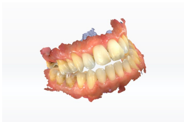
Slika 9. Digitalni otisak