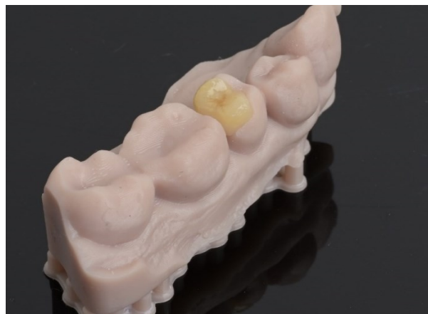
Slika 1. Staklokeramički litij-disilikatni inlay na modelu

Inlay je kruti ispun koji tradicionalno nadoknađuje kavitet I. i II. razreda po Blacku (slika 1.) i svojom indikacijom ne razlikuje se od izravnog kompozitnog ispuna. Napretkom dentalnih materijala, kompozit kao materijal izbora za izradu izravnih ispuna pruža vrlo kvalitetno rješenje za nadoknadu izgubljenih zubnih tkiva kada su u pitanju manji kaviteti. Zbog kompliciranosti izrade neizravnog ispuna koja zahtjeva preparaciju, otisak, izradu nadomjeska u laboratoriju ili ordinaciji te cementiranje, inlay -restauracije nemaju veliku praktičnu vrijednost u stomatološkoj praksi s obzirom na jednostavnost izrade izravnog ispuna te približno jednake kvalitete nadomjeska (4). Istraživanjem je utvrđena mala prednost neizravno izrađenog inlaya upravo zbog manjeg naprezanja na strukturu zuba te na sami materijal uzrokovanog polimerizacijskim skupljanjem, međutim izravna izrada inlay -ispuna smatra se prikladnijom i češće se koristi (5). Nadalje preparacija kaviteta određena je debljinom materijala od kojeg planiramo izraditi inlay , što se u slučaju malih kaviteta ne uklapa u koncept minimalno invazivne stomatologije i očuvanja tvrdih zubnih tkiva, stoga možemo zaključiti da je pravilna indikacija za inlay mala (6).