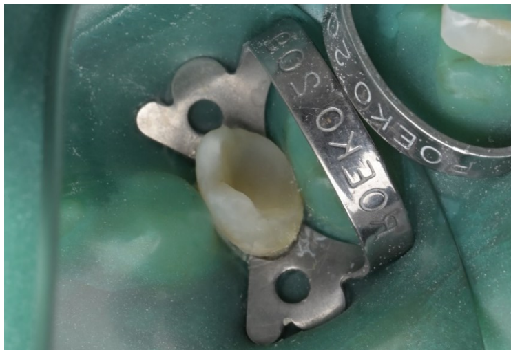
Slika 6. Preparacija zuba za staklokeramički inlay

Preparacija zuba za keramičke krute ispune slična je preparaciji za krute ispune od legura te je u potpunosti jednaka preparaciji za kompozitne krute ispune. Potrebna je divergencija bočnih stijenki od 4 do 10 stupnjeva, ravno dno preparacije i debljina stepenice najmanje 1 mm (slika 6.). Kod keramičkih ispuna prijelaz bočne stijenke na okluzalnu plohu mora biti oštar, zakošenje bi uzrokovalo pucanje tankog sloja keramike pod žvačnim silama. Također svi vanjski prijelazi, tj. završetci preparacije u slučaju inlaya II. razreda po Blacku, onlaya i overlaya moraju biti oštri (slika 7.). Prijelaz dna preparacije na bočne stijenke, kao i svi kutovi preparacije unutar kaviteta, mora biti zaobljen. Najmanja dubina i širina ovise o mehaničkim svojstvima keramike od koje izrađujemo ispun, u većini slučajeva potrebna je najmanja debljina od 1,5 – 2 mm, osim u slučaju litij-disilikatne staklokeramike, kada je dovoljna debljina 1 mm (4).