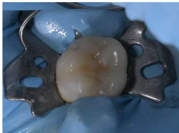
Slika 12. 3D printani kompozitni ispun nakon cementiranja

Postupak izrade 3D-printerom vrlo je sličan, ali još jednostavniji i brži. Dentalni 3D-printeri koriste se DLP-tehnologijom polimerizacije svakog sloja prethodno digitalno rastavljenog nadomjeska i omogućuju preciznost od 50 mikrona. Nakon printanja skidamo kruti ispun s platforme, uklanjamo potporne pinove i ispiremo višak rezina izopropanolom. Nakon temeljitog čišćenja polimerizira se u posebnom uređaju. Tako polimerizirani nadomjestak poliramo i provjeravamo dosjed na modelu (17). Na kraju slijedi cementiranje rada u ustima (slika 12.).