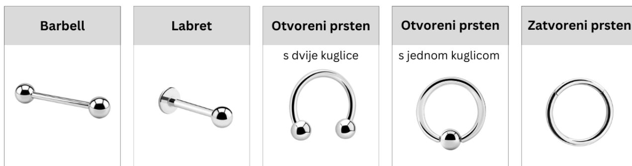
Slika 4: Prikaz osnovnih vrsta nakita za intraoralni i perioralni piercing

Postoje četiri osnovne vrste piercinga u usnoj šupljini. Prva vrsta je barbell , koji se sastoji od ravne šipke s kuglicama na oba kraja. Sljedeća vrsta je labret , nakit s metalnom šipkom koja može biti ravna ili zakrivljena, a na kraju ima pločicu, geometrijski oblik ili dragulj. Treća vrsta je prsten, koji može biti otvoreni ili zatvoreni. Otvoreni prsten završava s jednom ili dvostrukom kuglicom dok se zatvoreni prsten zatvara uz pomoć kuglice ili mehanizma. Na kraju je nakit koji koristi snažnu magnetsku silu za spajanje dvaju dijelova, iako je ovaj tip nakita rjeđe korišten (1, 11, 14).