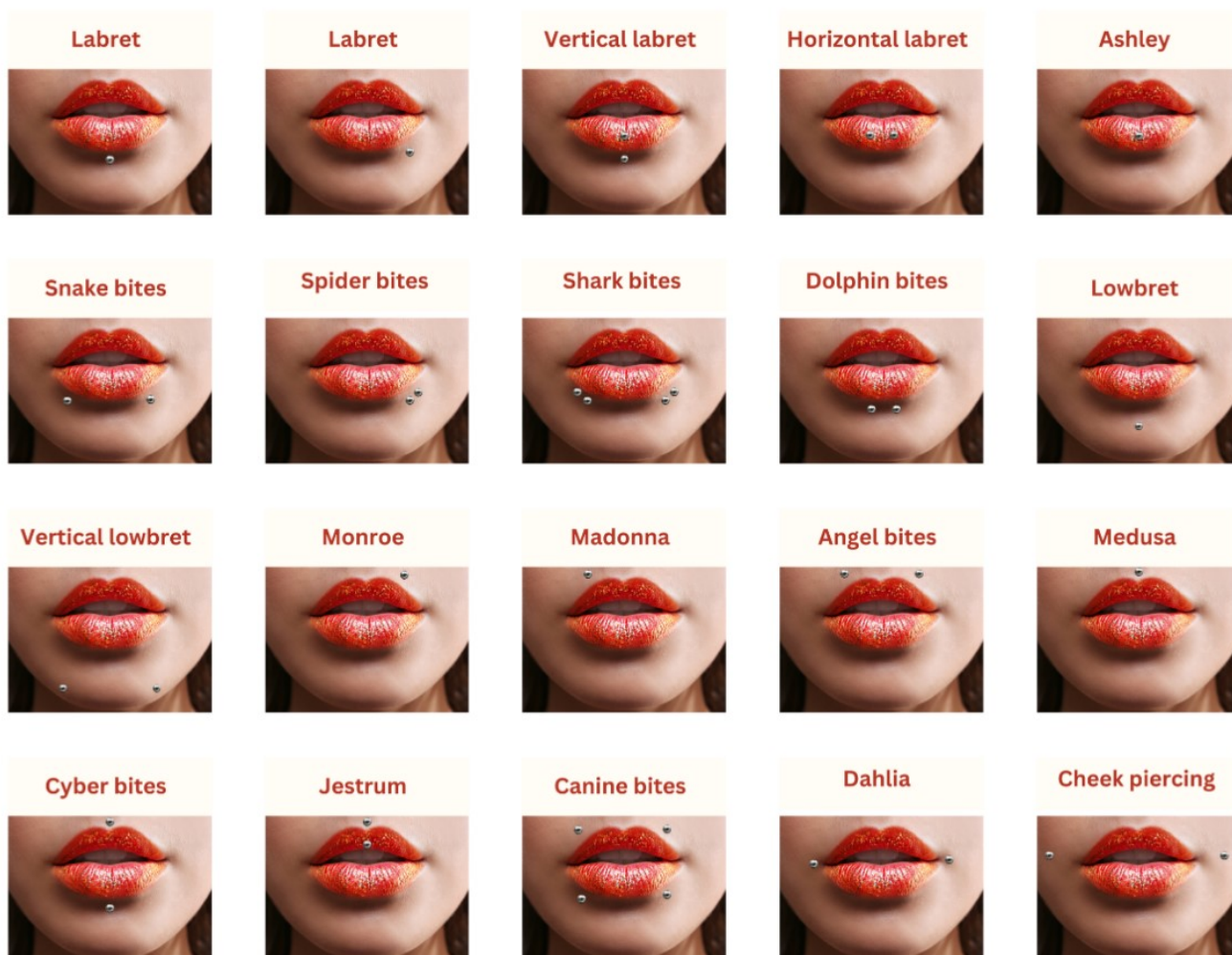
Slika 3: Prikaz najčešćih perioralnih piercinga

piercing na veličine veće od 10 mm, a nakit koji se nosi na tim većim veličinama obično je okrugli ili ovalni „labret plug“ (12, 14).