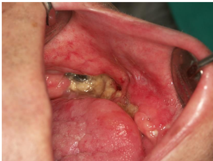
Slika 5. Stadij II osteoradionekeoze – eksponirana kortikalna i djelom medularna kost.