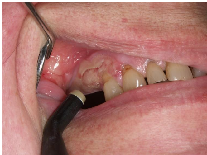
Slika 4. Stadij I osteoradionekeoze – eksponirana kortikalna kost.