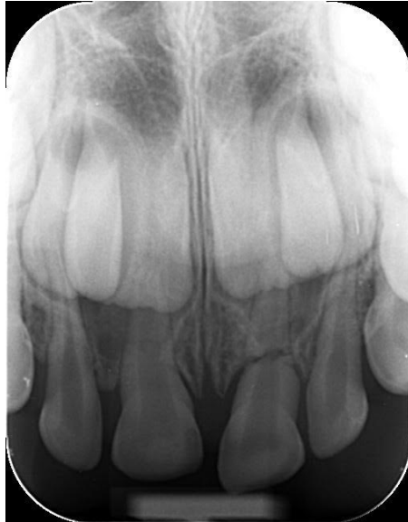
Slika 2. Fraktura korijena. Preuzeto s dopuštenjem autora: izv. prof. dr. sc. Tomislav Škrinjarić