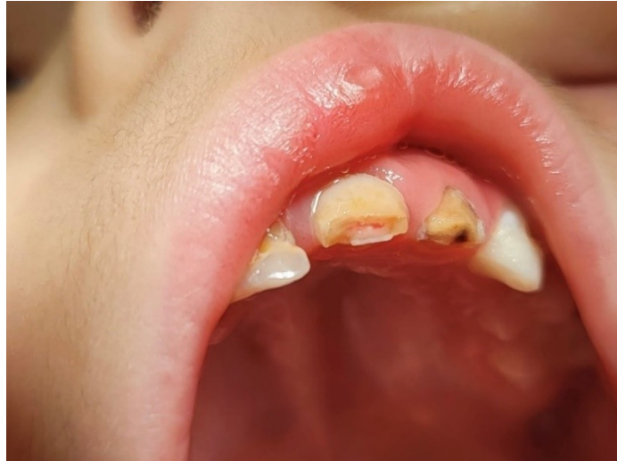
Slika 1. KomPLICIRANA fraktura krune.