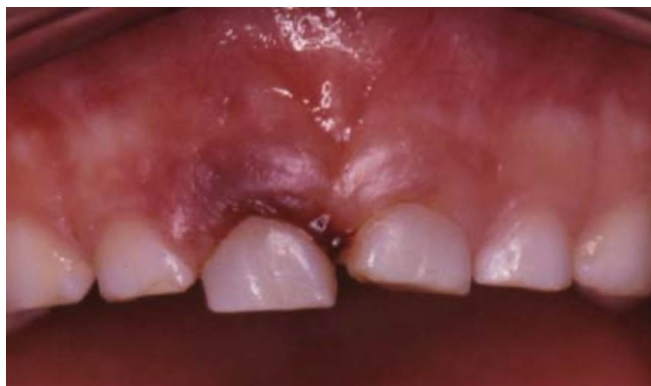
Slika 3. Ekstruzija. Preuzeto s dopuštenjem autora: izv. prof. dr. sc. Tomislav Škrinjarić

Ekstruzija ili djelomična izbijenost jest trauma kod koje je prisutan djelomičan aksijalni pomak zuba iz alveole (slika 3). U kliničkom smislu zub se čini duži i patološki pomičan. Vidljivo je krvarenje iz gingivalnog sulkusa. Liječenje ovisi o stupnju pomičnosti, okluzijskoj interferenciji, razvoju korijena, ali i o samoj suradljivosti djeteta. Zub se ostavlja kako bi se spontano repositionirao ako ne interferira s okluzijom. Ipak u slučaju velike pomičnosti ili ako je zub ekstrudiran više od 2 mm, odlučujemo se za ekstrakciju zuba pod lokalnom anestezijom (3, 19).