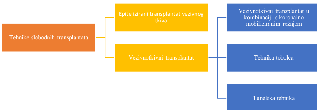
Slika 2. Ilustrativni prikaz podjele tehnika slobodnih transplantata