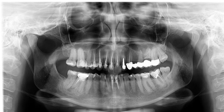
Slika 10. Na rendgenskom prikazu uočavaju se insuficijentna endodonska punjenja na zubima 13, 23, 36 i 46 s periapikalnom radiolucencijom što ukazuje na upalu; zub 25 također pokazuje periapikalnu upalu.