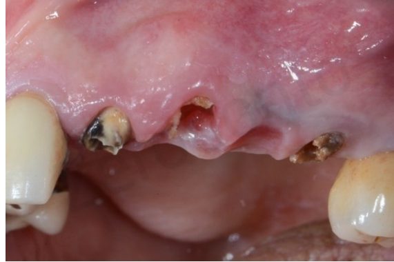
Slika 5. Zubi indicirani za vađenje jer ih nije moguće restaurirati.

zbog neravnomjerne resorpcije kosti ili zbog benigne hipertrofije koštanog tkiva (egzostoze) te takav greben treba kirurški izravnati. Ponekad je potrebno ukloniti maksilarne i mandibularne toruse te maksilarni tuber. To se češće radi pri izradi potpunih ili djelomičnih proteza jer smetaju retenciji (19).