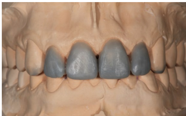
Slika 1. Dijagnostičko navoštavanje na modelu.

Planiranje fiksnoprotetske terapije zahtjevan je proces u kojem osim terapeuta sudjeluje i dentalni tehničar te oni, na osnovi svojih znanja i vještina, predlažu protetski rad koji je u skladu s pacijentovim željama i financijskim mogućnostima (4). Postupak planiranja počinje uzimanjem anamneze i prvim pregledom, nastavlja se radiološkom analizom te analizom zuba nosača, a završava dijagnostičkim navoštavanjem i izradom mock upa (Slika 1.).