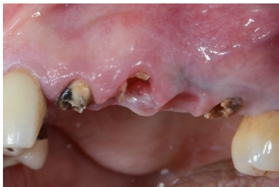
Slika 5. Zubi indicirani za vađenje jer ih nije moguće restaurirati.

zbog neravnomjerne resorpcije kosti ili zbog benigne hipertrofije koštanog tkiva (egzostoze) te takav greben treba kirurški izravnati. Ponekad je potrebno ukloniti maksilarne i mandibularne toruse te maksilarni tuber. To se češće radi pri izradi potpunih ili djelomičnih proteza jer smetaju retenciji (19).