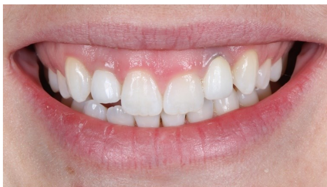
Slika 8. Neskladan tijek gingive što utječe nepovoljno na konačni estetski rezultat protetske terapije.

U skladu s minimalno invazivnim postupcima u modernoj fiksno-protetskoj terapiji, osim estetike zuba tj. bijele estetike, pozornost se pridaje i izgledu mekih tkiva tj. ružičastoj estetici. Time se u konačnici postiže prirodni izgled protetskog rada. Kod mekih tkiva gleda se simetrija i izgled gingivnih rubova, a samo zdrava gingiva bez znakova upale ili resorpcije kosti stvara uvjete za funkcionalni i estetski najpovoljniji rad (Slika 8.). Iz tog razloga prije svake fiksno-protetske terapije treba sondiranjem parodontološkom sondom utvrditi stanje mekih tkiva i oralne higijene te ustanoviti ima li pacijent gingivitis ili parodontitis (25).