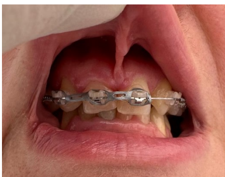
Slika 6. Izraženi frenulum koji je prije ortodontske terapije pogodovao velikoj dijastemi kod pacijentice.

Suvišak mekog tkiva uglavnom nastaje zbog resorpcije kosti te ga je potrebno ukloniti. Maleni ili presnažni frenulumi jezika ili usana mogu ometati nošenje protetskog nadomjestka te se kirurški uklanjaju, a najčešće se frenulektomija provodi kod velikih dijastema (Slika 6.). Stabilnost proteza može se poboljšati vestibuloplastikom kojom se stvara veći sloj pričvrstne gingive (19).