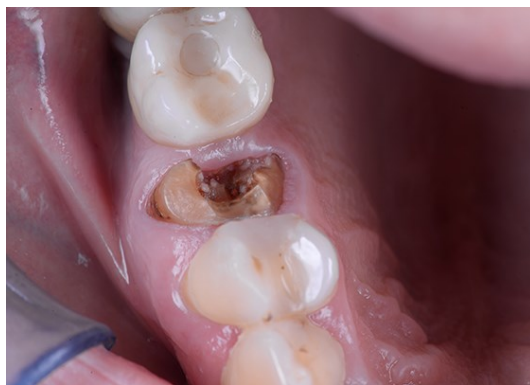
Slika 11. Zub koji nema adekvatnu retencijsku površinu i zahtijeva izradu nadogradnje.

postupak koristi eukaliptol za otapanje gutaperke. Termički postupak uklanja gutaperku zagrijanim instrumentom. Mehanički postupak koji je najčešće korišten, koristi svrdla s nerezucim vrhom, poput Gates-Glidden i Peeso svrdala. Ovaj postupak zahtijeva najveću pažnju zbog rizika od perforacije korijena. Uvijek se započinje s manjim svrdlima i postupno se povećava veličina kako bi se izbjeglo preveliko zagrijavanje korijenskog kanala jer se prilikom rotacije svrdla oslobađa toplina. Važno je ispravno odrediti duljinu kanala jer se tijekom preparacije ostavlja oko 4 mm gutaperke, što služi kao apikalni stop. Time se osigurava dobro brtvljenje kanala, sprečavajući ulazak bakterija prema vrhu korijena. Međutim, ovo je u sukobu s pravilom o retenciji, jer je retencija bolja s duljim intrakanalnim dijelom nadogradnje. Širina nadogradnje trebala bi biti oko trećine ukupne širine korijena. Kod preparacije za nadogradnju treba se sačuvati što više cervikalnog tvrdog zubnog tkiva. Pokazalo se da 1 – 2 mm tvrdog zubnog tkiva supragingivno smanjuje rizik od frakture korijena. To se naziva efekt obruča, a ako ga nije moguće postići preparacijom, pristupa se ortodontskoj ekstruziji zuba ili produljenju kliničke krune (36). Intraradikularni dio nadogradnje kod višekorijenskih zuba se postavlja u veći korijen, kod donjih zuba to je distalni, a kod gornjih palatinalni korijen (21).