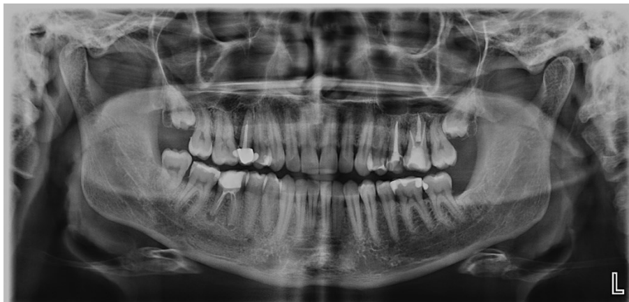
Slika 2. Ortopantomogram pacijenta.

U stomatologiji, ovisno o tome nalazi li se film unutar ili izvan usne šupljine, razlikuju se intraoralne i ekstraoralne rendgenske snimke (8). Najčešće korištena snimka, zlatni standard u fiksno protetskoj terapiji je ortopantomogram koji prikazuje obje čeljusti s pripadajućim zubima i susjednim strukturama kao što su temporomandibularni zglobovi, maksilarni sinusi i nosne kosti (Slika 2.). U planiranju budućeg fiksno protetskog nadomjestka na ortopanu je nužno utvrditi postoje li u usnoj šupljini zaostali korijeni, impaktirani zubi, kronični periapikalni procesi, ciste, frakture zuba ili kosti, aproksimalni i sekundarni karijes itd. Utvrđuje se i stupanj resorpcije kosti te odnos krune i korijena.