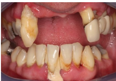
Slika 9. Zapušteno stanje u usnoj šupljini koje zahtijeva sveobuhvatnu pripremu prije protetske terapije.

Za nastanak gingivitisa koji se može proširiti na kost i uzrokovati parodontitis, odgovoran je dentobakterijski plak koji se nakuplja radi nezadovoljavajuće oralne higijene (Slika 9.). Upaljena gingiva je edematozna, eritematozna, često krvari i u takvim uvjetima nemoguće je pravilno izbrusiti zub, postaviti konac u sulkus i uzeti ispravan otisak. Stoga su supragingivno uklanjanje mekih i tvrdih naslaga te kod nekih pacijenata struganje i poliranje korijenova nezaobilazan dio u parodontološkoj pretprotetskoj pripremi. Supragingivne kalcificirane naslage bijelo-žute su boje i nalaze se na vidljivom dijelu zuba, dok subgingivne često mogu biti crne i mogu se dijagnosticirati taktilnim osjetom. Otisak se uzima tek nakon što meko tkivo u potpunosti zacijeli tj. 2 – 4 tjedna nakon inicijalne parodontološke terapije (25).