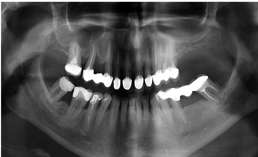
Slika 4. Parodontološki kompromitirani zubi s opsežnim gubitkom potporne kosti.

Zubi nosači imaju ključnu ulogu u osiguravanju trajnosti dentalno sidrenih fiksoprotetskih nadomjestaka. Povoljnije je ako je zub nosač vitalan jer uz sile koje ga inače opterećuju, dodatno je opterećen i zubima koji se nadoknađuju. Zubi s aktivnom parodontnom bolešću ne mogu preuzeti ulogu nosača (Slika 4.).