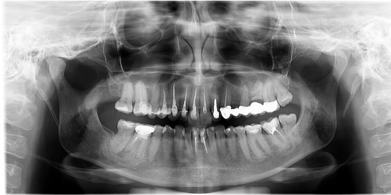
Slika 10. Na rendgenskom prikazu uočavaju se insuficijentna endodonska punjenja na zubima 13, 23, 36 i 46 s periapikalnom radiolucencijom što ukazuje na upalu; zub 25 također pokazuje periapikalnu upalu.