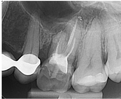
Slika 3. Retroalveolarna intraoralna snimka na kojoj se detaljnije prikazuje korijen i okolna kost pojedinog zuba.

Ako ortopantomogram nije dovoljno jasan, može se upotpuniti retroalveolarnom intraoralnom snimkom na kojoj se detaljnije uočava korijen i okolna kost pojedinog zuba (Slika 3.).