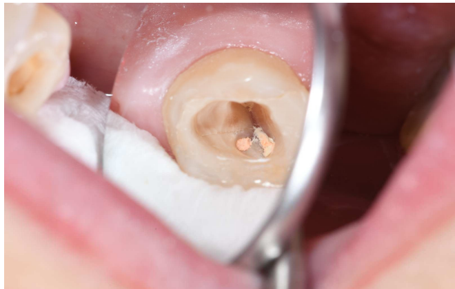
Slika 9. Napuklina distalne stijenke zuba 17

Nakon endodontskog liječenja i pripreme zuba za postendodontsku opskrbu uočena je frakturna linija distalne stijenke (Slika 9).