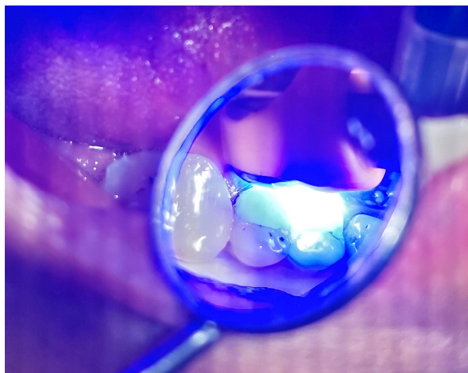
Slika 2. Transiluminacija zuba 15 polimerizacijskim svjetlom

Transiluminacija polimerizacijskim svjetlom je pokazala osvijetljenost jedne polovice zuba (do napukline), dok je druga polovica ostala tamna (Slika 2).