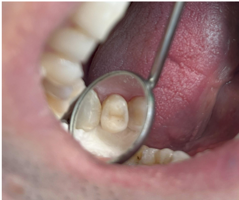
Slika 7. Izgled konačne kompozitne restauracije

S obzirom na to da se radilo o zubu koji je intaktan, bez prethodnih restauracija i karijesnih promjena, provedeni su minimalno invazivni terapijski postupci. Stabilizirana je napuklina i spriječeno njezino napredovanje, prekrivanjem okluzalne plohe kompozitnim materijalom i raspoređivanjem okluzalnih sila ravnomjerno na preostalo zubno tkivo (Slika 7).