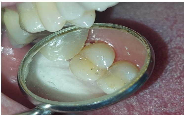
Slika 1. Klinički pregled zuba 15

Transiluminacija polimerizacijskim svjetlom je pokazala osvijetljenost jedne polovice zuba (do napukline), dok je druga polovica ostala tamna (Slika 2).