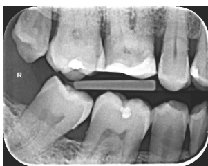
Slika 4. RTG snimak zuba 15 ugrizom u traku