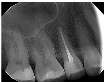
Slika 8. Intraoralni RTG snimak zuba 17

Klinički su bile vidljive fasete na stražnjim zubima što govori u prilog parafunkcijskim kretnjama. Analizom okluzije je utvrđeno da nema prednjeg vođenja. Zubi 16 i 17 imali su opsežne restauracije. Prilikom palpacije bila je prisutna osjetljivost periapikalnog područja zuba 17. Zub 17 nije reagirao prilikom stimulacije etil-kloridom. Analizom RTG snimke bio je vidljiv dubok ispun na zubu 17 i periapikalno radiolucencija (Slika 8). Bez lokalne anestezije je uklonjen ispun i utvrđena je nekroza pulpe zuba 17.