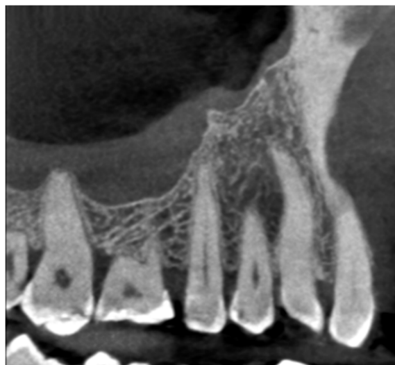
Slika 6. CBCT prikaz zuba 15