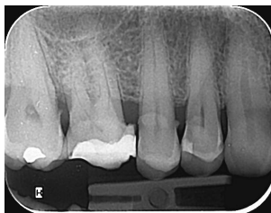
Slika 3. Intraoralni RTG snimak zuba 15

Analizom RTG i CBCT snimki nisu uočeni znakovi periapikalnih patoloških promjena (Slika 3,4,5,6).