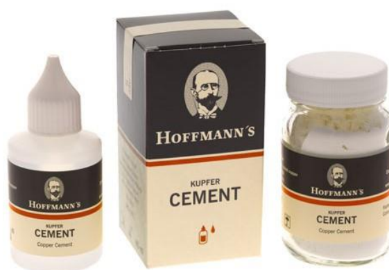
Slika 3. Cinkoksifosfatni cement.

prednosti i nedostatke. Kao slabosti i svojstvene probleme prije svega treba spomenuti visoku topljivost ovih cemenata. Tekući dio sastoji se od fosforne kiseline koja može uzrokovati osjetljivost pulpe nakon tretmana. Cinkoksifosfatni cement nema svojstvo pečaćenja, ne otpušta fluoride i nije translucentan. Da vrijeme „gazi“ ovaj cement najviše je zaslužna adhezivna era i spajanje materijala kemijskom vezom za tvrda zubna tkiva (11). Pripravljavanje cementa vrlo je osjetljiv korak u fazi cementiranja. Cementna prašina podijeli se u nekoliko dijelova te se svaki dio pojedinačno umiješa u tekućinu. U usporedbi s modernijim cementima, klinički rad s cinkoksifosfatnim cementom je izazov (12). Prednosti ovog materijala su ekonomičnost, jednostavnost rukovanja, predvidljivo ponašanje u raznim situacijama te lako uklanjanje stvrdnutog cementa. Koristi se za cementiranje kovinskih i estetskih nadomjestaka s metalnom osnovom, te kod potpuno keramičkih radova (aluminijeva i cirkon-oksida keramika) (1). Najpoznatiji tvornički naziv je Harvard cement (Richter & Hoffmann, Njemačka).