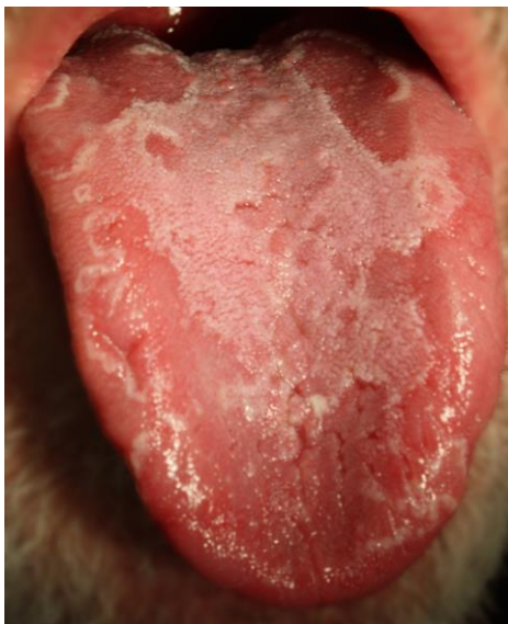
SLIKA 3. Glossitis exfoliativa areata migrans. Preuzeto iz: (15)

Rjeđe se viđa potpuna atrofija jezičnog pokrivača uz nestanak filiformnih i fungiformnih papila koji se naziva lingua glabra . Uz atrofiju jezičnih papila čest nalaz je i poremećaj okusne osjetljivosti – disgeusia . Osim atrofije, uz upalne promjene probavnog sustava viđa se i lingua villosa alba i nigra kod kojih dolazi do povećanja rasta filiformnih papila. Ovakva reakcija zapravo je obrambena, no pri dužoj prisutnosti izaziva površinsku upalu jezika zbog nakupljanja detritusa, mikroorganizama i ostataka hrane. Jako česta patološka promjena jest pojava recidivirajuće aftozne eflorescencije – aphtae recidivantes čija je patogenezna autoimune prirode. (12)