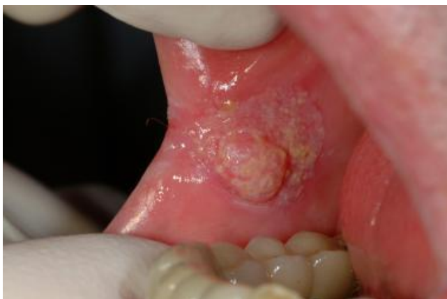
SLIKA 6. Oralni karcinom.

Početna lezija izgleda kao crvenilo sluznice oštro ograničeno od zdrave sluznice, baršunaste ili glatke površine, sa ili bez elemenata bijelih lezija. Karcinom kasnije prelazi u ulceraciju koja ima razrovano dno i uzdignute rubove, ali u početku, još uvijek, ne izaziva jake simptome. Rjeđa slika karcinoma usne šupljine jest egzofitična masa bez ulceracije sa znakovima leukoplakije. Obilježje malignih tumora usne šupljine jest rano metastaziranje u području vratnih limfnih čvorova. (24)