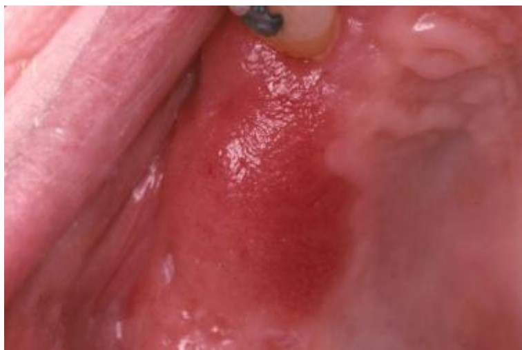
SLIKA 6. Eritroplakija.

Homogenu eritroplakiju najčešće ćemo naći na bukalnoj sluznici ili nepcu, a nehomogenu na području dna usne šupljine i jezika, retromolarnom području ili donjoj usni. (12,13,18)