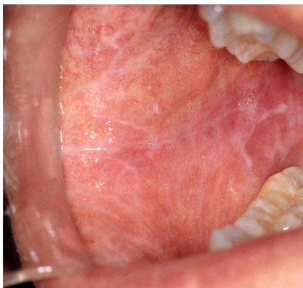
SLIKA 4. Lichen ruber planus. Preuzeto iz: (16)

Kod bolesti hepatobilijarnog trakta dolazi do poremećaja metabolita koji uzrokuju intoksikaciju organizma, a na oralnoj sluznici kao rani simptom pojavljuje se osjećaj bockanja, pečenja, žarenja te promjena okusne osjetljivosti. Karakteristična je i pigmentacija oralne sluznice koja poprima žućkastu boju zbog hiperbilirubinemije. Kod bolesti jetre i gušterače gotovo uvijek je prisutan jak foetor ex ore , te razvoj oralne kandidijaze zbog smanjene obrambene funkcije oralne sluznice. Iako rjeđe, uz kronične jetrene bolesti pojavljuje se lichen planus i erosivus . Oralni lichen ruber po obilježjima se svrstava u autoimune bolesti, no zbog visokog postotka maligne transformacije također se uvrštava u oralne prekanceroze. Osnovni klinički oblik je papula plana. Klinički se dijeli na lichen ruber planus , lichen ruber bullosus i lichen ruber erosivus . Očituju se kao pojava sitnih hiperkeratotičnih papula na bukalnoj sluznici, hiperkeratotičnih plakova ili atrofije, te bule koje prelaze u ulcerozne lezije. (12,13)