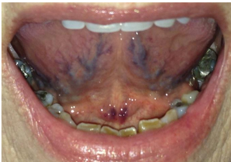
SLIKA 2. Varikoziteti ventralne strane jezika.