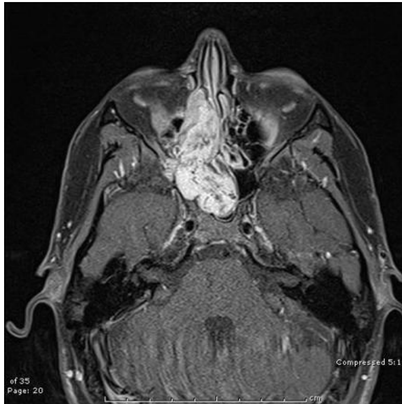
Slika 2. Juvenilni angiofibrom nazofarinksa. Preuzeto iz (14).

angiografija). Biopsija je kontraindicirana zbog obilna i za život opasna krvarenja (12).