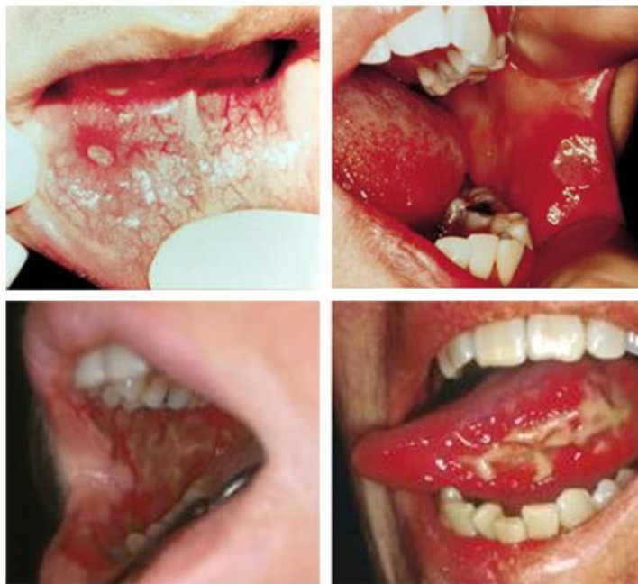
Slika 4. Oralni mukozitis. Preuzeto iz (18).