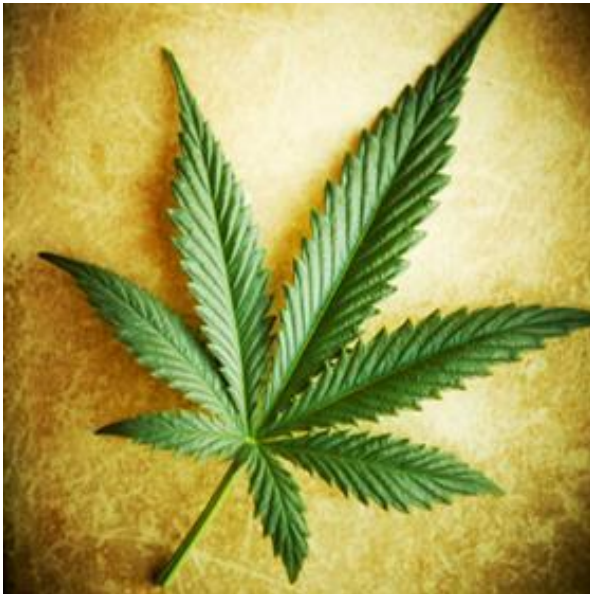
Slika 2. Biljka Cannabis Sativa . Preuzeto: (9).

Farmakološki efekti inhalirane marihuane nastupaju nakon nekoliko minuta i uglavnom prestanu maksimalno do 2-3 sata nakon upotrebe. Klinički se oituje pospano– u, pove anim brojem otkucaja srca u mirovanju i crvenilom konjuktiva (5).