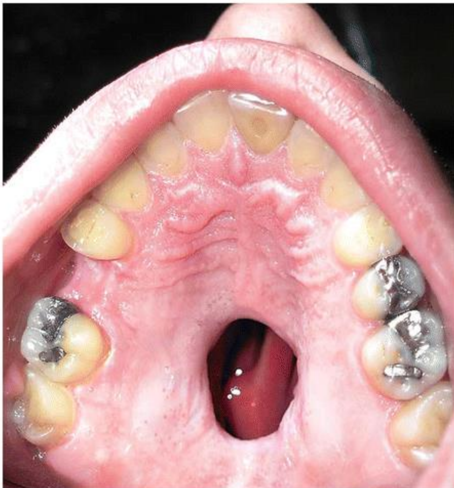
Slika 8. Perforacija nepca zbog izlaganja kokainu. Preuzeto: (22).

Kokain uzrokuje vazokonstrikciju i nekrozu sluznice i okolnih tkiva (hrskavi nih i ko-tanih). Esti kontakt mođe uzrokovati dramati nu sliku destrukcije nosnog septuma, hoana, stijenki paranazalnih sinusa te nepca. Prisutne su ulceracije sluznice te mogu, diferencijalno dijagnosti ki, pomo i u prepoznavanju korisnika kokaina. Iako je intranazalna uporaba kokaina naj e- a, sekundarno nastupaju bitne promjene uo lji ve u usnoj -upljini koje mogu uzrokovati i destrukciju kosti a bitno ih je razlikovati od neoplazmi te, upalnih ili infektivnih procesa (21).