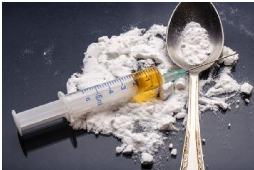
Slika 4. Heroin.

Heroin ili diacetilmorfij polusintetski je opioid (Slika 4). Sintetizira se acetilacijom morfija. Stabla opijuma rastu na Bliskom Istoku, Indiji i u Aziji op enito, te u Meksiku i Južnoj Americi, najviše u Kolumbiji. U nekim se zemljama morfe dobiti na recept za liječenje akutne i kronične boli, infarkta miokarda i u palijativnoj skrbi pacijenata s karcinomom. Heroin je droga koja stvara jaku ovisnost, proizvodi i osjećaj intenzivne euforije. Njegova popularnost dolazi od činjenice da efekti nastupaju vrlo brzo (već nakon 10 sekundi ako se aplicira intravenski). Euforično stanje traje 3 do 4 sata. U kroničnog korisnika, simptomi apstinencijske krize nastupaju već nakon 8 sati. Heroin se morfe injicirati, progutati, ušmrkati ili pušiti inhalacijom pare kad se grije odozdo (5).