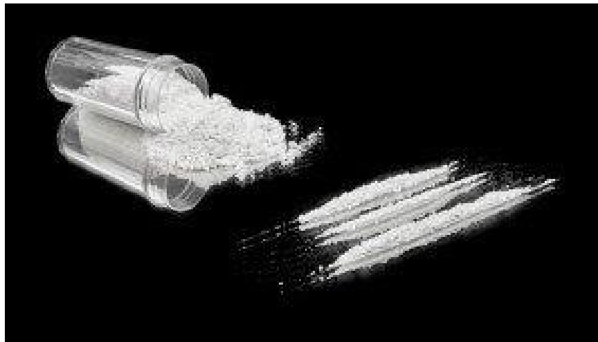
Slika 3. Kokainski prah. Preuzeto: (11).

ili intravenskom administracijom. Škrekõ kokain se pu-i. Kroni na je upotreba povezana s hipertenzijom, sr anim aritmijama i infarktom miokarda (5).