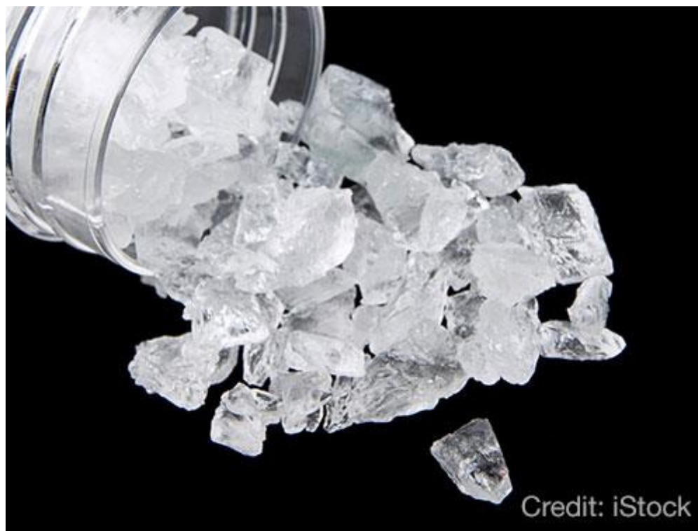
Slika 1. Metamfetamin. Preuzeto: (6).

šMeth mouth 5 je izraz koji se često upotrebljuje u znanstvenoj literaturi da opiše razaranja koje se događaju u usnoj šupljini i na usnoj sluznici. Bukalna površina stražnjih te aproksimalne površine prednjih zubi u korisnika metamfetamina pogođeni su karijesom. Ostali nalazi u usnoj šupljini uključuju stiskanje i lomljenje zuba, temporomandibularne poremećaje, erozije, kserostomiju, gubitak zuba, bruxizam te lošu oralnu higijenu (7).