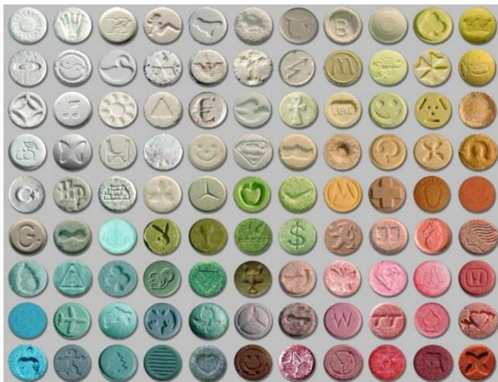
Slika 5. Metilendioksimetamfetamin (MDMA). Preuzeto: (13).

U nekoliko je studija dokazano da do 99% korisnika doflivi suho u usta u vrijeme kori-tenja ecstasyjem . Kserostomija traje do 48 sati nakon uzimanja tableta, a rizik od akutne kserostomije povezan je sa doziranjem. Suho a grla tako er je povezana s konzumiranjem ectasyja . Pove an unos –e era kroz pi a (zbog dehidracije i hipertermije) pove ava incidenciju karijesa i erozija. Povra anje i mu nina pojavljuju se kod nekih korisnika, –to tako er pove ava sklonosti eroziji cakline. Bruksizam je tako er redovita pojava u korisnika ecstasyja , popra en smanjenom vertikalnom dimenzijom krune (okluzalno), te temporomandibularnim poreme ajima. Najve a je trauma vidljiva na donjim molarima. U ovakvih osoba katkad se vide oralne ulceracije, edemi, nekrotiziraju i gingivitisi, osjetljivi i pomi ni zubi, te ugrizi na usnicama, jeziku ili obrazima.