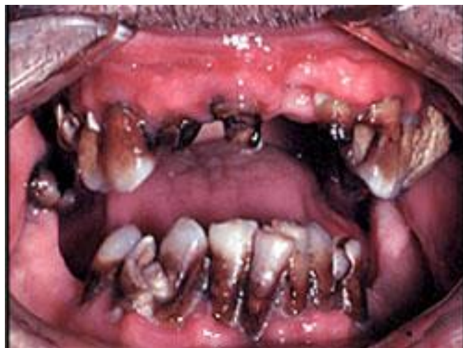
Slika 6. Meth mouth.

Šmeth mouthõ karakterizira posebna vrsta karijesa na vestibularnim/bukalnim te aproksimalnim stranama e- e frontalnih zuba. Agresivna erozija cakline popra ena je destrukcijom parodontnoga tkiva. Zubi su opisani kao crni, umrljani, odumiru i, smrskani ili raspadnuti. Devastiraju i karijes podsje a na radijacijski karijes, karijes bo ice, ali nedostaje mu popratna etiologija. Eliminacijom ostalih uzro nih faktora mogu e je postaviti, diferencijalnu dijagnozu šmeth mouthaõ (17).