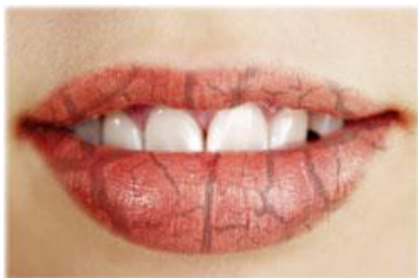
Slika 10. Kserostomija. Preuzeto: (27).

Skupina dvadesetogodišnjaka u rehabilitacijskom centru u Hong Kongu bila je zamoljena da se prisjete svojih iskustava sa drogama. Većina ih je prijavila uporabu više droga, uz najčešće u uporabu ecstasyja (MDMA) i metamfetamina. Oni koji su se koristili ecstasyjem najčešće su imali simptome kserostomije (Slika 10). Često su bili i simptomi parodontnih bolesti i atricije, te bol i probleme s temporomandibularnim zglobom uzrokovane od kljucanja i grčenja fivane muskulature (26).