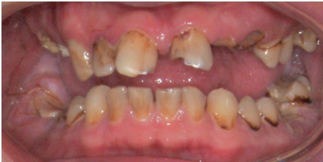
Slika 9. Usna upljina ovisnika heroina. Preuzeto: (24).

Kserostomija je još jedan od tipičnih znakova uporabe heroina. Podsjećajući na „scottonmouth“ pri uporabi kanabisa. Također je bitno i ovdje istaknuti i sinergističko djelovanje s alkoholom i duhanom s kojima se konzumiranje najčešće kombinira (20).