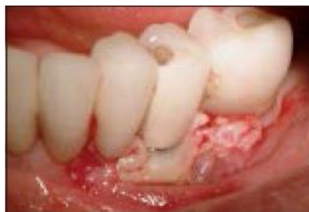
Slika 13: Prekrivanje defekta dvostrukom PRF membranom.

PRF se sastoji od polimeriziranog fibrinskog matriksa u kojemu su stanice trombocita, leukocita, citokini i cirkulirajuće matične stanice koje otpuštaju različite faktore rasta. PRF