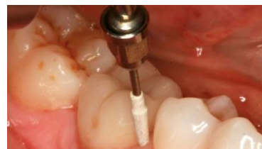
Slika 6: Uklanjanje biofilma pomoću ultrasoničnog nastavka presvučenog politer-eterketonom.

Ultrazvučni uređaji sa polieter-eterketon presvučenim vrhovima nisu nužno uspješniji od ručnog mehaničkog čišćenja pa bi ih trebalo kombinirati s poliranjem površine i protetskih komponenti pomoću gumica i polirajućih pasta ili pjeskarenjem. Kod novije tehnologije poput Vector systema, horizontalne vibracije konvertirane su u vertikalne, što rezultira kretanjama radnog dijela paralelno s površinom implantata i manjom mogućnosti oštećenja (3, 13).