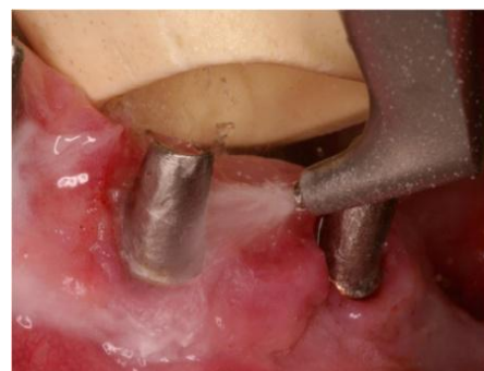
Slika 7: Detoksikacija površine implantata pomoću pjeskare s glicinskim prahom. Preuzeto: (3)

Uređaji za pjeskarenje razlikuju se po mediju nosaču. Standardne pjeskare su na bazi natrijevog bikarbonata koji je prilično abrazivan i može oštetiti površinu implantata i okolna meka i tvrda tkiva. Novije pjeskare bazirane su na nisko abrazivnom glicinskom prahu. Rabi se posebno dizajniran nastavak kojim se izvode kružni pokreti od krune prema dubini paralelno sa površinom implantata bez dodira. Nakon pjeskarenja adherencije stanica još je moguća, ali je količina bakterija smanjena jer je površina sterilnija. Također su dubina džepova i krvarenje pri sondiranju znatno smanjeni (3, 13).