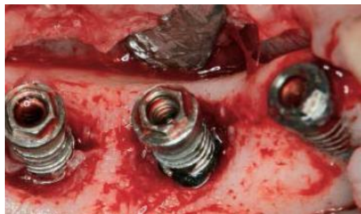
Slika 14: Prikaz površine implantata nakon korištenja Er:YAG lasera.

Er:YAG laser se pokazao učinkovitim u uklanjanju subgingivnog plaka i kamenca bez oštećivanja površine implantata. Energiju Er:YAG lasera apsorbiraju molekule vode pa pri aplikaciji ne postoji opasnost od povišenja temperature i karbonizacije stanica okolnih tkiva (6).