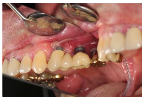
Slika 8: Izgled periimplantatnog tkiva tjedan dana nakon resektivnog zahvata. Preuzeto: (3)

Resektivne tehnike upotrebljavaju se kod umjerenih horizontalnih defekata i vestibularnih dehiscijencija u neestetskoj regiji. Takva vrsta terapije podrazumijeva modifikaciju i remodelaciju površine kosti (osteoplastika), ostektomiju, remodelaciju izložene površine implantata (implantoplastika) i apikalnu repoziciju režnja. Koraci u resektivnoj terapiji su uklanjanje supragingivnog plaka te kirurški pristup uz odizanje režnja koji omogućuje eliminaciju većeg broja bakterija. Slijedi uklanjanje granulomatoznog tkiva, bakterijska dekontaminacija uz mogućnost zaglađivanja i poliranja suprakrestalnog dijela implantata te korekcija koštane arhitekture. Time se pokušava postići bolja kontrola plaka i zaustaviti tijek bolesti. Resektivna terapija rezultira smanjenjem krvarenja pri sondiranju, dubine sondiranja i kliničkih znakova upale. Istraživanja su pokazala da se ne zaustavlja, već samo smanjuje daljnji gubitak kosti. Dodatni postupci dekontaminacije površine implantata rezultiraju smanjenjem broja bakterija, no ne pridonose kliničkim rezultatima. Resektivna terapija je prihvatljiva terapija, ali samo u slučaju usporavanja ili eventualno zaustavljanja