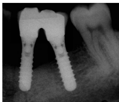
Slika 4: Radiološka snimka horizontalnog gubitka kosti oko implantata. Preuzeto: (13)

Spiekermann razlikuje četiri tipa defekta oko implantata: horizontalni (klasa I), u obliku ključa (klasa II), u obliku lijevka (klasa III a i b) i horizontalni cirkularni (klasa IV) defekt (3). Naprednim radiološkim tehnikama kao što je CBCT preciznije se može odrediti tip defekta oko implantata, a time i terapija.