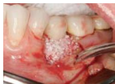
Slika 11: Ispunjavanje defekta koštanim nadomjestkom. Preuzeto: (16)

Za augmentaciju se upotrebljava autogena, alogena i ksenogena kost te kombinacija različitih transplantata. Koštani nadomjesci vode stanice koje sudjeluju u regeneraciji i inkorporiraju se u novonastalu kost, što rezultira ispunjavanjem defekta. Uspoređujući rezultate dobivene augmentacijom autogenim i ksenogenim graftom, autogeni je pokazao manji postoperativni gubitak kosti nego ksenogeni graft (15).