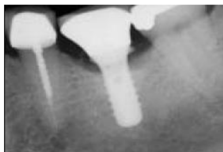
Slika 3: Radiološki prikaz koštanog defekta uzrokovanog zaostatnim cementom. Preuzeto: (16)

Najčešća su titan i dentalni cement, a okružena su upalnim stanicama. Mehanizam nastanka tih stranih tijela je nepoznat, kao i njihov utjecaj na etiologiju periimplantitisa. Razvijena je teorija da je periimplantitis odgovor na strano tijelo, neovisan o prisutnosti bakterija, a neki autori smaraju da je cementitis najvažniji jatrogeni