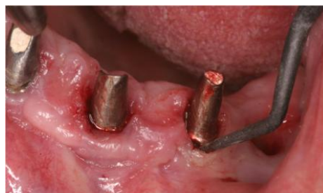
Slika 5: Uklanjanje biofilma sa površine implantata karbonskom kiretom. Preuzeto: (3)

titana i nisu indicirane za čišćenje titanskih implantata, ali se mogu upotrebljavati na titan cirkon-oksidu i titan oksinitridu. Titanom presvučene kirete slične su tvrdoće pa ne bi trebale grebati površinu. Kirete od karbonskih vlakana mekše su od implantata, mogu se koristiti za čišćenje, ali lako pucaju. Teflonske kirete slične su kiretama sa karbonskim vlaknima i rabe se u kombinaciji sa pjeskarom. Plastične kirete su najslabije i imaju ograničenu upotrebu. Čišćenje ručnim instrumentima i piezoelektričnim uređajem može kratkoročno smanjiti krvarenje pri sondiranju (3, 13).