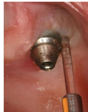
Slika 10: Uklanjanje biofilma s površine implantata pomoću lasera. Preuzeto: (13)

U novije metode dekontaminacije površine implantata i sterilizacije okolnih tkiva ubrajaju se laseri. Različiti tipovi nastavaka upotrebljavaju se pri uklanjanju marginalne gingive i ulasku u marginalni sulkus. Svrha im je čišćenje složene površine tijela implantata, dekortifikacija kosti, sterilizacija tvrdih i mekih tkiva oko implantata i detoksikacija bakterijskih metabolita. Pridonose smanjenju bakterija i do 90%, ali ne potiču rast stanica. (3, 6).