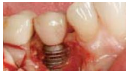
Slika 9: Prikaz površine implantata odizanjem režnja.

Pod lokalnom anestezijom izvodi se marginalna incizija i odiže režanj pune debljine s periostalnim otpuštanjem koje omogućuje dovoljnu mobilizaciju za dobro vidno polje i koronalni pomak režnja pri šivanju. Rezultati bez jasnog vidnog polja i direktnog pristupa su upitni (16).