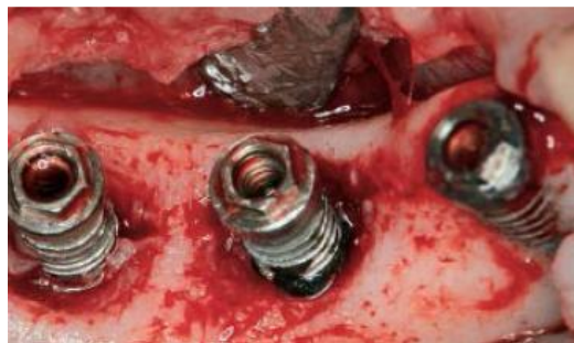
Slika 14: Prikaz površine implantata nakon korištenja Er:YAG lasera. Preuzeto: (6)

Er:YAG laser se pokazao učinkovitim u uklanjanju subgingivnog plaka i kamenca bez oštećivanja površine implantata. Energiju Er:YAG lasera apsorbiraju molekule vode pa pri aplikaciji ne postoji opasnost od povišenja temperature i karbonizacije stanica okolnih tkiva (6).