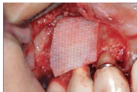
Slika 12: Upotreba resorptivne kolagene membrane u regenerativnoj terapiji. Preuzeto: (17)

Najbolji rezultati popunjavanja defekta su uz uporabu membrana. Primjena membrana ne vrijedi ništa bez koštanih graftova, jer se kod implantata ne može postići klasična tkivna i koštana vođena regeneracija (GTR i GBR), ali kombinacija grafta i membrane u studijama kod pasa pokazuje najbolje rezultate reoseintegracije.