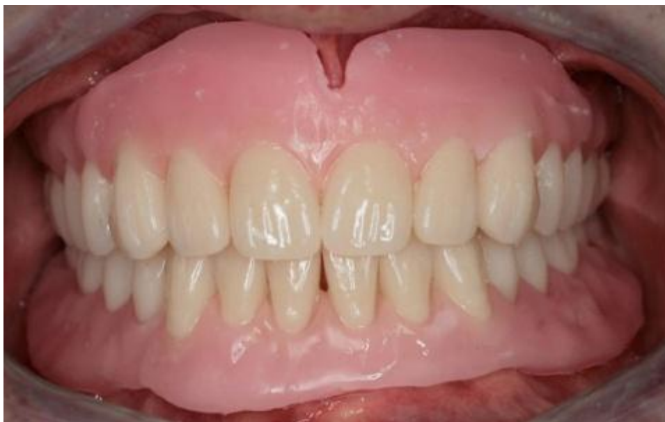
Slika 15: Kontrola rubova i postave zubi na budućim protezama.

Ako su očekivanja ispunjena, proteze se šalju u laboratorij na ulaganje i završavanje.