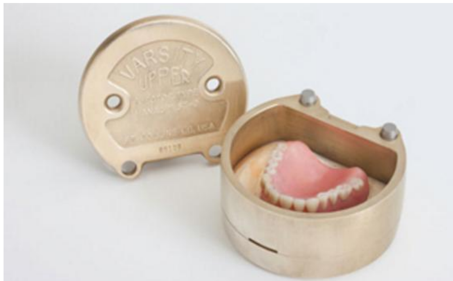
Slika 16: Ulaganje proteze u kivetu.

Slijedi, kao i kod konvencionalne metode, kivetiranje i kuhanje akrilata (Slika 16). Vrlo je važno pažljivo raditi i pridržavati se uputa proizvođača. Time se sprječava poroznost i krhkost materijala, a proteze budu kvalitetnije, funkcionalnije, dugotrajnije i estetski idealne. Zadnji postupak laboratorijske obrade je završno čišćenje i poliranje proteze. (3,12)