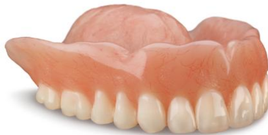
Slika 3: Akrilatna proteza. Preuzeto: (5)

Godine 1937. otkriven je metil metakrilat kao materijal za proizvodnju baze proteze. U to je vrijeme dobro prihvaćen zbog cijene, jednostavnog rukovanja i dobre estetike. Ubrzanom modernizacijom i razvojem tehnologije, na tržištu se pojavljuju noviji materijali s boljim svojstvima (Slika 3).