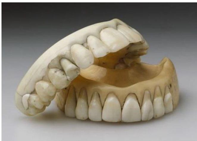
Slika 1: Proteze izradene od slonove kosti.

Materijali za proteze u ono su doba bili drvo, kosti, slonova kost te zubi raznih životinja i preminulih ljudi (Slika 1). Već od 1500. godine rezbarile su se potpune proteze od slonove kosti. Prije otkrića kaučuka izrađivale su se i od pečenog porculana. Od 1780. godine pojavljuju se štancane metalne ploče, zlatne ili aluminijske.