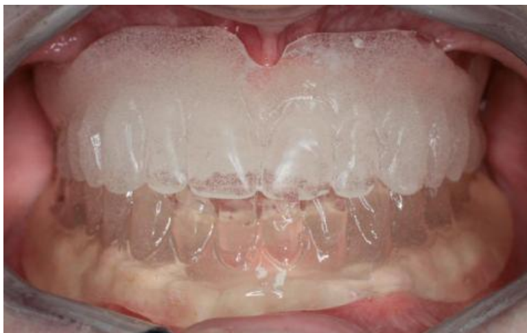
Slika 12: Kontrola rubova dvostrukih proteza. Preuzeto: (6)

Potrebno je prekontrolirati kako dvostruke proteze sjedaju u ustima pacijenta (Slika 12). Ako je sve zadovoljavajuće, slijedi oblikovanje funkcionalnih rubova.