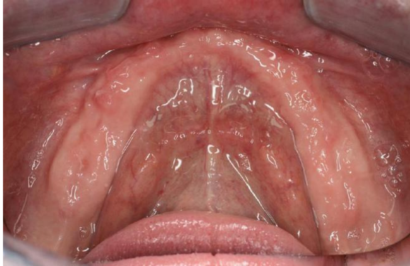
Slika 5: Ležište baze donje proteze. Preuzeto: (6)

Ležište donje proteze čine alveolarni greben, milohioidni greben, linea oblička eksterna, trigonum retromolare i fovea retromilohioidea (Slika 5). (3)