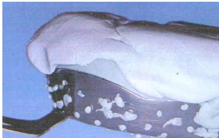
Slika 8: Izrada gornjeg dijela kalupa.

Rubovi otiska izoliraju se vazelinom, a baza proteze pažljivo se prekriva silikonom (Slika 8).