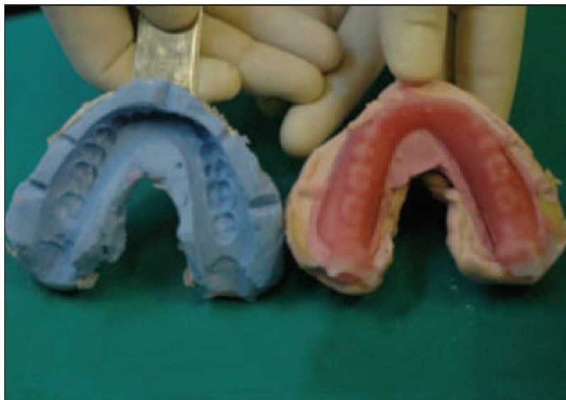
Slika 11: Dvostruka proteza izrađena od voska.