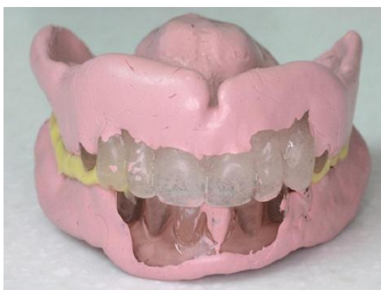
Slika 14: Funkcijski oblikovane dvostruke proteze s okluzijskim registratom.

Završavamo registracijom pacijentova zagriža te odlukom o boji budućih zubi. Preporuka je koristiti silikon zbog boljih svojstava od voska (Slika 14).