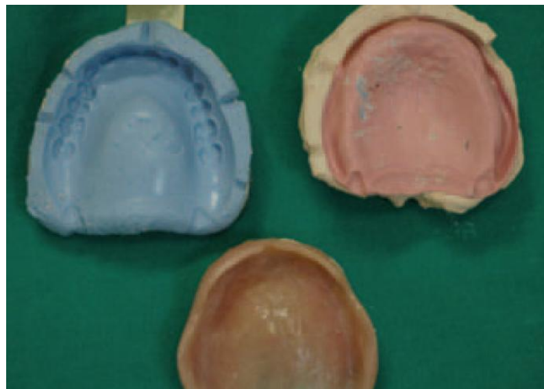
Slika 9: Rastvoreni kalup s izvađenom protezom.

Nakon stvrdnjavanja materijala kalup se može rastaviti (Slika 9). Bitno je dobro prekontrolirati obje polovice kalupa i predvidjeti eventualne pogreške. Ako je sve zadovoljavajuće, proteza se opere i vrati pacijentu, a kalup dezinficira i šalje u dentalni laboratorij. (2,12,14)