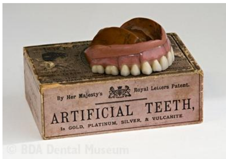
Slika 2: Proteza s bazom od tvrde gume.

Tek otkrićem vulkanizacije kaučuka (Goodyear, 1854.) i njegovom primjenom u stomatologiji proizvode se proteze od tvrde gume (Slika 2) kojima je baza reprodukcija alveolarnog grebena (3,4).