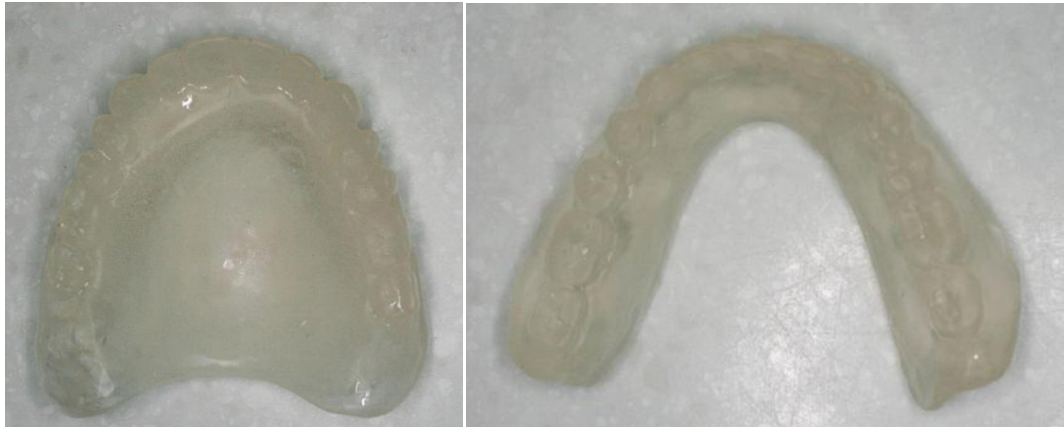
Slika 10: Akrilatne dvostruke proteze.