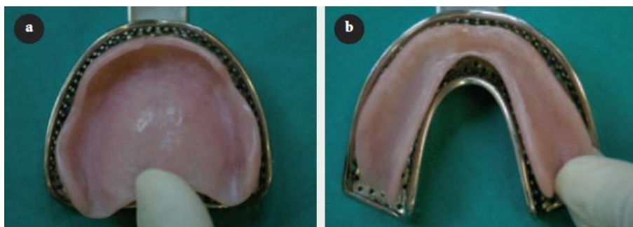
Slika 6: Odabir odgovarajuće žlice za izradu kalupa: a) maxilla, b) mandibula. Preuzeto: (2)

Koristeći stare proteze, oblikujemo kalup gornje i donje proteze. Materijal izbora je kitasti silikon. Uz pomoć odgovarajuće žlice (Slika 6), potrebno je uzeti otisak preko proteze u ustima pacijenta ili manualno uroniti protezu u žlicu s materijalom.