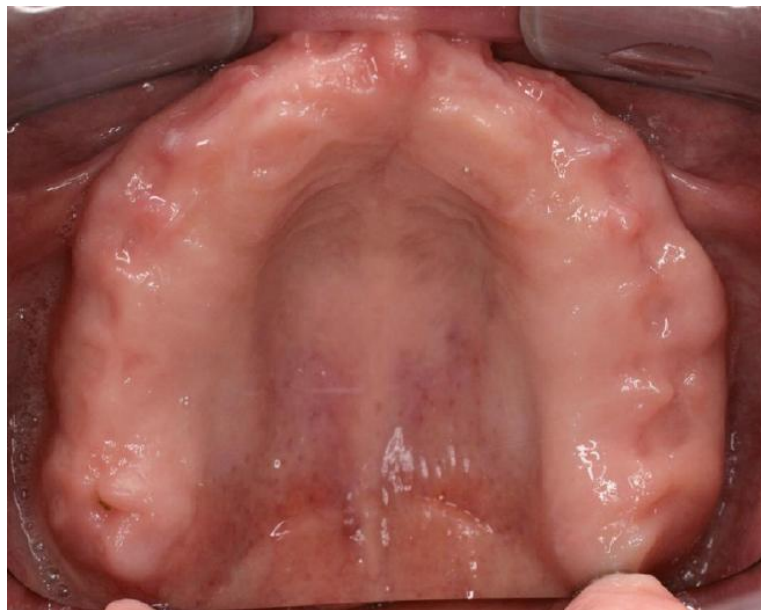
Slika 4: Ležište baze gornje proteze. Preuzeto: (6)

Ležište baze gornje proteze čine alveolarni greben, tvrdo nepce, tuber maksile i krista zigomatiko-maksilaris, iza koje se u bezubim ustima nalazi paratubarni prostor, koji je važan za retenciju totalne proteze (Slika 4).