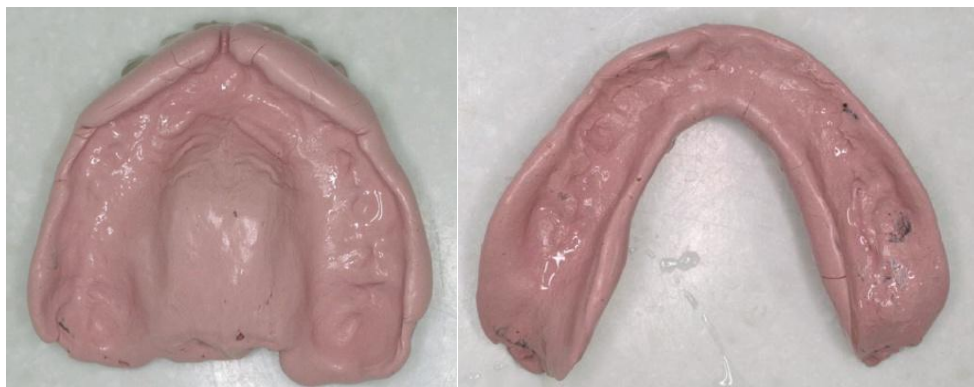
Slika 13: Dvostruke proteze s izrađenim funkcionalnim rubovima.

Pomoću obraznog luka potrebno je odrediti položaj proteze u odnosu na bazu lubanje. Ova faza odgovara određivanju protetske ravnine kojom se koristimo kod konvencionalne izrade proteza. Protetska ravnina u prednjem području mora biti paralelna s bipupilarnom linijom, a u bočnim dijelovima paralelna s Camperovom, nazoaurikularnom ravninom. (14)