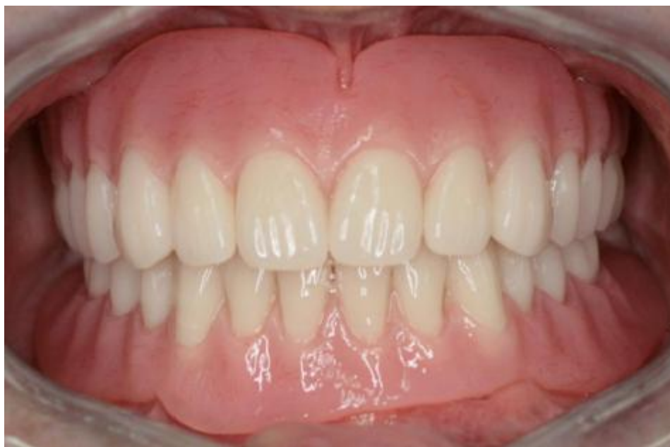
Slika 17: Gotove proteze u ustima pacijenta. Preuzeto: (4)

Prvi pregled zakazuje se za tri dana kada se pregledava oralna sluznica radi mogućih dekubitusa te poboljšanja artikulacije i fonacije. Ako je sve u redu, pacijent se naručuje na kontrolu za tri tjedna kada se proteza dodatno ubrusi do postizanja optimalne okluzije. (2,6,16)