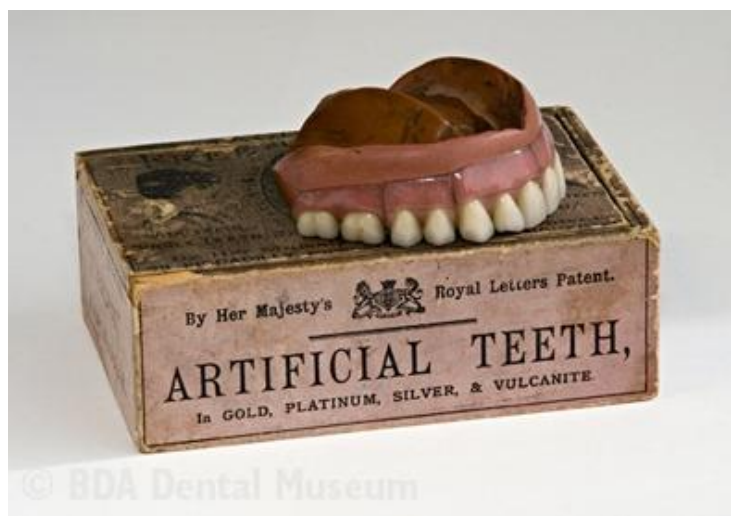
Slika 2: Proteza s bazom od tvrde gume. Preuzeto: (5)

Tek otkrićem vulkanizacije kaučuka (Goodyear, 1854.) i njegovom primjenom u stomatologiji proizvode se proteze od tvrde gume (Slika 2) kojima je baza reprodukcija alveolarnog grebena (3,4).